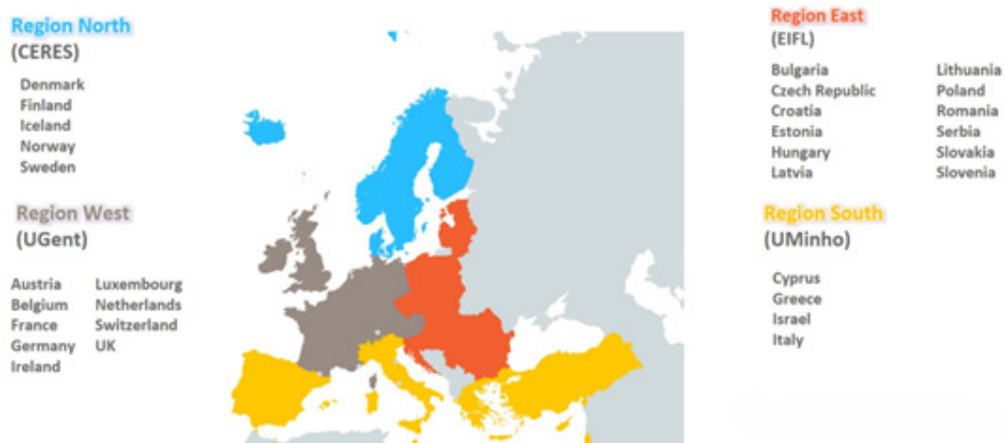
1. ábra Az OpenAIRE-Advance európai résztvevői és koordináló szervezetei