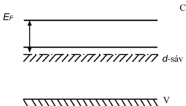
3. ábra. Az energetikai állapotok modellje, mely megmagyarázza a \text{Cu}_2\text{B}^{\text{II}}\text{Ti}_3\text{S}_8 félvezető vegyületek áramvezetőképességét a \text{B}^{\text{II}} kémiai elemek által létesített d-sávval

Az elektromos vezetőképesség jelentősebb növekedését észleljük a Z \geq 26 (2. ábra), ami azzal magyarázható, hogy ebben az esetben a \text{B}^{\text{II}} kémiai elemek d-elektronhéjai már telítettebbek elektronokkal., melyek aktív részt vesznek a szennyezéses áramvezetésben. Ez utóbbiban az elektronok mozgékonyasága sokkal nagyobb, mint a d-sávban az ugrásszerű vezetéskor. Nyilvánvaló, ezzel magyarázható a \text{Cu}_2\text{B}^{\text{II}}\text{Ti}_3\text{S}_8 ( \text{B}^{\text{II}} = \text{Fe}, \text{Co}, \text{Ni} ) kvaterner vegyületek áram-vezetésének jelentős növekedése.