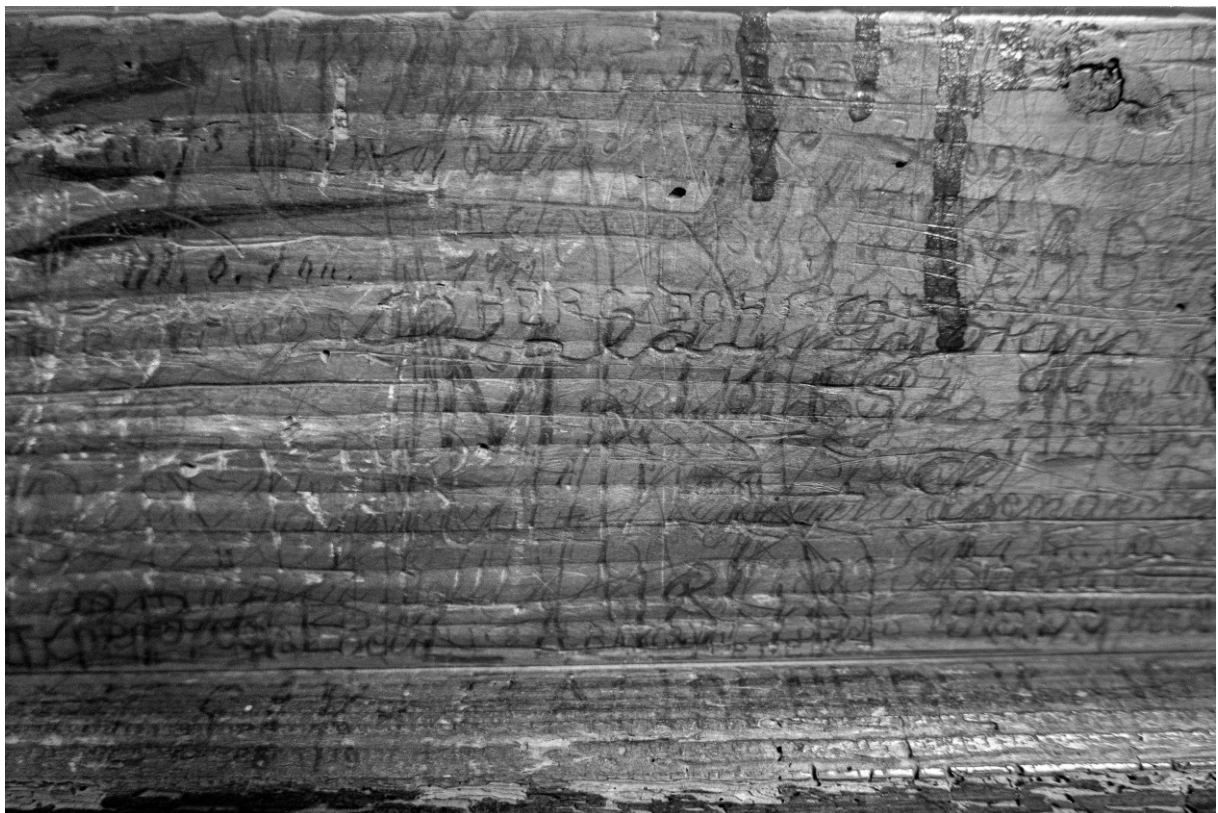
Egymásra rétegződő vésetek és firkák a sárospataki református templom padjain.