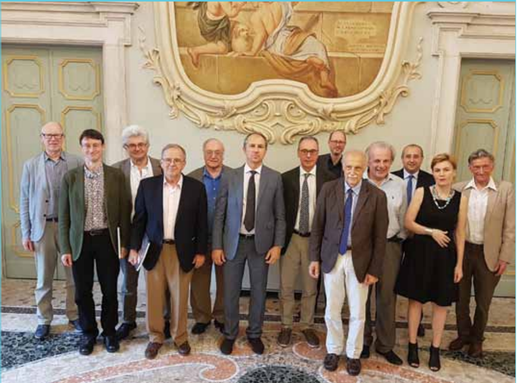
I. ábra: A konferencia tudományos bizottsága. Középen Maurizio Tira professor, mellette balra szerzőnk

Az első nap délutánján a Védtelességi közlekedők szekció elnöke voltam. A vitavezető szerepét Rob Eenink (Hollandia) vállalta. A szekcióban öt előadás hangzott el. A két izraeli előadás közül az egyik a vegyes használatú városi utak biztonságát elemezte, különös tekintettel a tervezés korai szakaszára, míg a másik az idős gyalogosok közlekedésbiztonsági nehézségeire koncentrált. Egy előadás az autizmussal élők közlekedési problémáira keresett és javasolt megoldást, egy további pedig Strasbourg példáján szemléltette a fenntartható mobilitás lehetséges kockázatait. A szekció utolsó előadása a lakott területek nyilvános tereinek biztonsága és az átmenő forgalom mérteke közötti optimális egyensúly megtalálására törekedett.