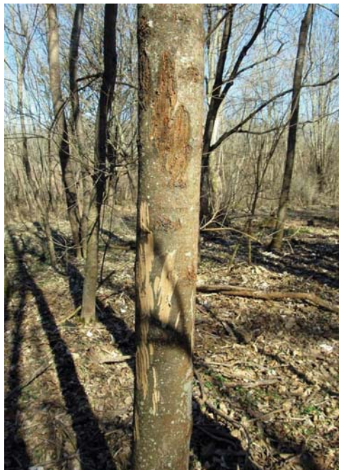
2. ábra Régebbi és friss hántásnyomok magas kőris ( Fraxinus excelsior ) törzsének felső, illetve alsóbb szakaszán

Budakeszi közelében, a város alsó végétől nyugatra eső térségben, öt kéreghántással sújtott mintaterületet választottunk ki, amelyekben egy-egy 10 m × 10 m-es kvadrátban, minden 2,5 cm-nél nagyobb mellmagassági átmérővel rendelkező, élő fa egyedet megvizsgáltunk. Az egyes példányok faji azonosítása után, ha nagyvadra utaló hántásnyomokat láttunk rajta, mérőszalaggal lemértük a meghántott rész alsó és felső magassági határát, valamint feljegyeztük, hogy a hántás ideje eredetű-e, vagy korábbi években keletkezett (2. ábra). A vizsgálat évében történt hántásnak tekintettük a világos színű, fehér vagy sárgásfehér sebeket, amelyek szélén a sebgyógyulás még nem indult meg. Ezeken gyakran nedvszivárgás is megfigyelhető volt, amin olykor rovarok (többnyire hangyák) is táplálkoztak. Régebbi hántásnak az olyan sebeket jegyeztük fel, ahol a hántott felszín be barnult, és a szélein kalluszosodást lehetett megfigyelni.