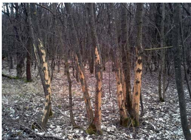
1. ábra Kiterjedt kéreghántás nyomai fiatal magas kőris ( Fraxinus excelsior ) példányokon Figure 1. Traces of extensive bark stripping on the trunks of young common ash ( Fraxinus excelsior ) trees

A Budakeszi környéki erdőkben 2016 tavaszán feltűnő, vélhetően kérődző vadtól származó kéreghántási sebeket figyeltünk meg a fákon (1. ábra). A kártétel mértéke (egyes helyszíneken több volt a meghántott, mint az ép kérgű fa) felkeltette érdeklődésünket, ám a hazai szakirodalomban csak néhány ide vonatkozó közleményt találtunk (Bence 1979, Walterné 1998, Nagy és Kámpel 2015, Fehér et al. 2016). Ezek alapján elsősorban a gímszarvasra ( Cervus elaphus ) és a dámvadra ( Dama dama ) gyanakodhattunk, de a muflon ( Ovis aries ) és az őz ( Capreolus capreolus ) lehetősége is felmerült. A kéreghántás okaként is több körülmény jöhet szóba, amelyek közül leggyakrabban a kéreg tápértékét és a bendőben zajló emésztési folyamatok segítségét emelik ki, de a vadállomány zavarása is lehet a kiváltó okok egyike (Walterné 1998, Rajský et al 2008, Fehér et al. 2016).