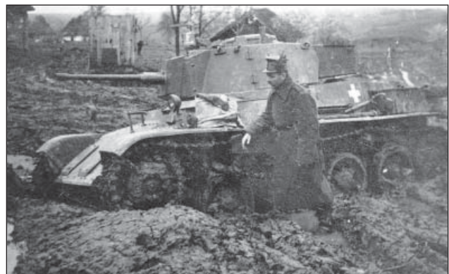
5. ábra. 38M Toldi harckocsi 40 mm-es löveggel, mellette egy csapatcsendőr gázol térdig sárban

Az Osztovcics Ferenc ezredes parancsnoksága alatt álló 2. páncélosadosztály 1944. április 5–11. között érte el a kirakodási, gyülekezési körleteket Stryj körzetében. Az innen 250–300 kilométerre lévő frontvonalig a sáros, havas, nehezen járható utakon a hadosztály lánctalpas és keres járművei már önerőből tették meg az utat minden pihenés nélkül.