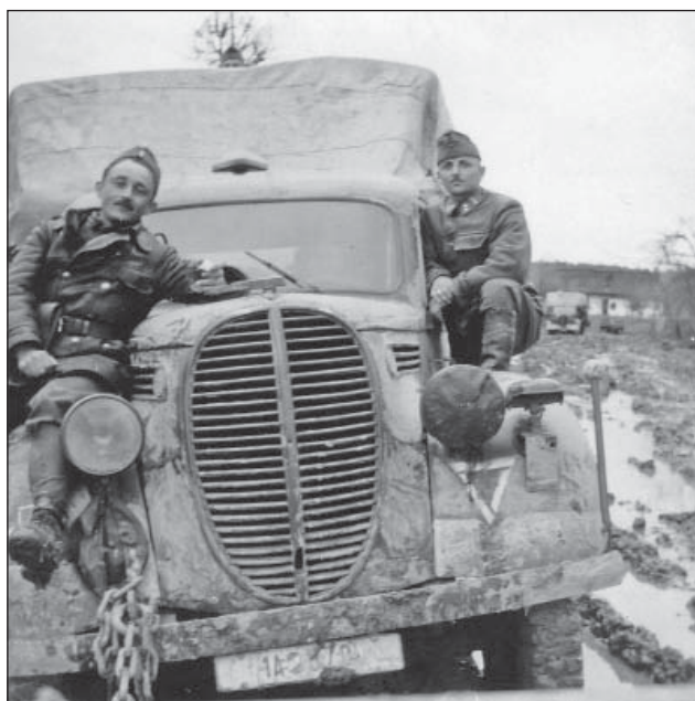
2. ábra. Ford tehergépkocsi a 2. páncéloshadosztály csúcsára állított fehér háromszög alakulatjelzésével

1944 tavaszán a szovjet csapatok gyors előretörésének ellensúlyozására elrendelték az 1. magyar hadsereg mozgósítását és kitelepülését a Kárpátokban kiépített védelmi vonalak megszállására.