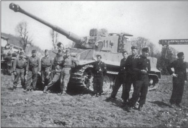
10. ábra. Pz.VI. E Tigris harckocsi magyar–német legénységgel, átképzésen

Az általános támadás végül 14.00 órakor indult meg, a páncélosok és a gyalogság támadását német Ju 87-es zuhanóbombázók támogatták.