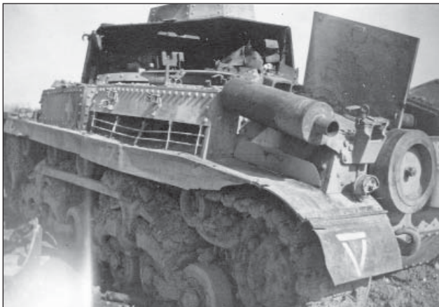
7. ábra. Mérey hadnagy kilőtt 40M Turán harckocsija

A felderítők már április 13-án harcérintkezésbe kerültek a szovjet erőkkel. Nadwornától nyugatra Lahowcznál a 2. fel-