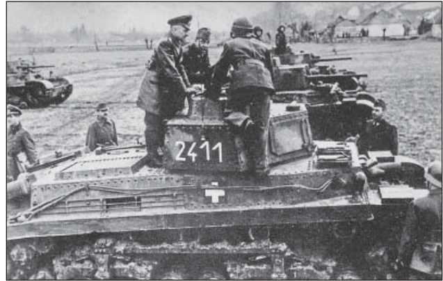
4. ábra. Walter Model tábornagy megszemléli a 3/II. harckocsi-zászlóalj egyik közepes 40M Turán harckocsiszázadát

A 2. páncélosadosztály hadrendjéből hiányzott 80 db motorkerékpár és 160 db gépjármű (35 db személygépkocsi, 106 tehérgépkocsi és 19 db egyéb jármű) is. A hadosztály lőszerlépcsőjéből 30 000 db 40 mm-es és 12 000 db