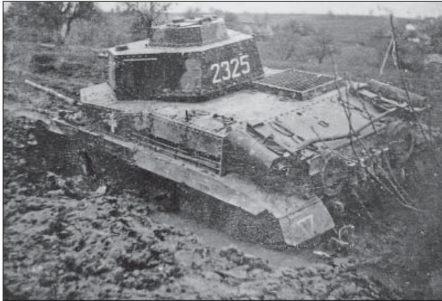
6. ábra. Sáros terepen nyomul előre a 3/II. harckocsizászlóalj 40M Turánja

Az alkalmazási területre beérkező alegységek pihenő nélkül azonnal bevetésre kerültek, a két német hadsereg-csoport közötti 60–70 km széles rés lezárása érdekében.