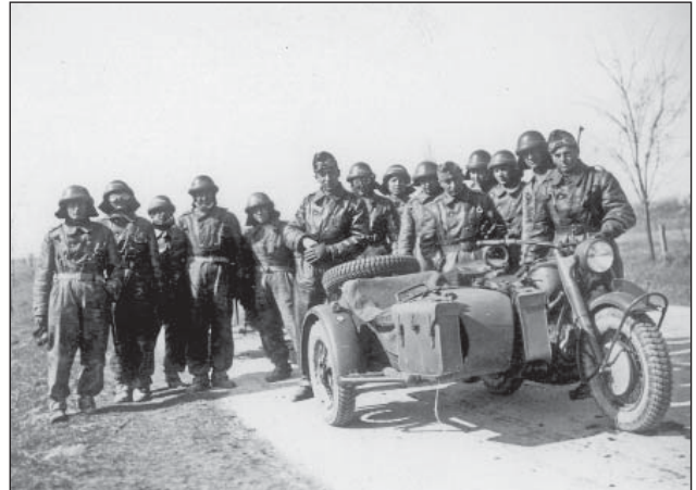
8. ábra. Motorkerékpáros felderítők BMW R-75-ös motorkerékpárral

derítő-zászlóalj egy hősi halottat és három sebesültet veszített. Két 39M Csaba páncélgépkocsit, egy személygépkocsit és egy Botond terepjáró gépkocsit is kilőttek vörös katonák.