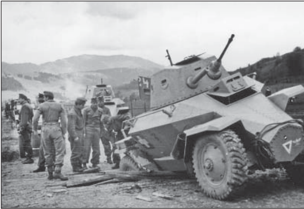
3. ábra. A 2. felderítő-zászlóalj került először harcba a szovjet erőkkel. A híres világos (sárga festésű) 39M Csaba páncélgépkocsik

akinek a rend és a fegyelem fenntartása volt a legfontosabb célja, emellett tipikus „írásztal-tábornok” volt, erős jobboldali kötődéssel.