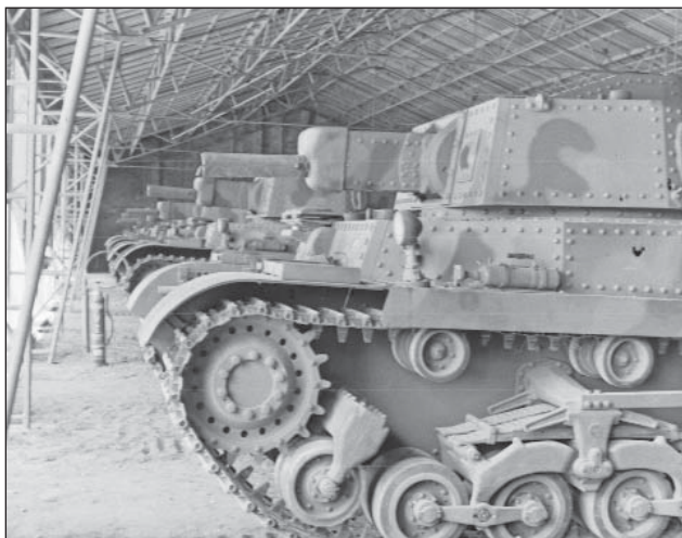
1. ábra. 41M Turán nehéz harckocsi a magyar páncélos fegyvernem büszkesége 1943-ban, a Gépkocsi szertárban

A magyar vezérkar a Kárpátok hegyvonulataival, mint természetes védelmi vonallal már 1940 ősztől számolt, akkortól megkezdtek egy a terület földrajzi adottságait kihasználó védelmi vonal tervezését. A háború későbbi részében a magyar hadvezetés abban reménykedett, hogy a jól védhető erődvonal áttörése helyett a Vörös Hadsereg a lengyel síkságon fog előretörni és megkíméli az országot a hadszíntérré válástól.