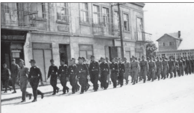
11. ábra. A nadwornai páncélos átképző tanfolyam állománya kivonul a kiképzésre