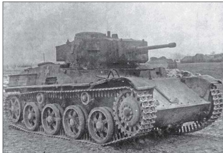
9. ábra. A szovjetek által zsákmányolt 40 mm-es ágyúval szerelt Toldi II. harckocsi

Április 17-én 12.00 óra körül a Bercsényi-csoport erői a megindulási körletbe való előrevonás közben Starunia körzetében már harcérintkezésbe kerültek szovjet T-34-es harckocsikkal. A magaslatra felkapaszkodó magyar harckocsiszázad támadását két órán keresztül tartóztatta fel egyetlen T-34-es, a 3/I. harckocsizászlóalj több 40M közepes Turán harckocsiját kilőtte a szovjet harckocsi, mire sikerült kilőni. Az elhúzó tűzharcba további két T-34-es kapcsolódott be, ezek közül az egyiket kilőtték a magyar Turánok.