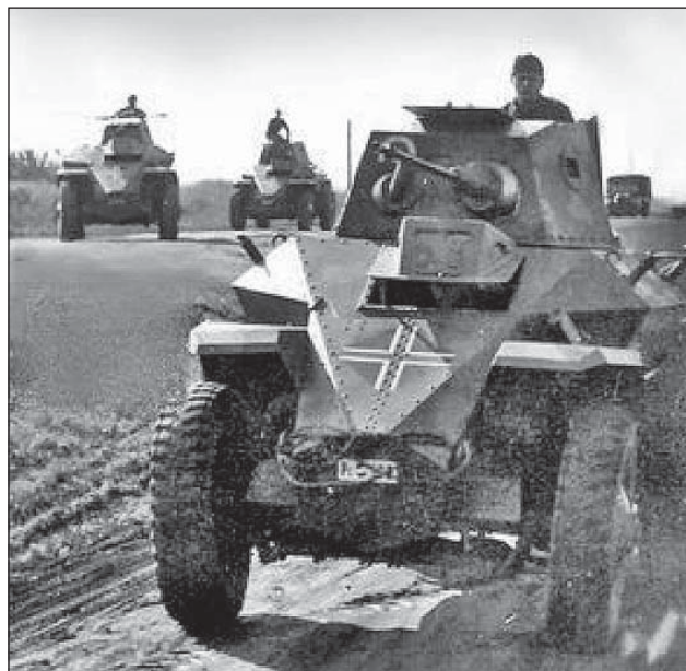
111. ábra. Csaba felderítő páncélgépkocsik oszlopban

A gyorshadtest 1. gépkocsizó dandárának felderítő rendszere előremutató volt szervezettsége és átgondoltsága