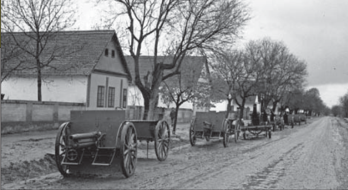
110. ábra. Hátrahagyott jugoszláv tűzérési eszközök

őre haladt, majd a páncélgépkocsi-század következett (innen küldték ki a felderítő járőrt), amit a zászlóalj zöme (tűzérési, harcokocsiszázadok), majd a gépkocsizó század követett, és a zászlóalj vonata zárta a menetoszlopot.