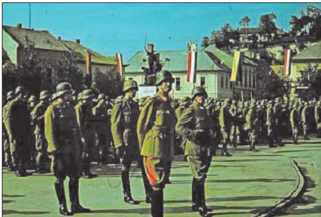
108. ábra. Délvidék – a beérkezett csapatok megszemlélése

aknazáron keresztül. Az átkelést csak másnapra sikerült befejezni, és 17-én estére a csoport elfoglalta Sid és Újjak területét.