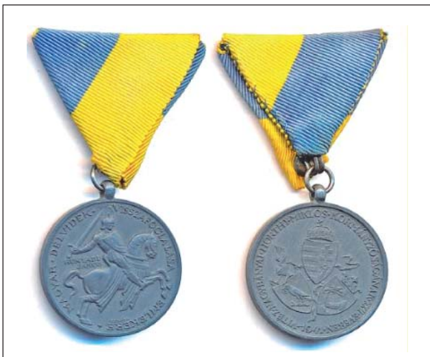
109. ábra. Délvidék emlékérem 1941-ből

noksága leállította a hadtest előrevonását. Utasította a parancsnokságot, hogy a csapataival maradjon Vinkovci térségében, míg a 2. gépkocsizó dandár Szarajevóba való menetre kapott parancsot. Ott kellett felváltania a 8. német páncélosadosztályt. A parancs kiadásának ideje alatt már megkezdődtek a fegyverszüneti tárgyalások a volt jugoszláv kormány képviselőivel. A megállító parancs miatt 18-án este a hadtest mintegy 200 km mélységben tagozva állt, élével – a 2. gépkocsizó dandár elővédje – Valjevóban, míg a zöm vége még alig hagyta el a magyar–horvát határt.