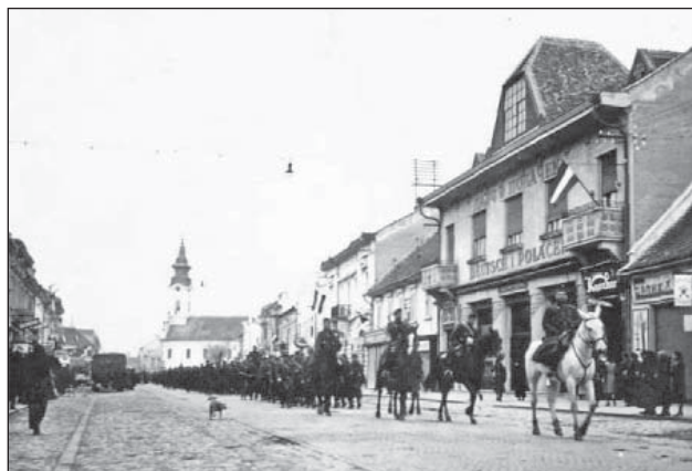
107. ábra. Délvidéki bevonulás Zombor városába

A gyorseregtestek támogatására a szombathelyi III. közfelderingő századot osztották be, amely a csapatok partváltásával egy időben megkezdte a légifelderítési feladatai végrehajtását.