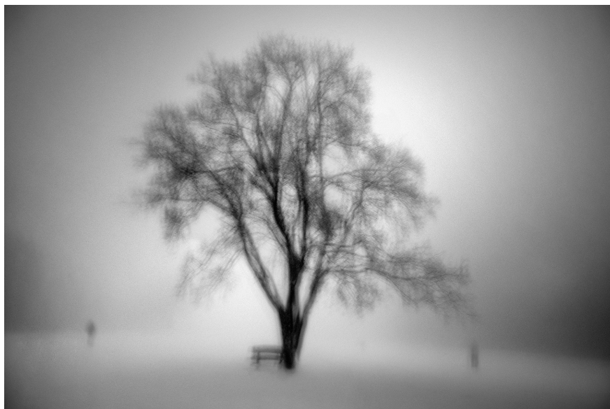
5. Vancsó Zoltán: Budapest, Hungary, 2010 | from the series Landslides – Exploring the Void | Az Álomvölgy – Az üresség felfedezése című sorozatból. © Vancsó Zoltán © HUNGART, 2016

fedezek fel valamit a világból. Arra is törekszem, hogy ez a kép-szöveg párosítás hasonlóan nagy szellemi kaland legyen a befogadó számára, mint amilyen nekem volt. Kép és szöveg passzoljon is – de ne egyértelműen. Legyen egy kis rés a kettő között.” 6 Vancsó honlapján, a Facebook-oldalán, és az albumaiban mind megtalálhatók a képek mellett ezek a kis idézetek, azonban ki is kapcsolhatók és a fotográfiaik önállóan is működnek: az idézet nem hozzájuk tartozik, hanem, ha a befogadó akarja, hozzájuk tesz. Vancsó a Facebookot olyan üzenőfalaként fedezte fel, ahova néhány naponta feltűzhet egy képet és egy szöveget, aznapi elmélkednivalóként, követői pedig lelkesen kommentálják is ezeket a képes feljegyzéseket, interaktívva téve a befogadás élményét. Új albumában az Enigmában közölt képekhez posztolt idézeteket is megtalálhatjuk, a könyv a Facebook-posztok kronológiáját követi, így az alkotó minden korszakából, nagyobb sorozatából találkozhatunk fotográfiaikkal, ahogy sok képnél a közösségi háló volt az első megjelenési helye is.