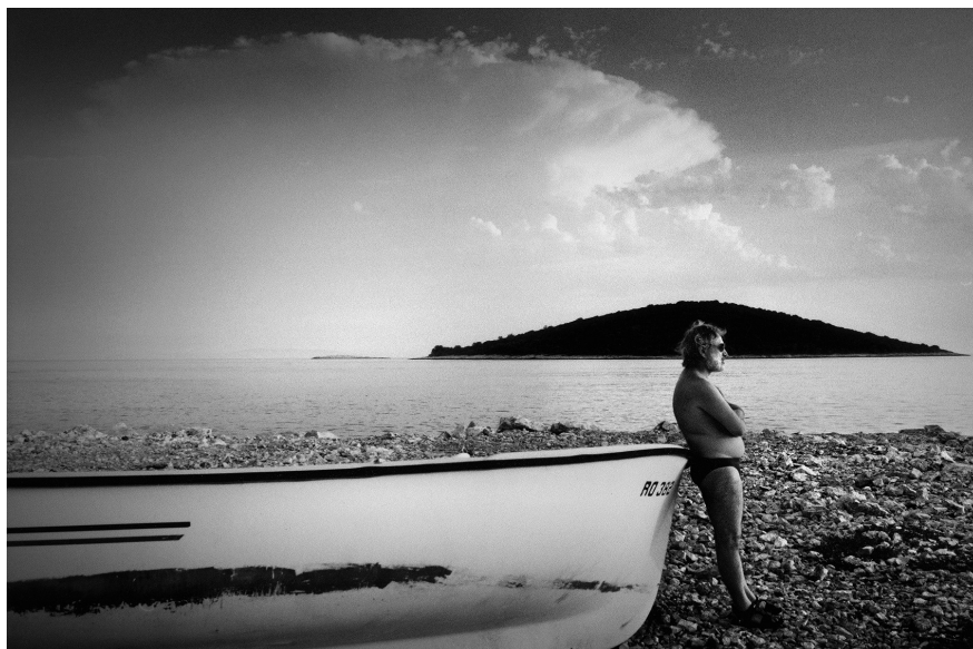
4. Vancsó Zoltán: Adria, Croatia, 2003 | from the series Still Movies – Mediterraneans | Az Állófilmek – Mediterráneum sorozatból.