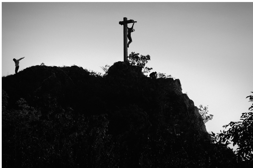
1. Vancsó Zoltán: Pécs, Hungary, 2015 | from the upcoming series Haikus | A Haikus című készülő sorozatból.