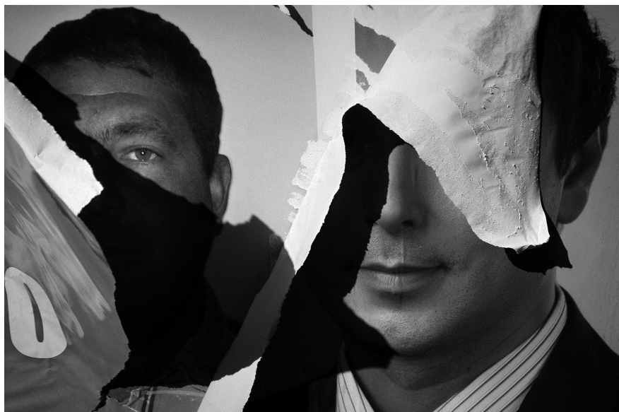
6. Vancsó Zoltán: Unknown Place, Bulgaria, 2011 | from the upcoming series Haikus | A Haikus című készülő sorozatból.