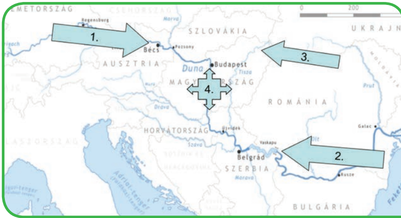
4.20. ábra. Magyarország természetes vizeiben kimutatott idegenhonos halfajok megjelenésének legfőbb irányai 1: Felső-dunai vízgyűjtő, 2: Al-Duna, 3: Tisza-vízgyűjtő, 4: halas-, kerti és termáltavak