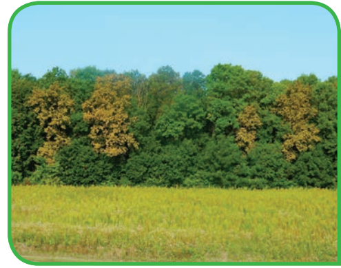
4.26. kép. Kocsányos tölgyek erős elszíneződése elegyes erdőszegélyen (a zöld lombzatú fák egyike sem tölgy)

poloska populációit szabályozza. Ez azt vetíti előre, hogy közeli rokonához, a platán csipkésposloskához ( Corythucha ciliata ) hasonlóan hosszabb időn keresztül, „krónikus” formában kell számítanunk tömeges fellépéseire.