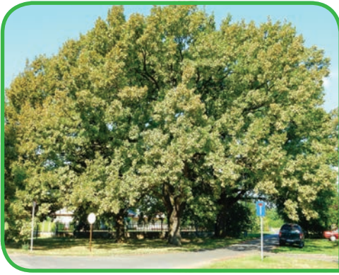
4.25. kép. Nyár közepi elszíneződés idős, városi kocsányos tölgyön