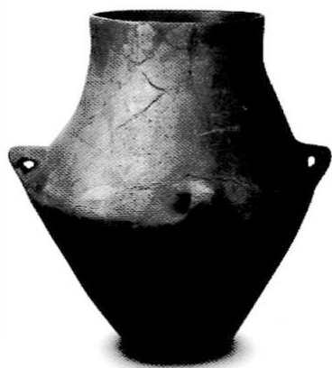
7. kép Középső rézkori tárolóedény Balatonszemes-Bagódombról