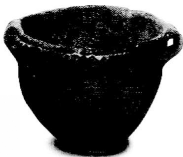
11. kép A bolerázi csoport edénye Zamárdi-Kútvölgyi-dűlőből

A későbbiekben az edények jellemzője a különböző pontbenyomkodással, bekarcolással kialakított gazdag díszítés. Az edénykészletben megtalálhatók a nagyméretű tárolóedények, a bordadíszes fazekak, kisebb-nagyobb tálak, a nagyméretű, szépen kidolgozott kancsók, a kultúrára jellemző magas fülű merítőedények, szószos edények (12. kép). A badeni kultúra jellegzetes tárgyai még a díszes, gyakran vörösre festett talpas serlegek és a belül egyharmad-kétharmad arányban kettéosztott, ún. kétosztású tálak (12. kép; ld. még 140. kép). Az M7-es autópálya-ásatásokon több, a kultúra későbbi időszakába sorolható település is előkerült (Balatonőszöd-Temetői-dűlő, Balatonlelle-Országúti-dűlő, Balatonboglár-Berekre-dűlő, Balatonszemes-Szemesi-berek, Ordacsehi-Bugaszeg, Ordacsehi-Major). A kultúra népének életében a föld-