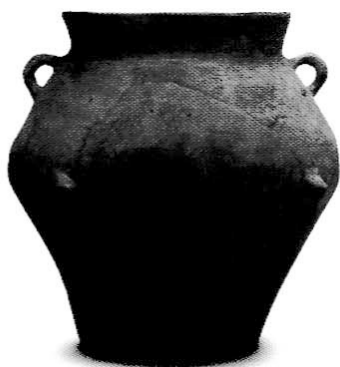
8. kép Középső rézkori edény Balatonboglár-Borkombinát lelőhelyről

szerint bal, illetve jobb oldalra fektetve tették a sírba. A temetkezés során edényekben ételt-italt helyeztek az elhunytak mellé. Területünkön a rézkorba keltezhető lengyeli kultúrák temetkezését nem ismerünk.