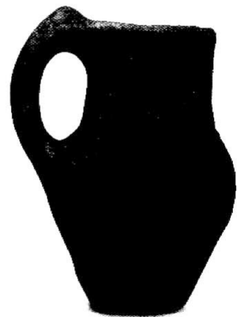
10. kép Tűzdelt barázdadíszes korsó Balatonboglár-Berekre- dűlőből