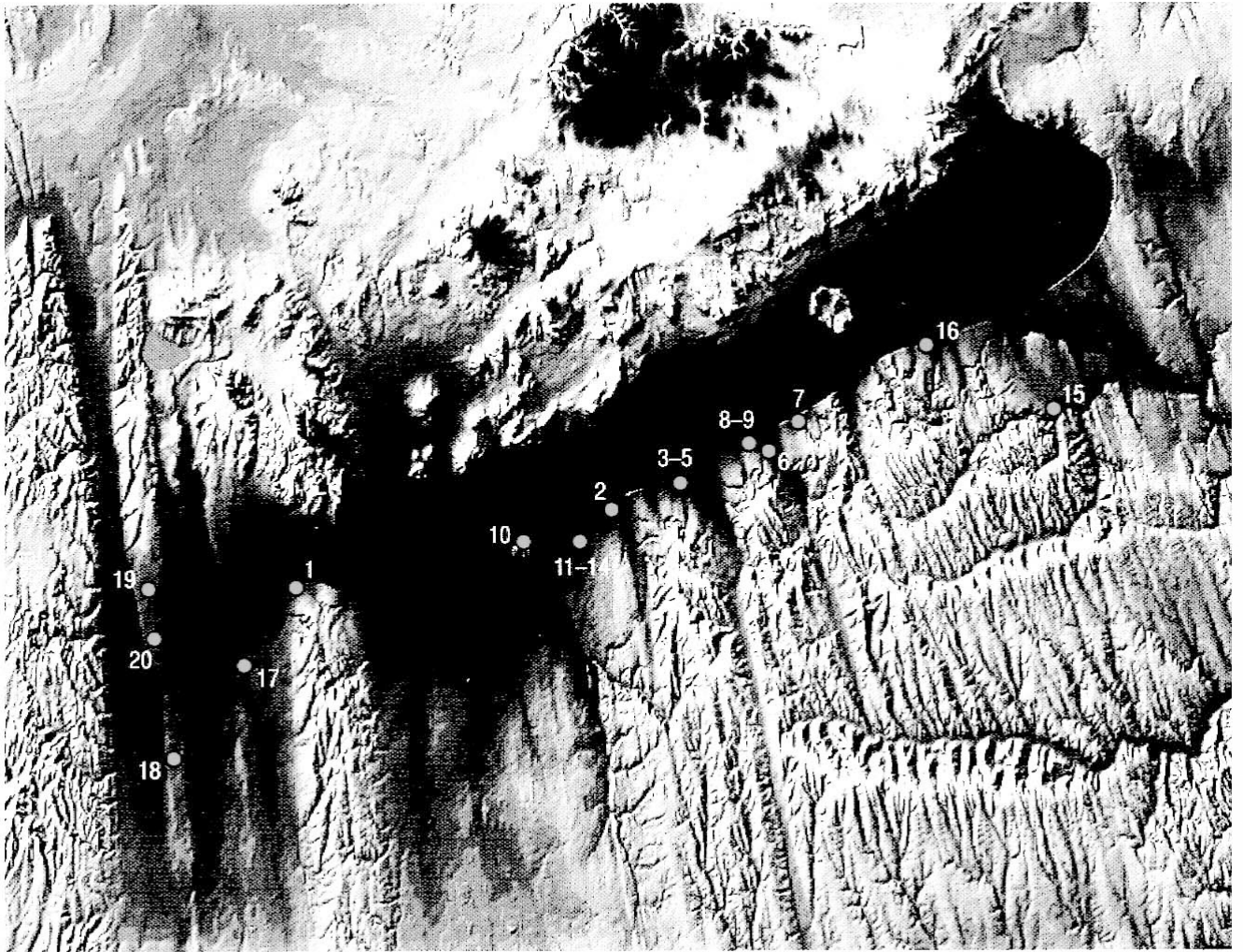
15. kép A tanulmány szövegében említett dél-balatoni rézkori lelőhelyek