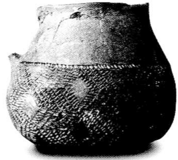
9. kép Tűzdelt barázdadíszes bögre Ordacsehi-Bugaszegről

A szlovákiai névadó lelőhelyről elnevezett bolerázi csoport már a badeni kultúra korai időszaka. A badeni kultúra hosszú, békés fejlődése során létrejön az őskor egyik legizgalmasabb kultúrkomplexuma. Nagy területen, Európa déli és középső régiójában (Bulgária, Románia és az egykori Jugoszlávia, valamint a mai Magyarország, Ausztria, Svájc, Csehország, Szlovákia, Kis-Lengyelország és Németország déli területein) található meg lelőhelyei. A törté-