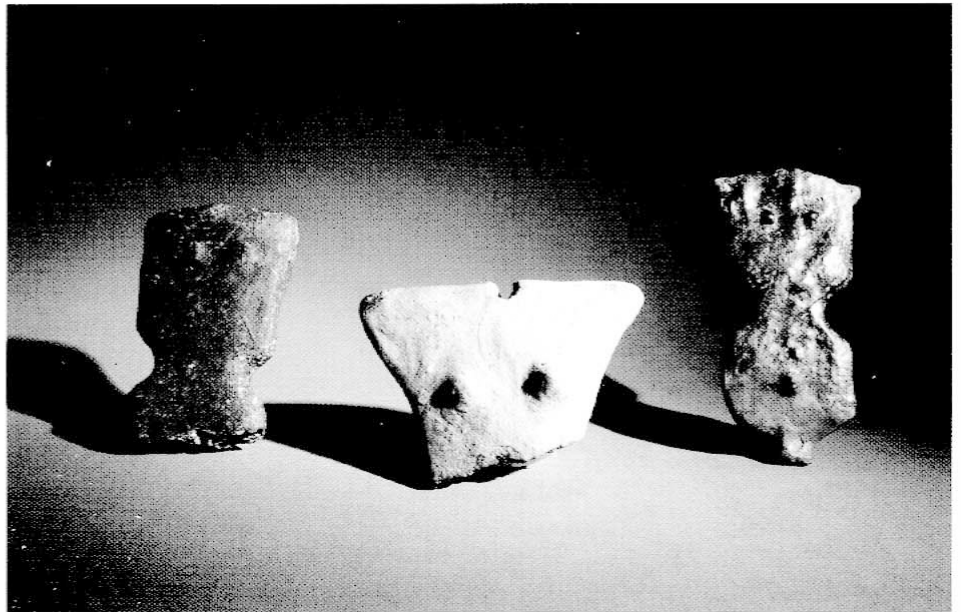
14. kép A badeni kultúra embert ábrázoló szobrocskái Balatonszemes-Szemesi- berekből

sem, ezek egyike Balatonboglárról ismert, ahol 12 embert temettek el egyszerre. A sírokat gyakran jelölték meg sírkövel. A temetőben gyakoriak a jelképes sírok is, ahol csak tárgyakat (pl. edényeket) temettek el. Egy ilyen szimbolikus sírban találták meg a közismert négykerekű, vörös festéknyomokat is megőrző budakalászi kocsimodellt.