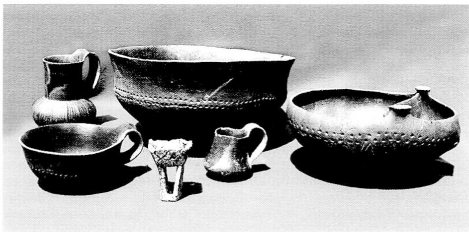
12. kép Késő rézkori sír mellékletei Balatonlelle-Felső- Gamászról (291. sír)