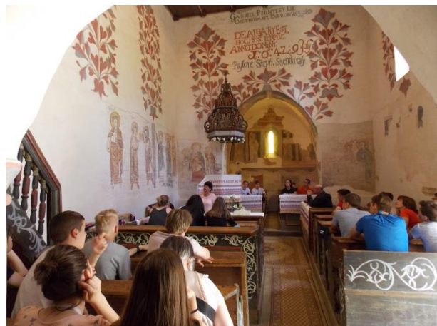
Látogatók a nyírbátori és a csarodai református templomban. 2017. május 12-13. 3

Az említett változások mentén átalakuló társadalmi elvárásokhoz a református egyházak is igyekeznek alkalmazkodni, s a helyi turizmusba való integrálódás, vagy a lehetőségekhez mérten önálló turisztikai fejlesztések és attrakciók révén elégítik ki az új igényeket. A vallási objektumokat már évszázadok óta használják a vallásgyakorlás mellett különböző kulturális célokra is, így mint műemlékek, idegenforgalmi látványosságok,