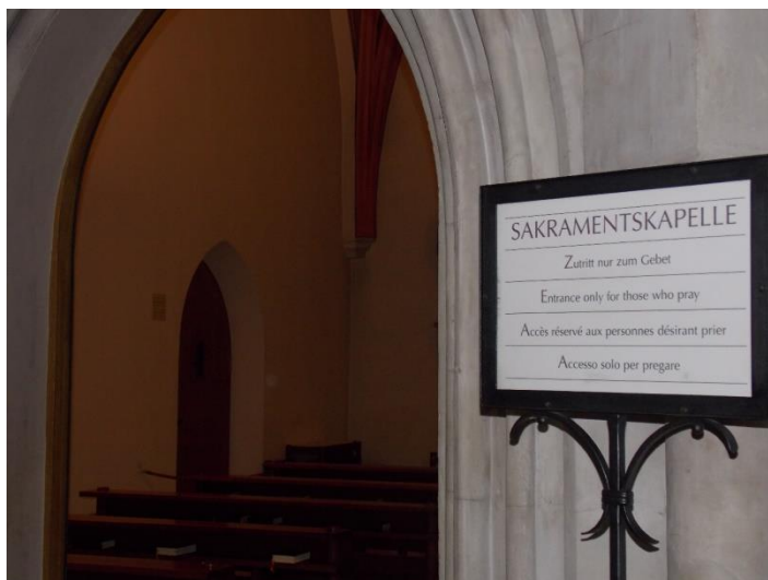
Az imádkozás miatt elhelyezett figyelmeztető-tábla. München, Frauenkirche. 2013. július. 53

Ezeket a „spirituális szolgáltatásokat” a turisták egyre inkább igénylik, így ezek nemcsak a spontán, de szervezett templomlátogatások során is kialakításra kerülnek. Így például a Nyitott Templomok Éjszakája programsorozat keretében 2014-ben több templomban is a turisztikai információk elhangzása előtt vagy után a programot színesítendő orgonajátékkal és a gyülekezeti kórus énekével kedveskedtek a látogatóknak. Ezáltal a turisták kikapcsolódás, spirituális feltöltődés iránti szükségletének kielégítését is megcélozták az egyházközségek.