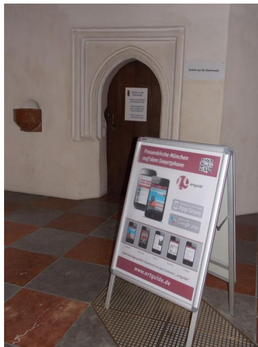
QR-kód használata a templomokban. München, Frauenkirche. 2013. július 63

élménye, az adott vallási helyszínt kizárólag művészeti, művelődési értékei miatt keresik fel a turisták. 62 Az egyházi helyszínekhez kötődő tudás közvetítése, vagyis az interpretáció igen sokféleképpen történhet, a spontán vagy állandó megbízású idegenvezető tárlatvezetésétől az egyszerűbb tablókön, molinókon át egészen az ikonok, úrasztalák mellé helyezett QR-kódhoz rendelt információhalmazig.