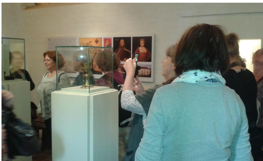
A felújított vajai református templom és egykori sekrestyéjében kialakított kiállítás megtekintése a Magyar Múzeumi Történész Társulat éves konferenciájának részeként.