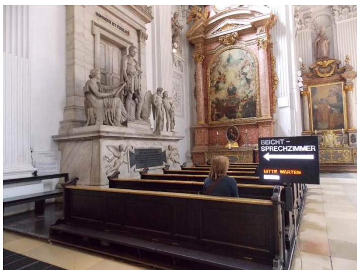
A gyóntatószékhez használt jelzőberendezés. München, St. Michael Kirche. 2013. július. 50

A spiritualitás iránti fokozódó igények mentén az egyházközségek törekednek a megfelelő környezet kialakítására, ami adott desztináció helyzetétől, térszerkezetétől függően többféleképpen is történhet. Ha a kiemelkedő látogatóforgalmat bonyolító szakrális objektum közvetlen szomszédságában, vagyis települési szinten még a potenciális turisztikai térben 51 külön kápolna vagy gyülekezeti ház áll, akkor ebben az „alternatív szakrális objektumban” teremtik meg az elcsendesülés milióját. Ha pedig az elsődlegesen turisztikai attrakcióként funkcionáló templom térbeli adottságai ezt lehetővé teszik, felekezettől függően sekrestye vagy a templomban kialakított gyülekezeti terem rendelkezésre áll, akkor természetesen még az épületen belül alakítják ki az imádkozásra szánt teret.