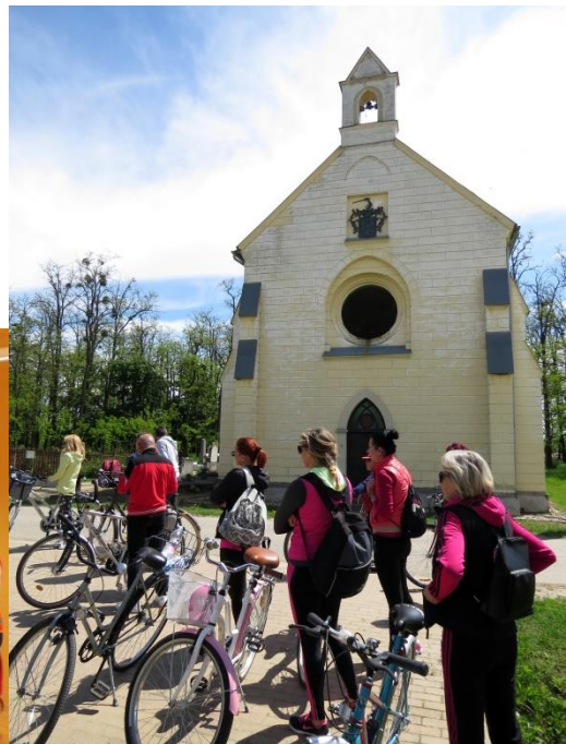
A Beregi bringások „Test és lélek” elnevezésű kerékpártúrán 34

A vallási és az aktív turizmus összekapcsolódása figyelhető meg az egyre népszerűbb kerékpárturizmus területén is. A szatmári és beregi református templomokat igen nagy számban keresik fel azok a biciklisták, akik a környéket kerékpárral járják be, nem céltalanul, hanem tudatosan alakítva útjukat: a térség műemléktemplomait is felkeresik. 35 Esetükben a túrakerékpározás (nyaralás közbeni kerékpározás és hosszú távú kerékpáros utak) tekinthető természetesen elsődlegesnek, amelynek útvonalát a térség vallásturisztikai desztinációi is