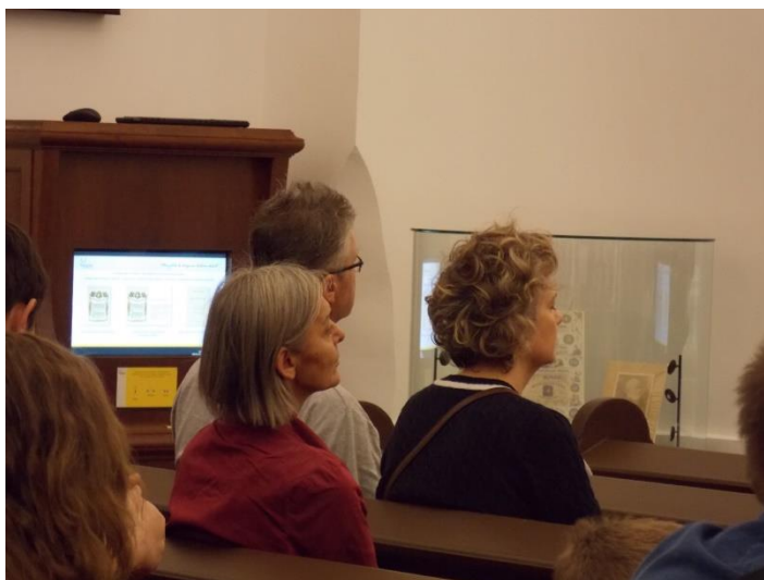
„Elcsendesülés” az orgonajáték alatt. Nyitott Templomok Éjszakája. Debrecen, Nagytemplom. 2014. szeptember. 54

jellemzően az esti órákra halasztott istentisztelet során ölt csak testet a lelki/spirituális feltöltődés. A vallási fesztivál esetében pedig – elsősorban a különböző profán, félprofán programok révén – a valahova való tartozás, a kognitív szükséglet és az önmegvalósítás igénye válik inkább elsődlegessé.