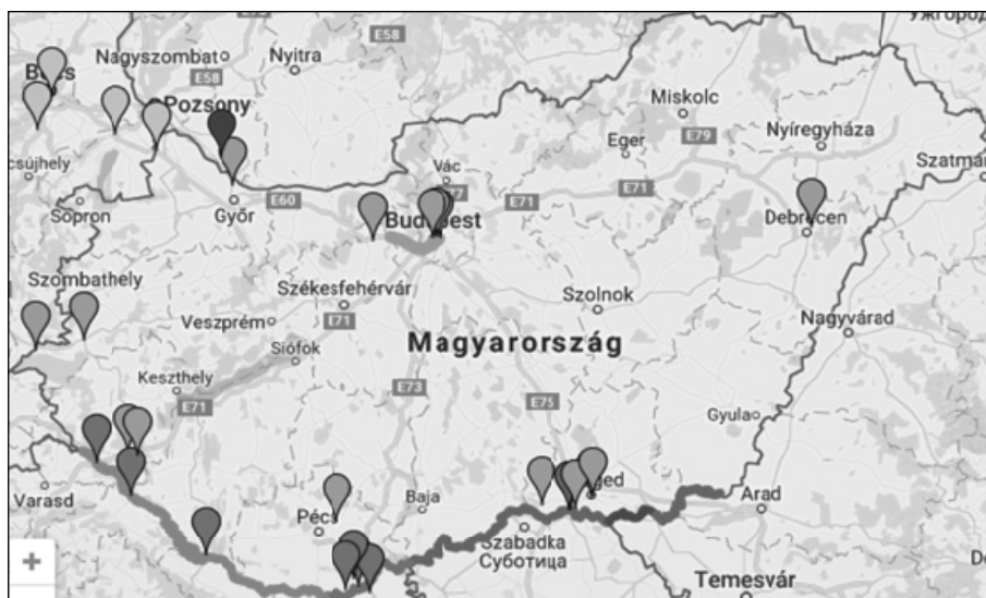
1. ábra. A menekültválság által érintett települések és régiók