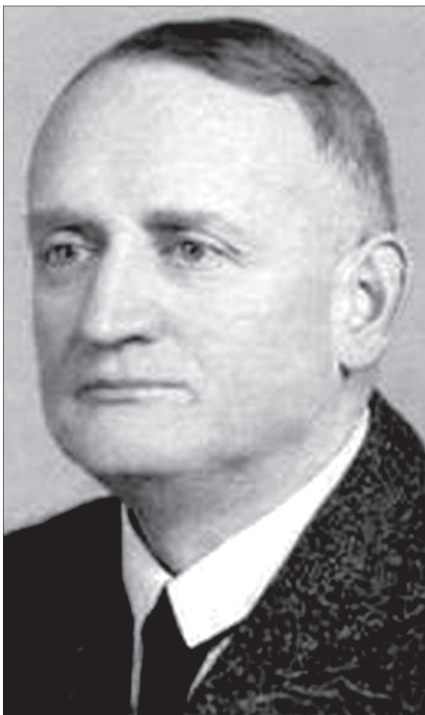
Eckhart Ferenc (1885. november 18. – 1957. július 28.)

felkészültség nélkül, szakmai szempontoktól függetlenül – Pótó János kifejezésével – a „minden narratíva egyenlő” elv jegyében. A hazai jogtörténészek számára ezért is megszívlelendő Ernest Labrousse (Incze Miklós által idézett) véleménye arról, hogy megírhatja-e a történész saját kora történetét. Eszerint „nincs választásunk, ez a történet mindképpen megíródik, és leggyakrabban a történelem ellen íródik meg. Annál inkább a történelem ellen íródik majd, minél jobban tartózkodnak a történészek az ebben való részvételtől.”