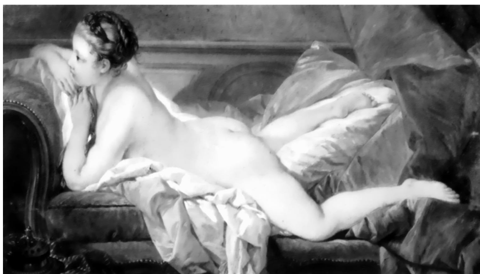
5. ábra. Példa a narratívum szempontjából alacsony és magas értéket képviselő ábrázolásokra

telensége ellenére nem vált ki a megfigyelőből narratívumokat. A nyugalmat sugárzó kép kapcsán legfeljebb az átlós kompozíció, a levegőperspektíva és a reneszánsz művészet jut eszünkbe. Az alsó Boucher kép viszont szinte provokálja, hogy