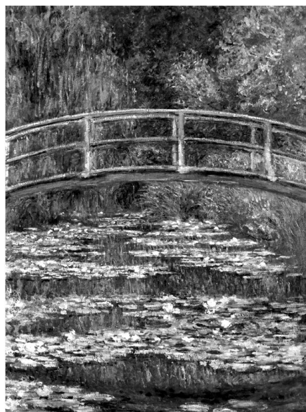
1. ábra. A komplexitás három fokozata Monet tavirózsáin

Az 1. ábrán a komplexitás három fokozatát láthatjuk az egyszerűtől a bonyolultig haladva. A képek Monet-tól származnak és vízililiomokat ábrázolnak. A tematikus hasonlósághoz nem férhet kétség. A komplexitás a festményeken található vizuális egységek számával és a közöttük levő viszonyok gazdagságával függ össze, azzal egyenesen arányos. A 2. ábra felső részén az inger ismertségét és újdonságát illusztráljuk: a magyar átlagnéző számára közismert a Szinyei-kép, a Lila ruhás nő , kevésbé ismert hasonló tematikájú kép Goya alkotása, Donna Izabella portréja . Alul egy kongruens elemeket tartalmazó kép (van Eyck Az Arnolfini házaspár c. festménye) szerepel együtt egy hasonló kompozíciójú, de inkongruens elemeket magába