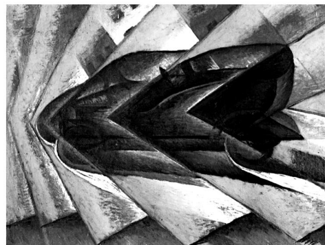
4. ábra. Felül példák a pozitív és negatív jelentésirányra, alul a statikus és a dinamikus ábrázolásra

triptichonjának bal és jobb oldalát mutatják, és amelyek a mennyországot és a poklot ábrázolják. Az alsó képpár Morandi Nagy metafizikus csendélete , amely a statikus ábrázolás kiváló példája, a jobb oldali futurista Russolo-kép lényege pedig a dinamizmus, címe Egy gépkocsi dinamizmusa . Végül az 5. ábrán a narratívum iránti érzékenység két példáját mutatjuk be. A felső, Giorgione Szunnyadó Vénusza , mezí-