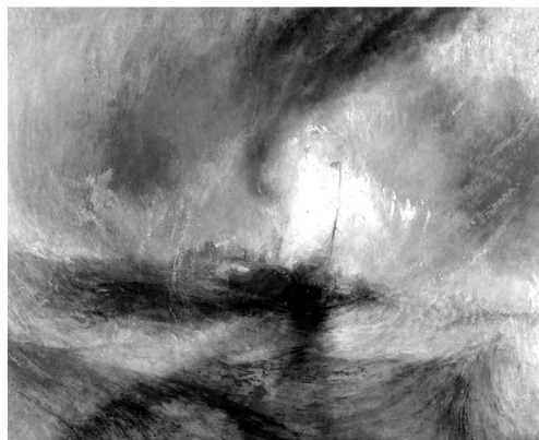
3. ábra. Az ábrázolóság három fokozata Turner-festményeken

foglaló képpel (Max Ernst Napoleon a sivatagban című festménye). Mindkét képen bal oldalt egy férfialak helyezkedik el, középen egy kompozíciós szempontból fontos tárgy (egy tükör, illetve egy oszlop, utóbbi feltehetőleg fallikus szimbólum), jobb oldalt egy nőalak, akinek kidudorodik a hasa (az egyik nő terhes, a másikonál a mezítelenség a fontos). Inkongruens elemek például a férfi feje helyett található állatfej (feltehetőleg bikafej), a nő előtt lebegő szaxofonszerű hangszer stb. A 3. ábrán az ábrázolóság három fokozatát képviselő egy-egy Turner-festmény található. A felső kép viszonylag természethű, részletező (címe Pilgrimage ), az alsó bal oldali kép realizmusát megtörik a sajátos fényhatások (címe Béke – Temetés a tengeren ), a jobb oldali kép kifejezetten nonfiguratív (címe Hóvihar ). Az ingerkészlet összeválogatásánál azért alkalmaztunk csak Turner-képeket, mert Turner alkotói korszakai jól követik az ábrázolóság három fokozatát. A pozitív és a negatív jelentésirány hatásának vizsgálatánál a festői stílus szimmetriájára jobb példát nem is találhatunk volna, mint a 4. ábra tetején látható képeket, amelyek Bosch Gyönyörök kertje c.