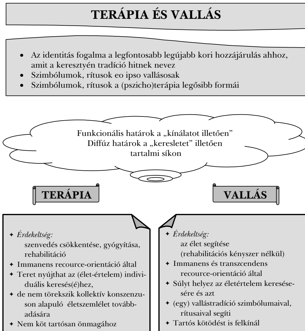
1. ábra. A terápia és a vallás eszközei

A kapcsolatra vonatkozó gondolatainkat a következő ábrában foglalják össze: