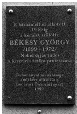
4. ábra | Békésy György emléktáblája Budapesten, az I. kerület, Fő utca 19. számú ház falán

Figyelembe véve, hogy a „Békésy-fészek” Kolozsvárott található, a családfa kutatását itt kezdtük. Felkerestük a Kolozsvári Református Egyházközséget, ahol megtudtuk, hogy a román kormány 1948-ban államosította az összes 1900 előtti egyházi dokumentumot, és azok a Kolozs Megyei Levéltárban találhatók. Budapestről kérvényeztük a XIX. századi egyházi dokumentumok megtekintését és erre megkaptuk az engedélyt. Kolozsvárott több napon keresztül kutattuk a református egyházi feljegyzéseket: a születésekről, a házasságkötésekről, a halálozásokról. E dokumentumok fényképezését is engedélyezte a levéltár (egy bizonyos pénzösszeg lefizetése ellenében), majd a Debreceni Egyházi Levéltárban folytattuk a kutatásainkat.