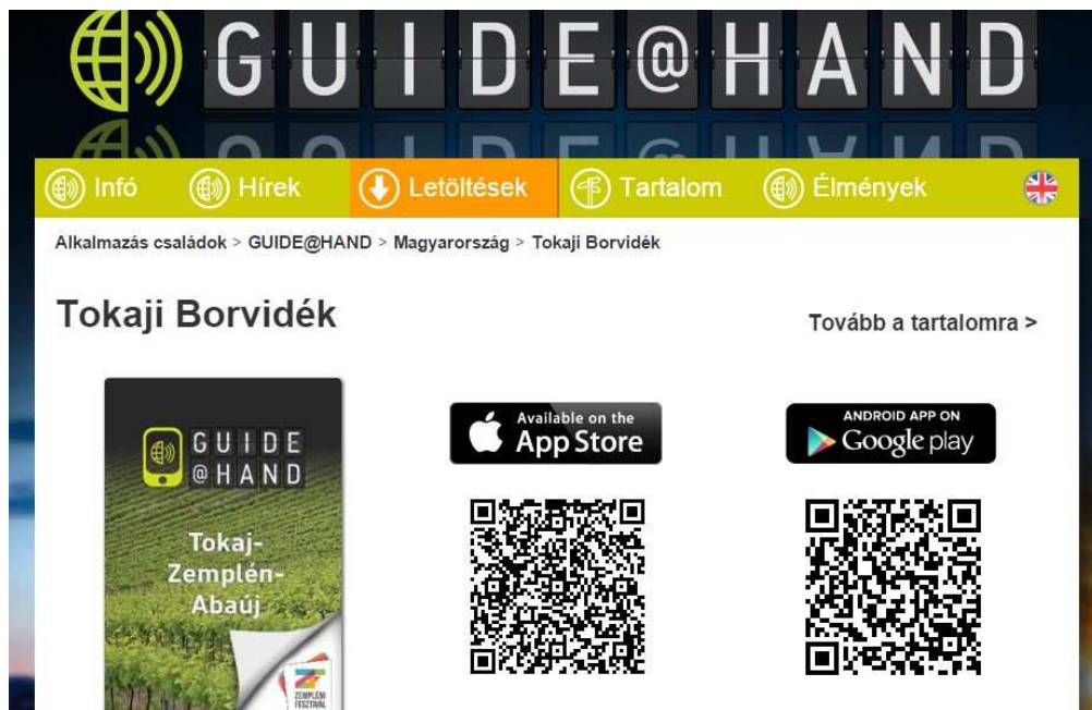
4. ábra: A Guide@Hand nyitóképernyője