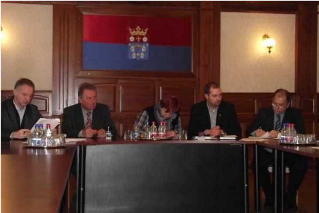
2. ábra: Tokaj-hegyalja-Zemplén-Abaúj Térségi TDM Nonprofit Kft megalapítása (Sárospatak, 2011).

A térségi TDM megalakítására 2011 decemberében az 5 helyi TDM egyesület azonos mértékű törzsbetét hozzájárulásával nonprofit kft formájában került sor, sárospataki székhellyel.