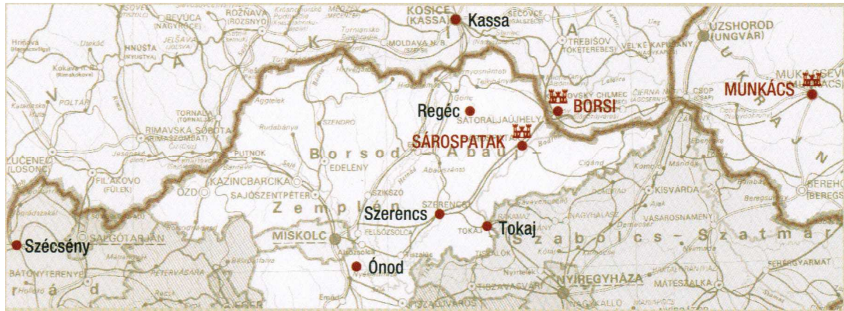
5. ábra: Rákóczi örökségút főbb állomásai

A Rákóczi család multikulturális kapcsolatrendszerére épülve lengyel kezdeményezésre és a helyi TDM egyesületi tag Sárospatak Város Önkormányzatának NKA pályázati forrásával kezdődött meg az örökségút projekt továbbgondolása. s egy európai kulturális útvonal kialakításának előkészítése.