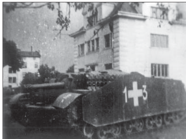
16. ábra. 40/43M Zrínyi rohamtarack. A köténylemezzel páncélzatot lánctagokkal is megerősítették

Walter Model tábornagy, a német Észak-Ukrajna Hadse-regcsoport parancsnoka elégedett volt a magyar páncélosok teljesítményével és hozzájárult ahhoz, hogy a magyar páncélosok harcjármű-vesztéseit német anyag átadásával pótolják.