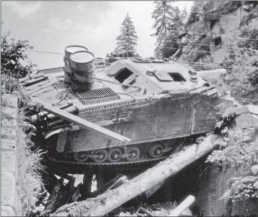
20. ábra. A visszavonulás során az egyik Zrínyi II. rohamtarack alatt beszakadt híd a Kárpátokban