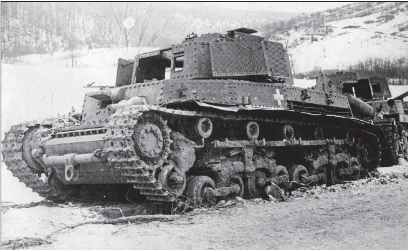
21. ábra. Elhagyott 40M Turán közepes harckocsik a Kárpátokban 1944-45 telén. A lövegeket a visszavonulás során kiszereelték

A 2. páncélosadosztály mellett, az 1. magyar hadsereg állományába került a magyar honvédség legfiatalabb alakulata, az 1. rohamtüzérosztály.