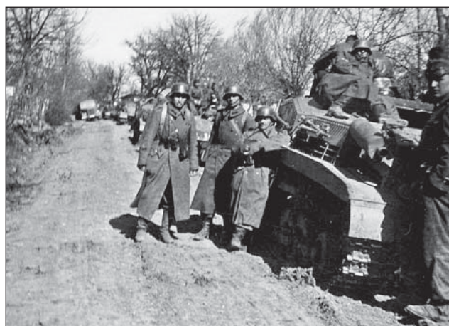
14. ábra. Az I. rohamtüzérszázad támadásra készülő Zrínyi II. rohamtarackjai és a támogatásukra kirendelt gyalogság