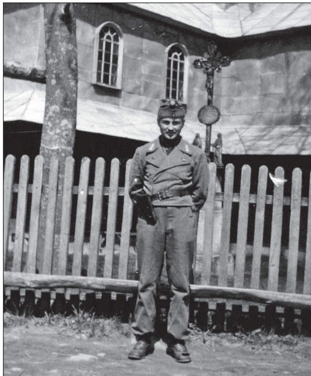
13. ábra. Magyar páncélos katona 43M füstszürke kétrészes páncélos egyenruhában