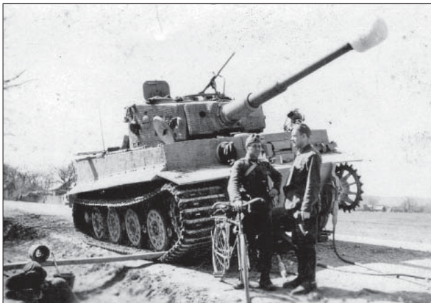
18. ábra. Pz.VI.E Tigris harckocsi műszaki mentésre vár

A magyar kezelőszemélyzet átképzésének a végén a harckocsizók éleslövészetet hajtottak végre az első vonalban. A Tigris harckocsikkal felszerelt nehézharckocsi-századokat a 24. magyar gyaloghadosztálynak rendelték alá.