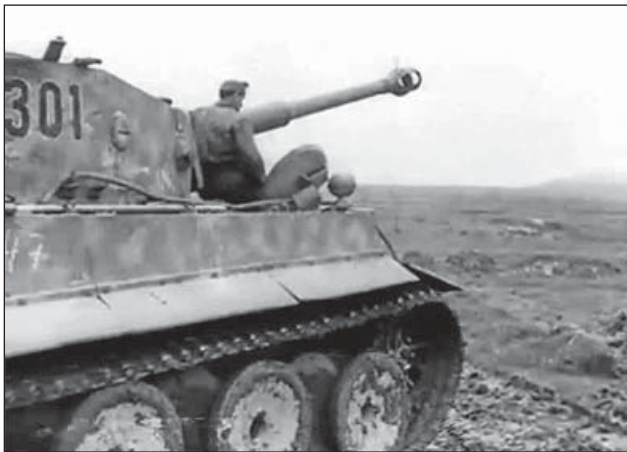
17. ábra. Pz.VI.E Tigris harckocsi, 301 torony számmal

A 3. harckocsiezred 1944 májusában, részlegesen átfegyverzésre került. A magyar páncélosok 12 db Pz.IV.H, 10 db Pz.VI.E Tigris harckocsit és 10 db StuG III-as rohamlöveget és 10 darab Pz III. M harckocsit kaptak. A harckocsiezred 3/I. zászlóaljába kerültek a német harcjárművek, a 3/II. zászlóalj pedig a megmaradt magyar harckocsikkal harcolt tovább.