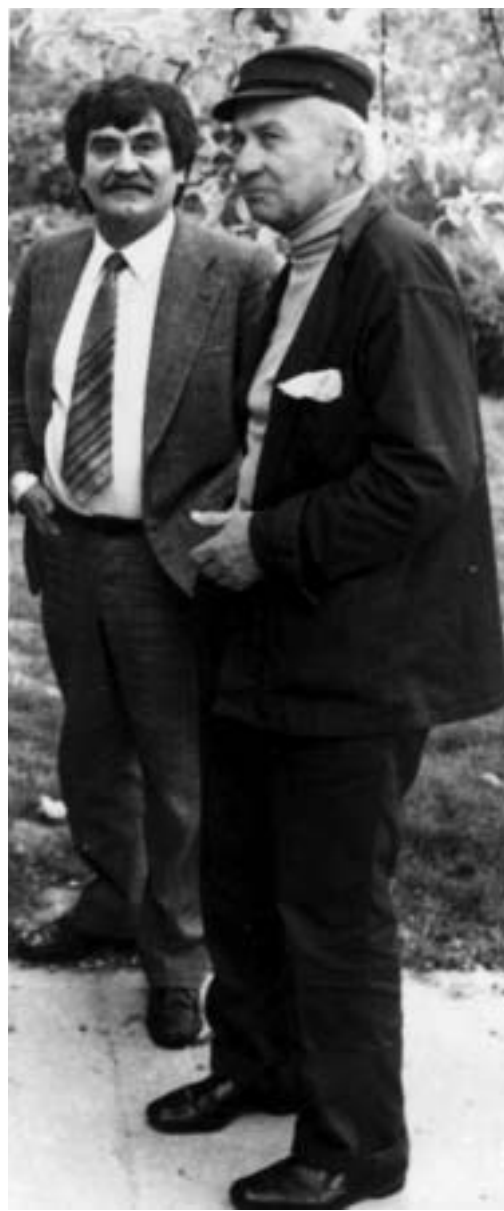
Juhász Ferenc és Illyés Gyula (Budapest, 1980, magántulajdon)