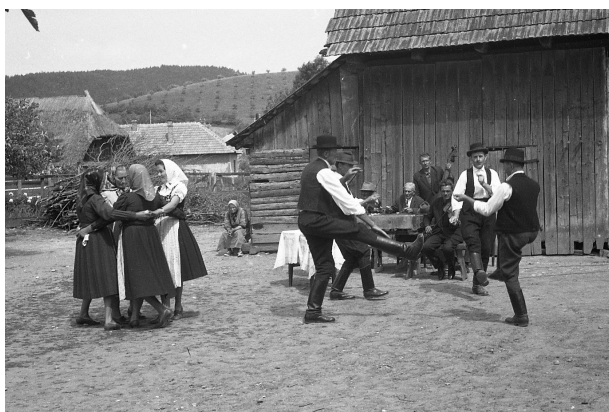
3. kép. Tánc Bonchidán (Bonțida) egy megrendezett filmfelvétel alkalmával. A képen jól látható, hogy a legényest járó férfiak a zenekar előtt táncolnak, míg a négyest táncoló nők oldalt helyezkednek el. (BORBÉLY Jolán felvétele, 1969. Bonchida. MTA BTK Zenetud. Int. Táncfotótára Tf. 25147.)

térhasználat attól függött, hogy legényes kíséretként, vagy önmagában táncolták-e. Az előbbi esetben a zenészek előtt a figurázó legények táncoltak, mellettük pedig két-három négyes forgott, az utóbbi esetben a négyesek az egész táncteret használhatták.