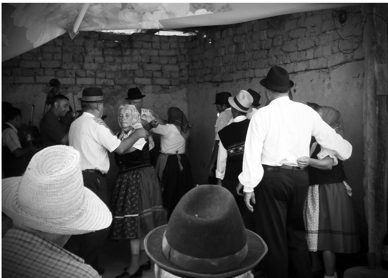
4. kép. Sorban állás és tánc a zenekar előtt egy visai csűrben. Az egykori táncos térhasználat rekonstrukciója során megrendezett táncfelvétel.

és a sorban álló többi táncos figyelme is ide összpontosul, ami a zenész előtt táncolót a pontos és szép előadásra ösztönzi, valamint arra, hogy a legnehezebb, leglátványosabb figuráit vegye elő. A tánc tér szabadsága ezt meg is engedi: a kar alatti forgatások, átbújások, külön táncolt motívumok, csalogatások mellett legnagyobb arányban itt fordul elő a páros forgás, illetve az, hogy a férfi a nő vállára téve egyik kezét a másikkal csapásol. A csapásolásokat (akár külön, akár a nőre támaszkodva) a megfigyeléseim és az elmondások szerint is leginkább ekkor használják.