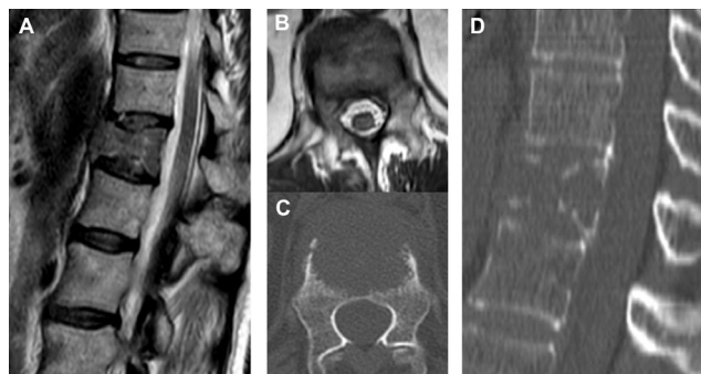
2. ábra | Tüdőadenocarcinómának a ThXII-es csigolya patológiás törését okozó metasztázisa (A, B: MR; C, D: CT)

A fenti eset jól demonstrálja a gerincmetasztázisok modern kezelési algoritmusának alkalmazását és a kombinált, célzott és minimálisan invazív kezelési módszerek létjogosultságát. A paradigmaváltást a modern onkológiai és sebészeti módszerek egyénre szabott kombinációs lehetősége jelenti a gerincdaganatok kezelésében. A célzott, egyénre szabott terápiai módszerek kombinálásával a terápiai hatás (túlélés és funkció) szignifikáns javítása érhető el, a mellékhatások, nemkívánatos események kockázatának jelentős csökkentésével. A bizonyítékokon alapuló diagnosztikus és terápiai elvek mentén haladva a beteg számára gyors és hatékony, egyénre optimalizált kezelést tudunk biztosítani. A gerincmetasztázisok kezelésének fent részletezett elemei hazánkban technikailag és elvileg elérhetőek, bár a területi különbségek jelentősek lehetnek. A modern, hatékony terápia gyakorlati és széles körű megvalósításának lehetősége részben fi-