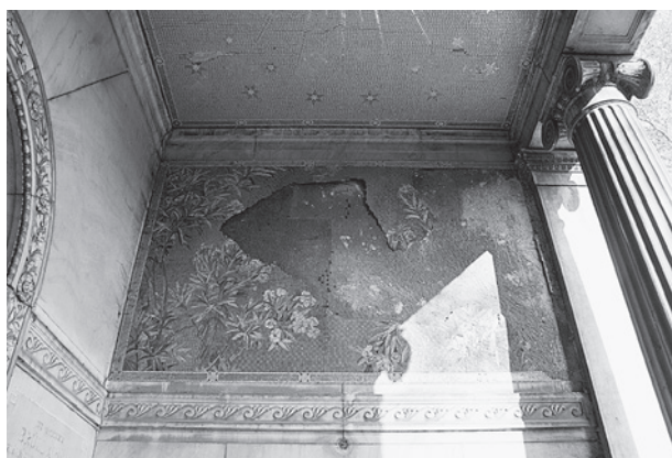
3. Mozaikkép virágos leanderágakkal a Brüll-síremléken. Budapest, Kozma utcai temető