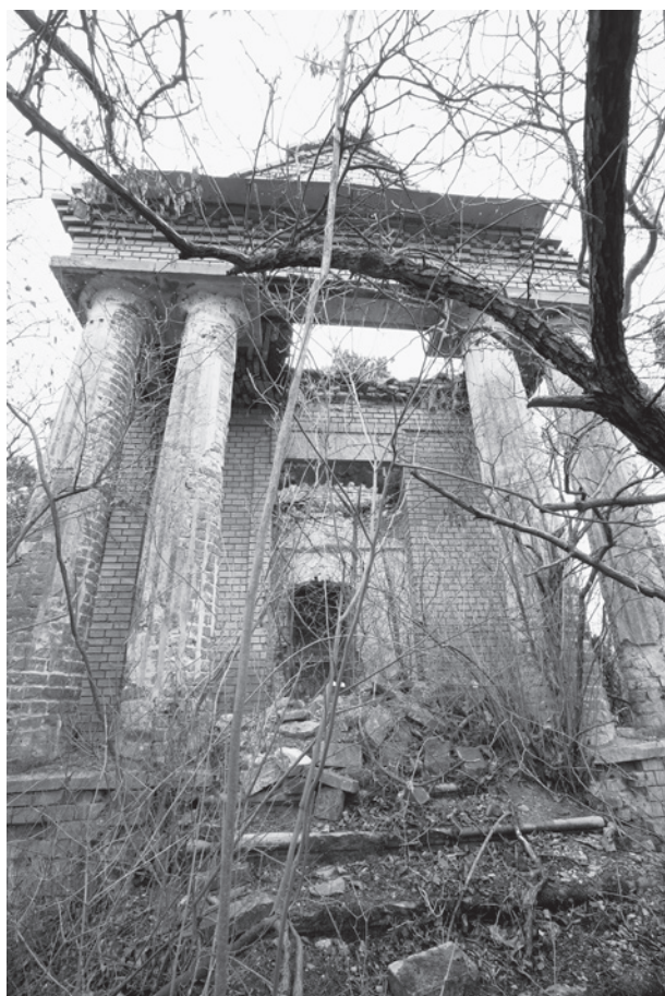
11. Az Ágoston–Kacs kovics-sírkápolna főhomlokzata. Szőlőskislak