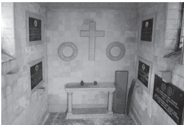
23. A Nagy-Gradwohl-sírkápolna belseje az oltárral. Pécs, temető

Körner József szobrász-építész páros az irodalom és a művészet kategóriában Kossuth-díjat kapott. 52