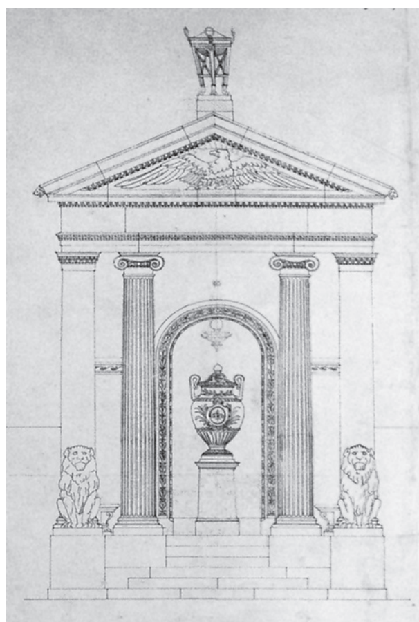
5. A Brüll-síremlék főhomlokzatának terovrajza

ékességedet és megújul a te ifjúságod, mint a sasé” (Károli Gáspár fordítása). 10 Az Örökkévaló feltámasztására vonatkozó ígéretének olvashatjuk a sorokat az Öszövettség talaján állva is. Program hiányában (a megbízó és a művészek között) egyértelmű „olvasat” nincs, a villámköteg pedig faktum. Óbudán a Lajos utcai klasszicista zsinagógában (1820–21) a templomtér közepén a gazdag architektonikus kialakítású empire ízlésű bima négy sarkán egy-egy