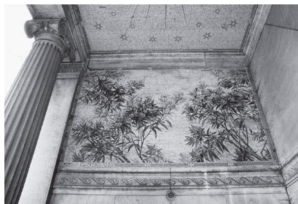
4. Mozaikkép virágos leanderágakkal a Brüll-síremléken. Budapest, Kozma utcai temető

neszánsz stílusban tervezett meg építésze. A Stróbl által mintázott oroszlánpár anyaga tirolai laazi márvány. Ruszkicai márvány az épület burkolóanyaga és tagozatai (utóbbi „némi aranyozással”, például az oszlopfőkön), valamint a sas is, amely egybe lett faragva a timpanon megfelelő építészeti elemével. A kőfaragómunka mestere a közlés szerint Král Gyula, a díszítő szobrászmunkáé Vögerl Alajos, a feliratok betűvésznöke pedig Blum Lajos volt. A bronzkapu, a lámpák és a tripusz Vandrák László műhelyében készültek. A közölt fénykép tanúsága szerint a bronzkapu a felvétel időpontjában még nem volt kész, a bejárattal szemközti falon a mozaikkép mára elpusztult harmadik eleme azonban felismerhető; kartonjukat Lohr Ferenc készítette. 7