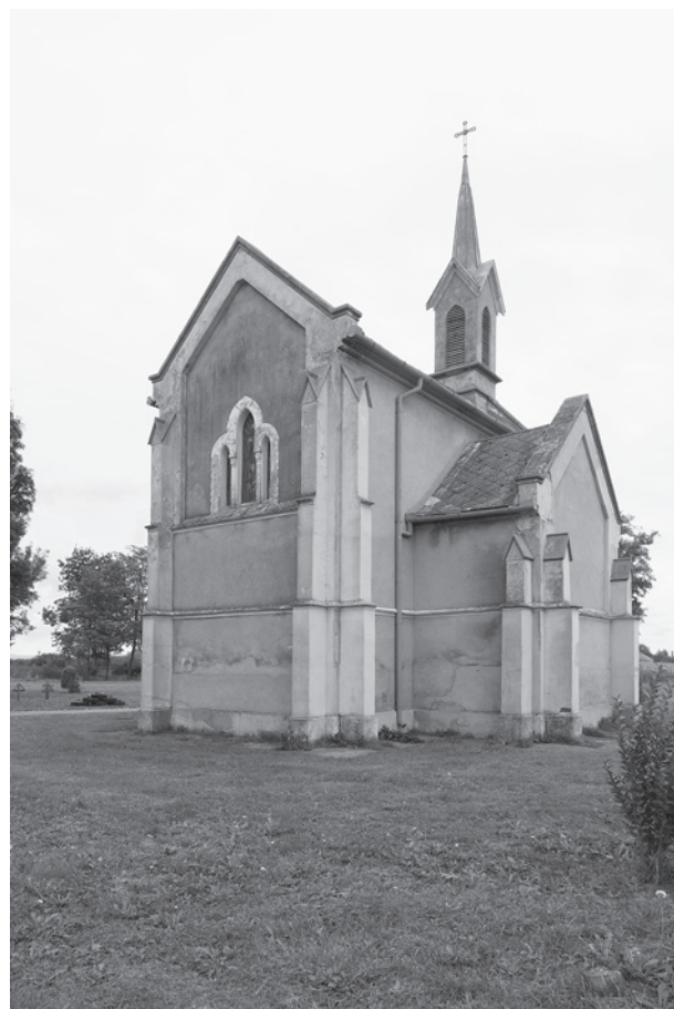
7. A Békássy–Hollán-sírkápolna a szentély felől. Békás