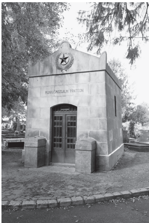
21. A munkásmozgalmi panteon (volt Littke-sírkápolna) a pécsi temetőben