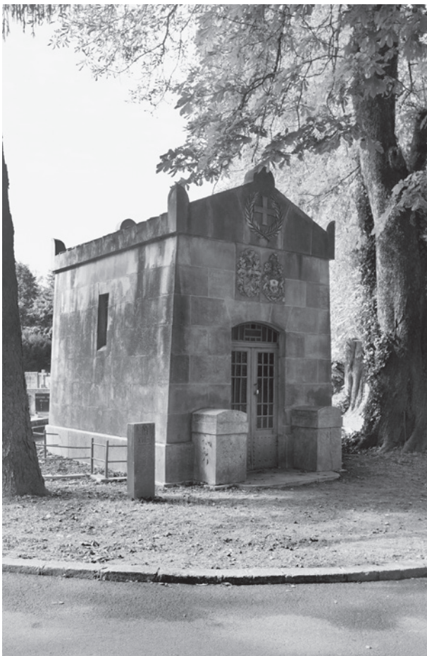
20. A Nagy-Gradvohl-sírkapolna a pécsi temetőben