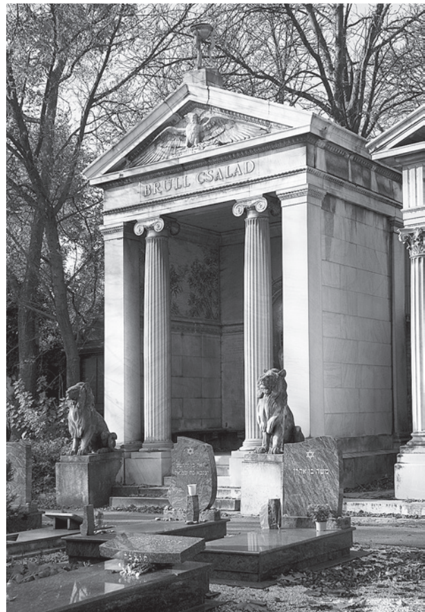
1. A Brüll-síremlék főhomlokzata. Budapest, Kozma utcai temető

nyílik a kriptafedél. Az oldalfalak előtt oroszlánlábú kőpad fut L alakban. Az övpárkány fölött kétoldalt – erősen pusztuló állapotának ellenére is megítélhető – kvalitásos mozaikkép készült. A zsidó képtilalomnak megfelelően florealis, fehér és ró-