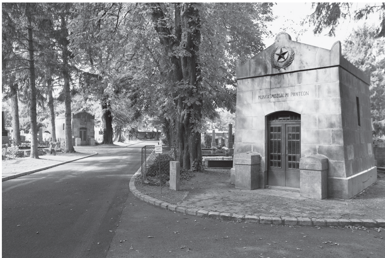
19. A Nagy-Gradvohl- és az egykori Littke-sírkápolna a pécsi temetőben

a Kacskovics család 400 forintos alapítványt hozott létre az egyházi jóváhagyás végett. A levélben még olvasható, hogy a kápolna ugyan külsőleg készen állt már, de a „szükségesekkel felszerelve” még nem volt, ezért felszentelése csak a következő évben lehetséges. Ellenben azt kérte Szöllősy, hogy a sírboltot a folyó hó végével mégis felszentelhesse, mert a család „feje, boldogult Kacskovits Ignáz Tótygyugyról” áthelyezhető lenne, az „ő jó gyermekei által neki szánt költséges szép helyre áttéve”. Egyben kérelmezte, hogy a szentelést maga végezhesse. 40 A plébános 1884. július 15-én kelt levelében megírta püspökének, hogy a feltételek teljesülése és az engedély birtokában előző évben felszentelte a sírboltot. Egyben jelentette, hogy a „csinos” kápolna elkészült, s az építtető „jó és buzgó család [azt] Loyola Szent Ignáz tiszteletére kívánja felavatni... innepnapján [VII. 31.] általam... ezen szent ténykedés igen nagy öröömre szolgálna”. Folyó hó 18-án még Veszprémbe is elutazik – jelezte –, hogy ott „egy Szent ereklyével ellátott oltárkövet a kápolna részére nyerhessek”. 41 A sírkápolna felszentelésének dátuma magával hozza a kislaki Kacskovics-kúria, kiskastély építésének dátumát, bizonyosan 1883 elé. 42 Ennek portikusza alól, a terület elvadultsága előtt rá lehetett látni a „végső” nyughelyre. 43 A Lechner-design, bordázott dístégla pedig egy