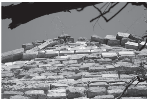
17. Mázas idomtégglák az Ágoston–Kacs Kovics-sírkápolna főhomlokzatának belső síkján. Szőlőskislak

javítása érdekében. A szárazon sajtolást a finomszerkezetű szelvényes, szintén sajtolt téglagyártása váltotta fel a tisztított anyagból. Az építészek által megkívánt sárga és veres szín előállításához ekkor már fénoxidokat nem használtak. 34