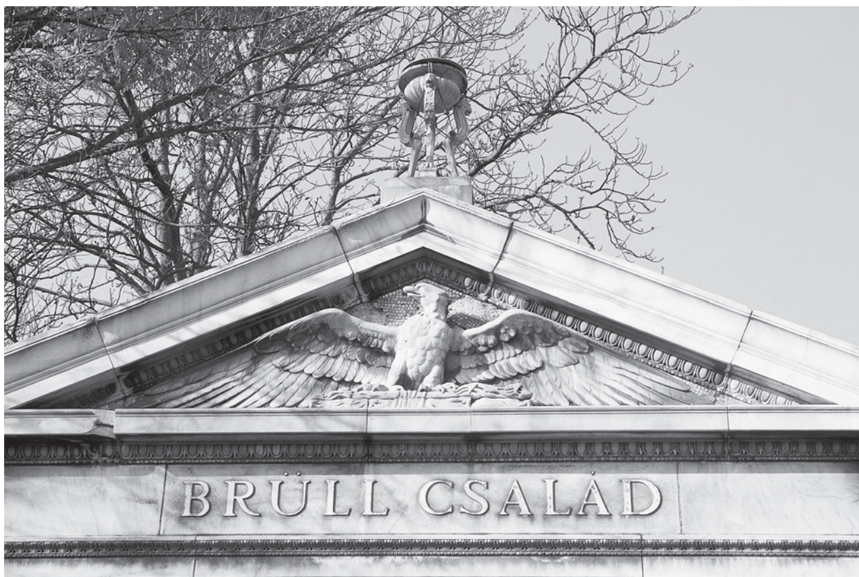
2. A Brüll-síremlék timpanonja. Budapest, Kozma utcai temető

zsaszínű virágzó leanderágakat ábrázol; égszínkék háttér előtt jobb kézre, szemben vele kékkel átszótt fehér alapon. (3–4. kép) A sík mennyezetet szintén mozaikkompozíció díszíti: kék alapon csillagok, centrumában napsugár koszorúzza Dávid-csillag. Az 1891-ben megnyílt temetőben Gerster Kálmán (1850–1927) tervei alapján épült a mauzóleum, a szobrászi részeket Stróbl Alajos (1856–1926) mintázta, miként ezt a jobb oldali oszlop talplemezébe (plinthosz) vésett felirat megörökítette. 2