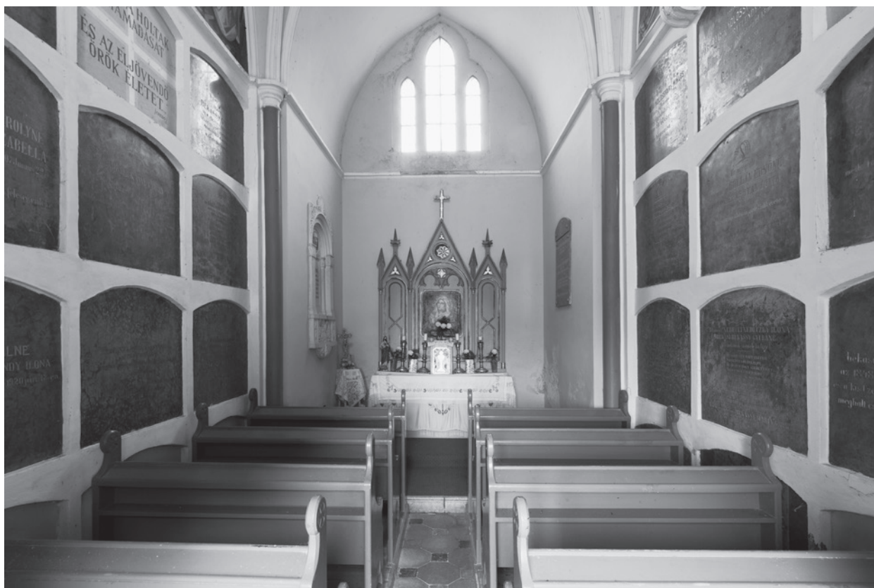
8. A Békássy–Hollán-sírkápolna belső tere az oltár felé. Békás

elhunytak az „egyesületi helyiségben (IV. Ujvilág u. 2. II. em.) lévő arczképét egy éven át gyászfátyollal borítja... a Békáson rendezendő végtisztességtelen küldöttségileg vesz részt”. 15