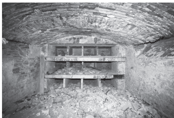
15. Az Ágoston–Kacskovics-sírkápolna kriptája. Szőlőskislak

Komárik Dénes már felfigyelt a gyakran (és javítatlanul) idézett Lechner-életrajzrész nehézségeire. Nem csupán a „Ferster” (értsd Ludwig Förster) nevet helyesbítette, de a Dohány utcai zsinagóga építéstörténetének bemutatása során rámutatott arra is, hogy az 1854 és 1859 között kivitelezett épülethez a Lechner-téglagyár aligha szállíthatta az „összes” terrakotta és majolika munkát, ahogyan az akkor 13–14 éves fiú sem igen vezethetett anyagkísérleteket. 32 A zsinagóga ránk maradt építési irataiban a polikróm nyers, szárazon sajtolt dísztéglá, illetve téglá vonatkozásában a Drasche Gyár neve bukkan fel. Egy dátum nélküli jegyzék – „zu der Bandverzierung für den israelitischen Tempelbau in Pest erforderlichen Terracotten” – 5475 forint értékben részletezi a terrakotta-, kerámiaanyagot. 33