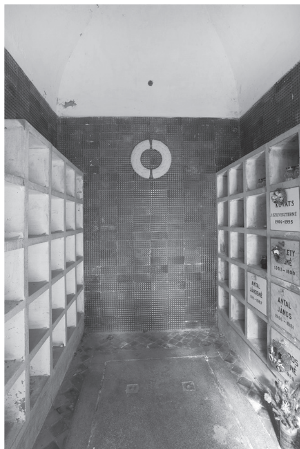
22. A munkásmozgalmi panteon belseje. Pécs, temető

apró fali oltármű részei a hozzá tartozó koszorú és kereszt. Úgy néz ki, hogy egy falazott téglamagot burkoltak kívülről a kőszerű terrakotta elemekkel. Egyes tervlapokon dátumok is szerepelnek, munkaforma megsemmisítve: 1909. X. ?, az oltármű 61 cm magas oszlopocskája: 1912. I. 12. 47