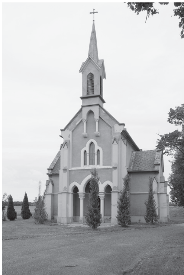
6. A Békássy–Hollán-sírkápolna főhomlokzata. Békás

mesterunktől származó családi sírboltban”. Az elnökség október 31-én adta át az emléket az özvegynek. A családi jellegű „szerény” ünnepen a Magyar Tudományos Akadémia is képviseltette magát. Leírást is közreadtak a műről: az „emlék középpontját a nagy halottnak domborművű mellképe, tábornagi egyenruhában alkotja..., melynek két oldalán egy-egy festett nemtő áll őrt, egyik a mérnök tárcsás lévét, a másik a katona pallosát tartja a kezében”. Az alkotók felsorolása egyezik a Művészet ben közöltekkel. Az Értesítő a Hollán-Sírkápolna ( sic ) homlokzati fotóját – tervezte Ybl Miklós, erősíti meg a képalírás –, a síremlék fényképét és a kápolna alaprajzát is közölte. 14 Hollán Ernőt, a Szombathelyen 1824. január 13-án született és Bécsben hadmérnöki akadémiát végzett tisztet Kossuth Lajos őrnaggyá, hadmérnöki főnökké nevezte ki. Tagja volt a kiegyezést előkészítő bizottságnak, valamint az ország vasúthálózatának kiépítésében szerzett érdemeket. Haláláról az Egylet Értesítőjének rendkívüli száma adott hírt: „Egyesületünk elnöke... [1900.] május hó 29-ik napjának első órájában költözött el közülünk.” Az Egylet május 30-án Budapesten du. 4 órakor tartandó gyászszertartáson testületileg jelenik meg, és az