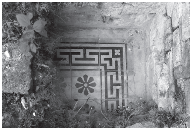
18. Padló részlet meander-dísszel az Ágoston–Kacskovics-sírkápolnában. Szőlőkislak