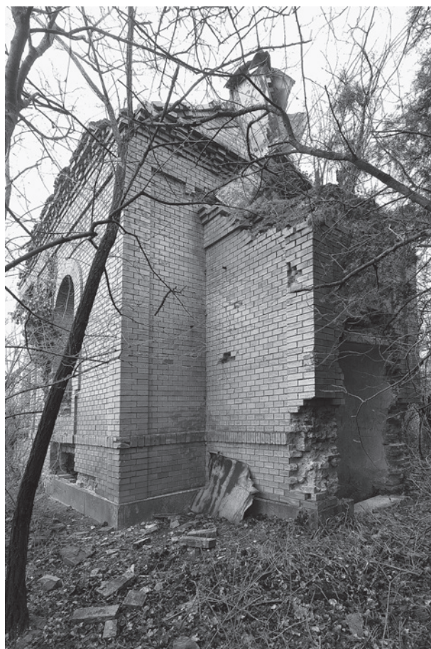
14. Az Ágoston–Kacskovics-sírkápolna a szentély felől. Szőlőskislak

között a bécsi Ferstel ( sic ) építész által tervezett budapesti zsinagóga összes terrakotta és mázos majolika munkáit is. Akkor és attól fogva vezetésem alatt számos kísérletet végeztünk a kerámia terén, s úgy látszik, ezen ifjúkori foglalkozások egészen későbbi munkásságomra elhatározó befolyást gyakoroltak... 31