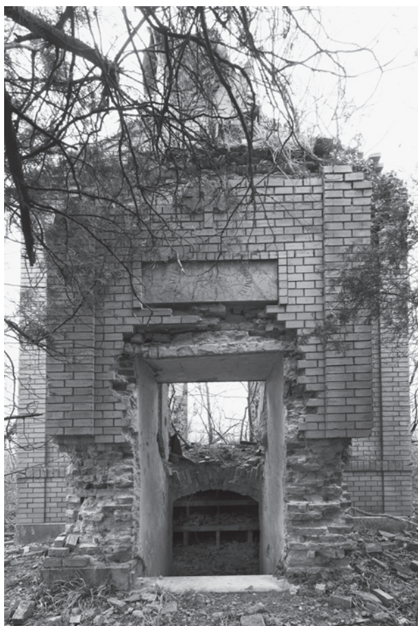
16. Az Ágoston–Kacs Kovics-sírkápolna kriptalejárata. Szőlőskislak