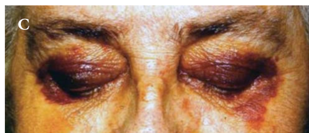
3. ábra | „Mosómedveszem” AL-amyloidosisban