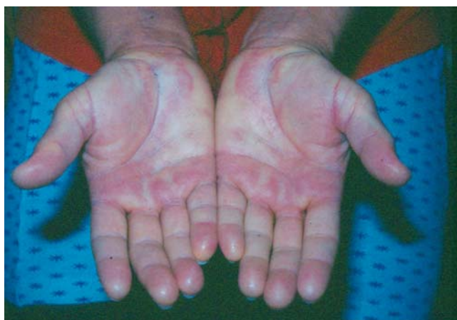
2. ábra | Bőrérítetttség AL-amyloidosisban

lása és a nyirokcsomó szövettani vizsgálata is szükséges. Fontos hangsúlyozni, hogy a normális csontvelői plazmasejtarány nem zárja ki AL-amyloidosis jelenlétét, mert gyakran normális vagy csak enyhén emelkedett a monoklonális plazmasejt aránya.