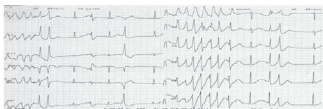
3. ábra | Monitorozás során észlelt rövid kamrai tachycardia