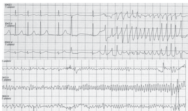
4. ábra | „Torsades de pointes” kamrai tachycardia, majd kamrafiibrilláció