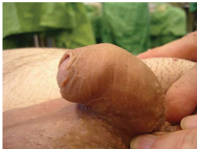
2. ábra | Rövid húgycső: már nyugalmi helyzetben is kifejezett lefelé irányuló görbület

A nemi érés, serdülőkor után kerülnek felismerésre azon esetek, amelyekben a hímtag görbülete az egyetlen tünet és csak merevedéskor nyilvánul meg. Az egyébként teljesen ép küllemű hímvessző általában jól fejlett, sőt inkább kifejezetten hosszú. A kórfolyamat lényege a barlangos testek tokjának merevsége, kóros fejlődése valamelyik oldalon, ami megnyúláskor a hímtag ívszerű elhajlását hozza létre. A kóriszmézés felületességét mutatja, hogy több betegünkön előzőleg frenulotomiát, körülmetélést végeztek, a görbület okaként rövid fétet, fityma-rendellenességet feltételezve. Leggyakoribb a lefelé vagy oldalra irányuló görbület, de észleltünk has felé történő elhajlást is. Tapintással a hímvesszőben csomót nem érzünk, lefelé irányuló görbület esetén azonban gyakorlott vizsgáló a hímvessző nyújtásakor vagy merevedéskor a húgycső mellett kétoldalt, a barlangos testek tokjának megfelelően kifeszülő húst érezhet. A kiegyenesítő műtét lényege a barlangos testek tokjának a görbület domború oldalán történő rövidítése. Ennek ismert módzata a tunica albuginea haránt irányú varrata babérlevél alakú kimetszéssel vagy a nélkül (Nesbit-műtétek). Ezen plikációs, raffolós műtétekkel egyesek jó eredményekről számoltak be [10, 11]. Mások azonban gyakori görbületkiújulásokról adnak hírt a plikációk után [12, 13]. Gyakorlatunkban a legeredményesebb rövidíté-