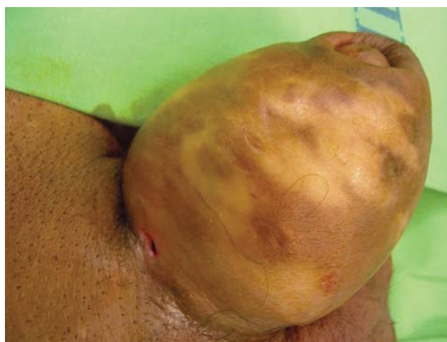
4. ábra | Vazelin granuloma okozta duzzanat. A bőr fehéres-sárgás színe, a vazelin jelenlétén túl, a súlyos ischaemiás keringési zavart is jelzi

kórfolyamat révén egyaránt vezethet szövetkárosodáshoz. Klinikánkon két beteget is kezeltünk, akiknél a befertőződés súlyos cavernitishez, majd tályog kialakulásához vezetett. Az életveszélyes szepszisbe került betegekben a barlangos testek nagy része elpusztult, s csupán vizelésre alkalmas torz hímvessző maradt vissza [27]. Másik, gyakoribb károsodási forma az ismételt intracavernosus injekciókat követő fibrosis. Európai többközpontú vizsgálat során 162 beteg 4 éves megfigyelése alatt 19-ben (12%) észleltek fibroticus csomókat, hímvesszőtorzulatot [28]. Klinikánkon két másik öninjekciózó betegen észleltük a hímtag közönsülést akadályozó görbületét, amelynek megszüntetése csak műtéti úton történő kiegyenesítéssel volt lehetséges.