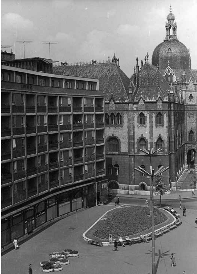
7. kép. Az Üllői út 39–43. helyén felhúzott épület (tervező: Csics Miklós) homorúan visszaléptetett homlokzata és a kis pihenőpark a korábnál kedvezőbb rálátást biztosított Budapest egyik legjelentősebb szecessziós épületére.

Az iménti épülettel átellenben áll a szakirodalomban Lottóházként ismertté vált, szintén Csics Miklós tervezte József krt. 86. számú saroképület. 77 A József körüli foghíjbeépítést a Magyar Építőművészet 1959/9–10-es számában Rimanóczy Jenő az egyik legjobb korabeli alkotásnak nevezte: „Az épület jó arányú, kőburkolatú raszterével, az egyes rasztermezőkben alumínium ablakokkal és kerámia burkolatú papret falakkal. Kellemes hatású homlokzatot ad.” 78 Rimanóczy természetesen nem