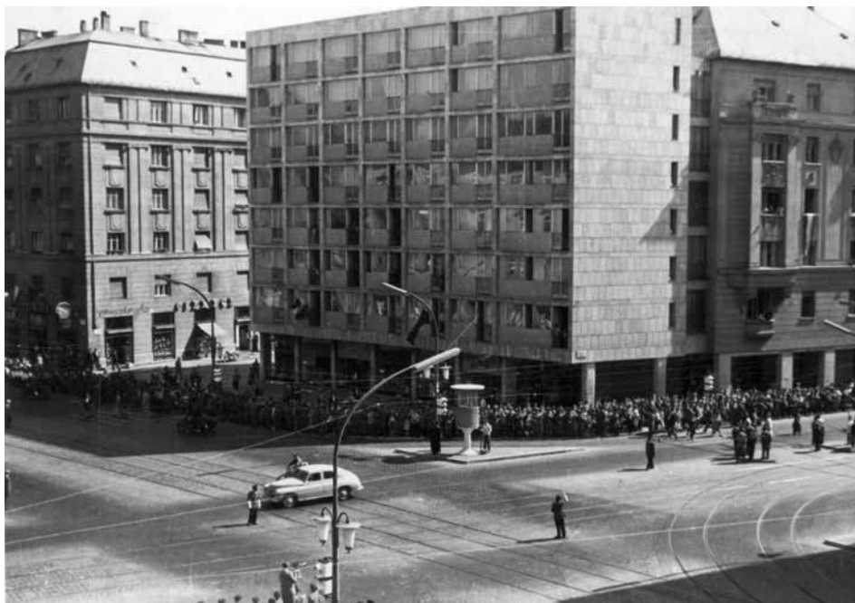
1–3. kép. Budapest, József krt. 86. a forradalom napjaiban mint háborús helyszín, az újjáépítés idején 1959-ben és mint állami reprezentációs tér Gagarin fogadásakor 1961-ben.

nyeként a hatvanas évek elejére Budapest főútvonalain végighaladva egy „nyugatis” (értsd: a nyugat-európai, fogyasztói, modern – mindaz, amit akkoriban ez a fogalom jelölt), lüktető városkép kívánta fogadni a látogatót: neonfeliratokkal, egy-ségesített üzletportálokkal, árkádositott sétálózónával. 19 Ha a városképszépítési akciót a forradalom nyomán keletkezett legitimációs válságra adott politikai válaszként értelmezzük – márpedig erre a források alapján jó okunk van, hiszen a budapesti végrehajtó bizottsági üléseken a helyreállítás témája hónapról hónapra felbukkan, sőt a kormány is foglalkozott a kérdéssel (lásd a hivatkozásokat) –, úgy azt mondhatjuk, hogy a városkép modernizációjának voltaképpen a forradalom maga volt a kiváltó oka, még ha áttételesen is.