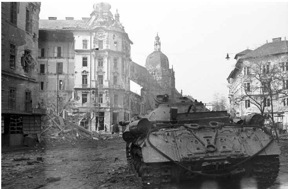
6. kép. Az Iparművészeti Múzeum előtti házsor (Üllői út 39–43.) jelentős sérüléseket szenvedett, de teljes bontásukat elsősorban a forgalmi rendezés indokolta. Forrás: Fortepan 39833 / Nagy Gyula (1956)

lehetett nyerni, többek között az Üllői úti épületben is. Egy 1961-ben készült filmhíradórészlet néhány percben foglalkozott is a „pompás lakások birtokbavételével”. A narrátor szövege szerint ez volt a főváros harmadik lottóháza, de a házfalon elhelyezett neonreklám miatt inkább OTP-házként lett ismert. A környező házak századfordulót idéző, a 20. század közepén már kopottas kispolgári-munkás világában a fürdőszobás, beépített konyhás lakások valóban „forradalmian” modernnek tűnhetek. 75 A kortárs formai megoldások, az öröklakás-akciót koordináló banki háttér, a lottót körülvevő fogyasztói hangulat (a fogyasztás és a birtoklás kispolgári értékrendjének kifejeződése a korábbi mozgalmi propaganda helyett) sűrítve jelenítette meg a forradalmat (és vele a Rákosi-rendszert is) maga mögött hagyó korai Kádár-rendszert és annak nép felé tett engedményeit. Mindemellert az épület tág perspektívát biztosított az Iparművészeti Múzeumnak, az előtte kialakított kis pihenőpark pedig a Főkert-propaganda fotóanyagában is felbukkan 76 (6–7. kép).