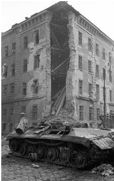
5. kép. Kilián laktanya. Noha a forradalomban szimbolikus szerepet játszott, az 1957-es tervpályázat szellemében az eredeti műemléki helyreállítás mellett döntöttek.

logikáját. Nem kerülnek ugyanakkor bemutatásra a harcok által érintett mellékutcák, hiszen azok nem szerepeltek a főútvonalakra koncentráló városszépítési akcióban. Az így kijelölt vizsgálati területen mintegy kilenc házat építettek fel 1956 után. 39 Ilyen koncentrált városépítészeti beavatkozással egyetlen más, forradalomban érintett helyszínen sem találkozhatunk. A foghíjbeépítések itt egymásba érnek, sőt városképi együttesé fornak össze.