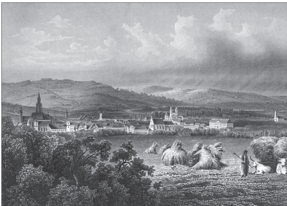
Kolozsvár látképe a 19. században

A sort végül a tordai megemlékezésel zárjuk, amelyről szintén a Honvéd -ban maradt fenn egy élvezetes beszámoló. Igaz, az utóbbi egy kicsit később,