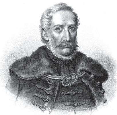
Csányi László (1790–1849)

A katonai sikerek hatására az Országos Honvédelmi Bizottmány az alábbi szavakkal rendelte el március 15-e megünneplését: „A honvédelmi bizottmány rendeletéből martius 15-dike, melynek szent emléke előtt leborul a szabadság fia, országos népünneppé tétetvén, központi városunkban megtartatott, nem fényével a külső máznak, nem fitogtatásával az aranyos öltönyök, s drága készületű fogatoknak, melyeken azonban a nép vére szokott pirosolni, hanem egyszerűen, minő az őszinte kebel becsületes hálája.” Vagyis