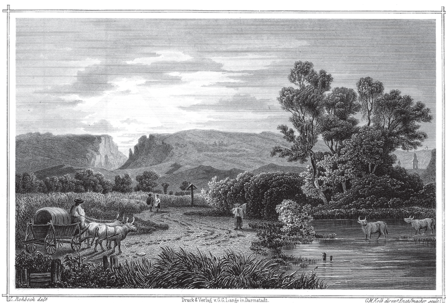
A TORDAI HASADÉK. BERGSPALTE BÉI TORDA. Nº 11