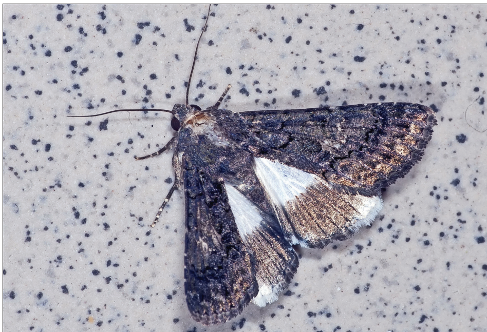
15. ábra: Aedia leucomelas (Linnaeus, 1758)