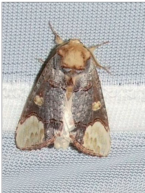
12. ábra: Phalera bucephaloides (Ochsenheimer, 1810)