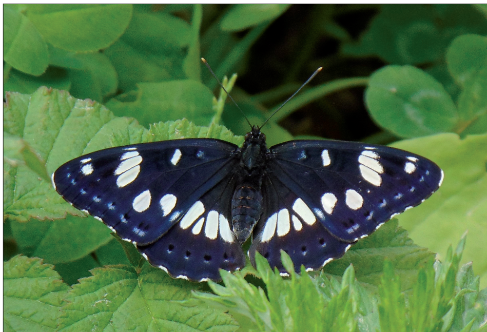
17. ábra: Limenitis reducta Staudinger, 1901