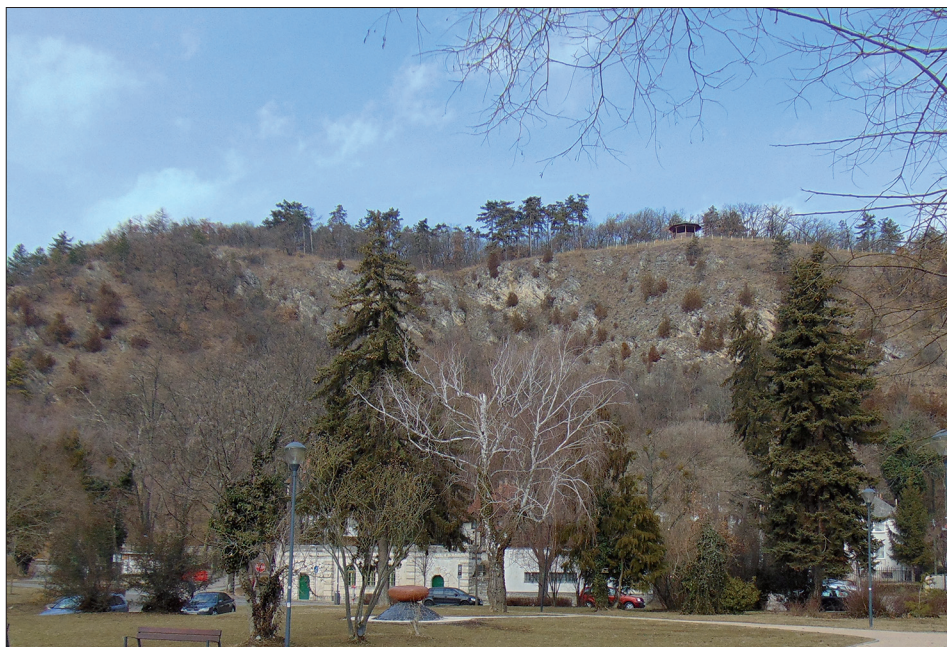
3. ábra: A pécsi Tettye feletti meredek sziklás lejtő, a hetvenes évekbeli gyűjtések közelében.