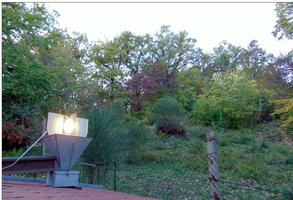
2. ábra: Hordozható fénycsapda Pécs Deindolban, a háttérben egy elhagyott szőlő helyén kiirtott bozót, mögötte melegkedvelő tölgyes.