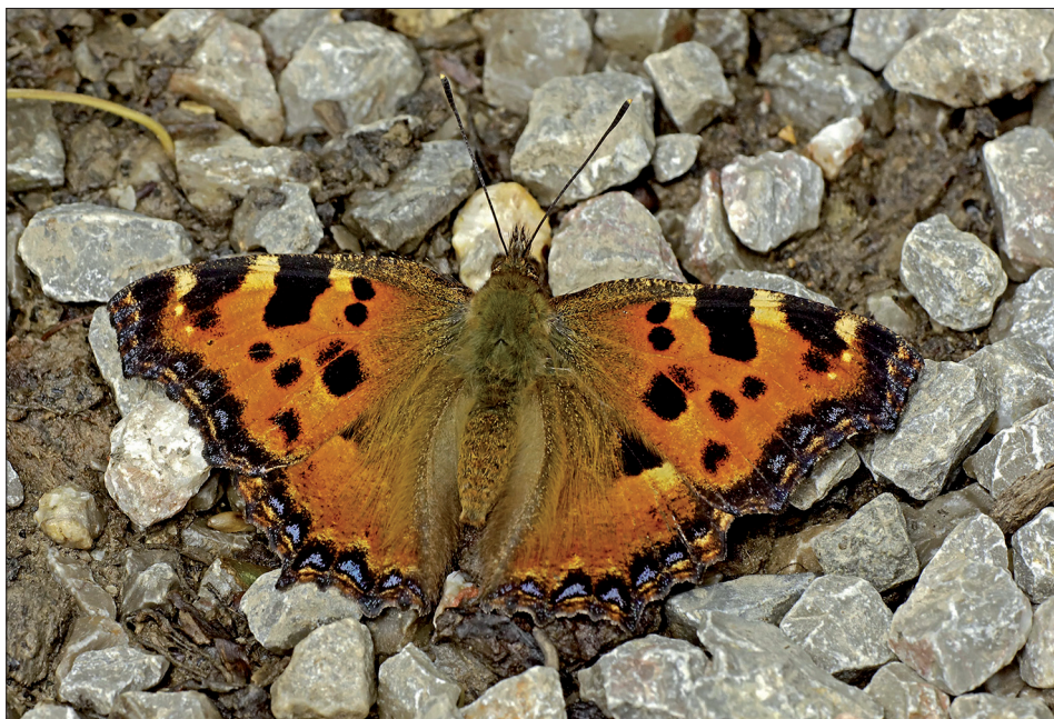
18. ábra: Nymphalis polychloros (Linnaeus, 1758)