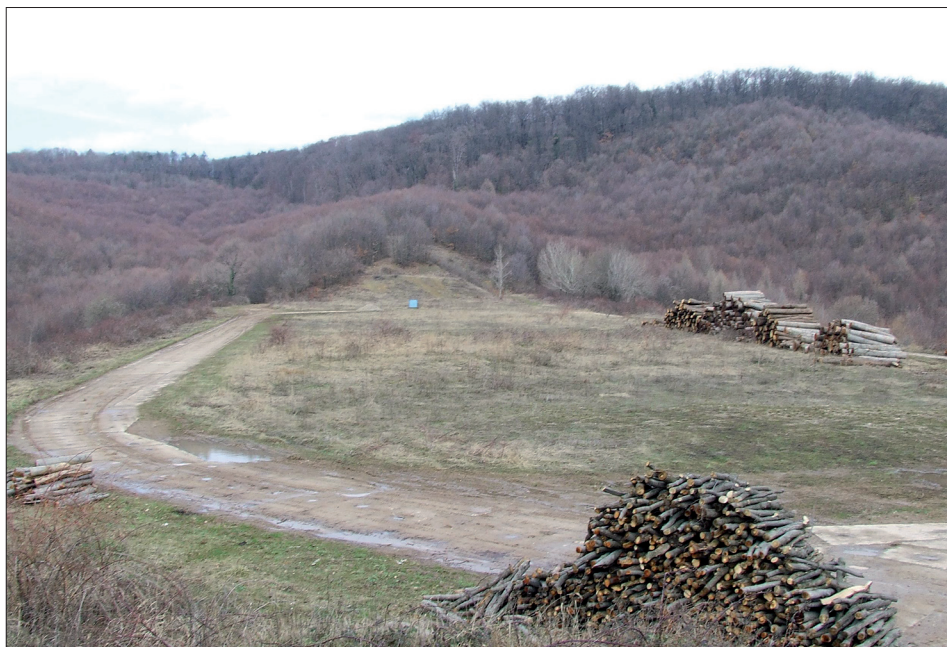
7. ábra: Pécs, Mecsekszentkút, Szunyola, az egykori légakna rekultivált helyszíne.