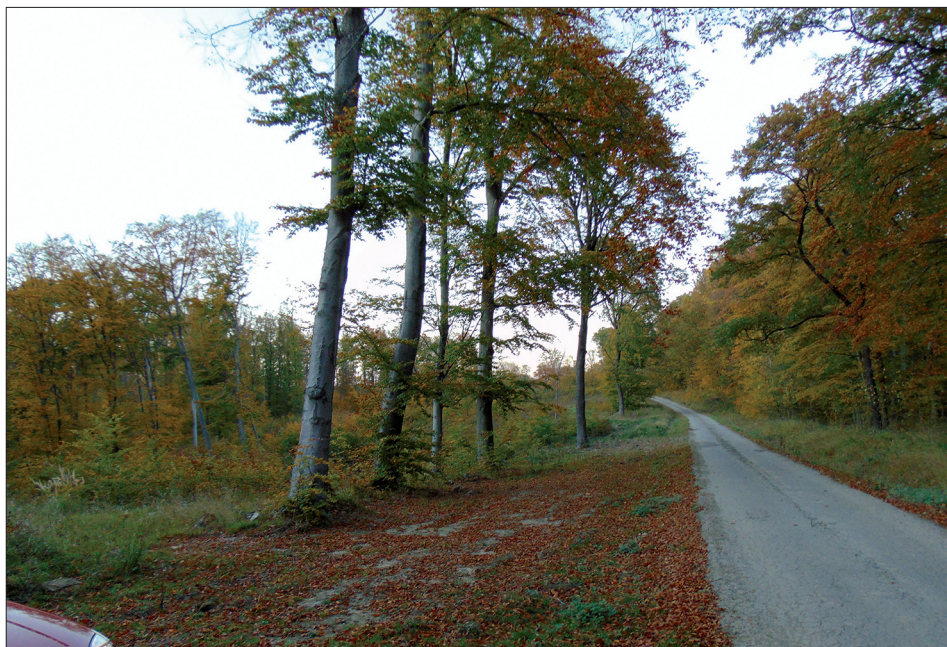
6. ábra: Orfű, Cigány-hegy, a Lóri kulcsosházhoz vezető út. Bükkelegyes gyertyános-tölgyes és irtása.