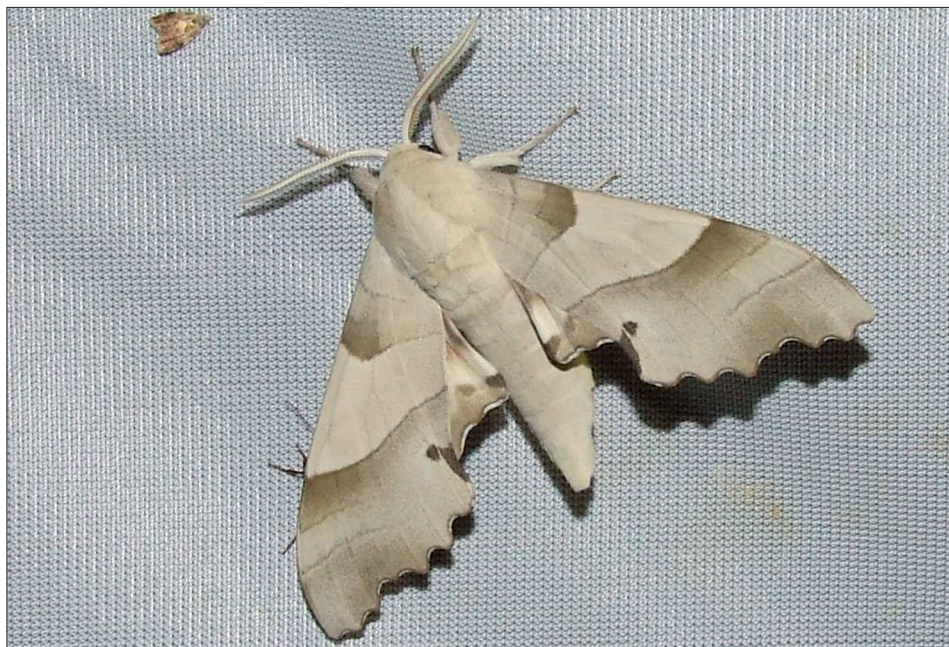
8. ábra: Marumba quercus ([Denis & Schiffermüller], 1775)