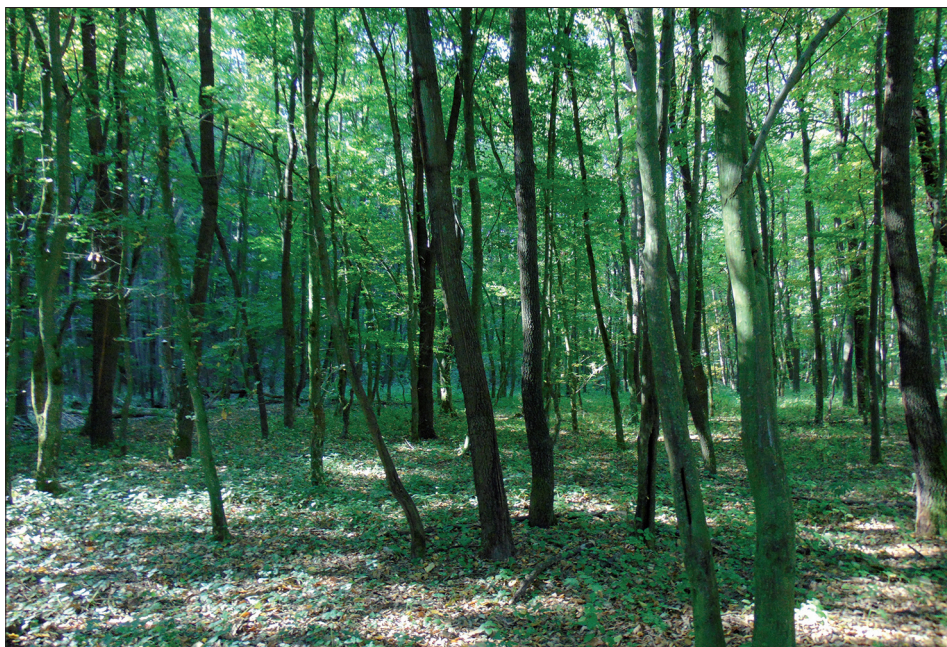
5. ábra: Völgyalji, középkorú keményfájú liget az abaligeti Nyáras-völgyben.