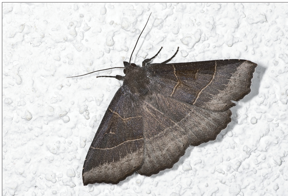
13. ábra: Arytrura musculus (Ménétriés, 1859)