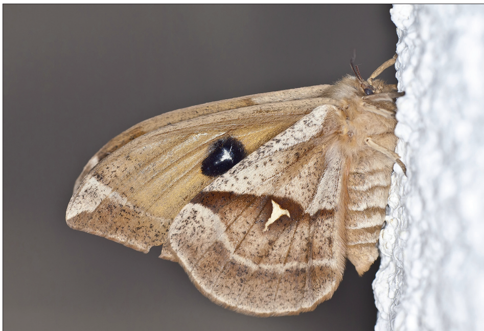
11. ábra: Aglia tau (Linnaeus, 1758)