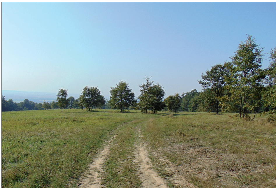
4. ábra: Cseres-tölgyes irtása, az egyik rendszeresen felkeresett éjjeli gyűjtőhely (Bakonya, Nagy-Rege).