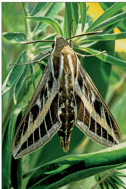
9. ábra: Hyles livornica (Esper, 1779)