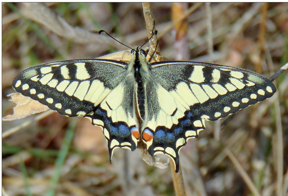
16. ábra: Papilio machaon Linnaeus, 1758