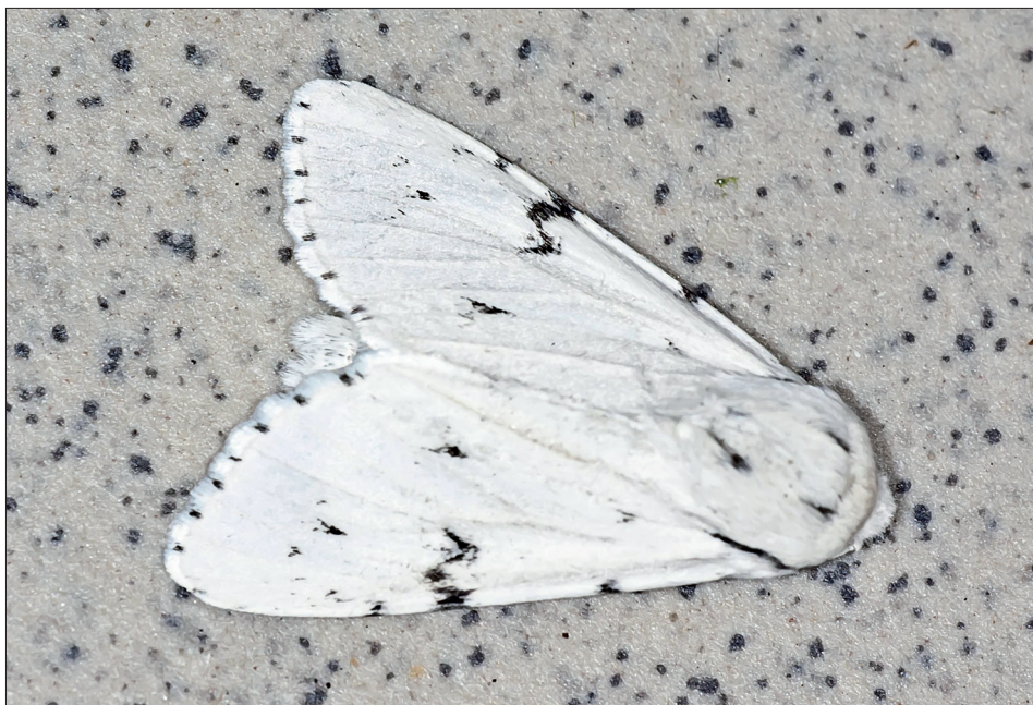
14. ábra: Acronicta leporina (Linnaeus, 1758)