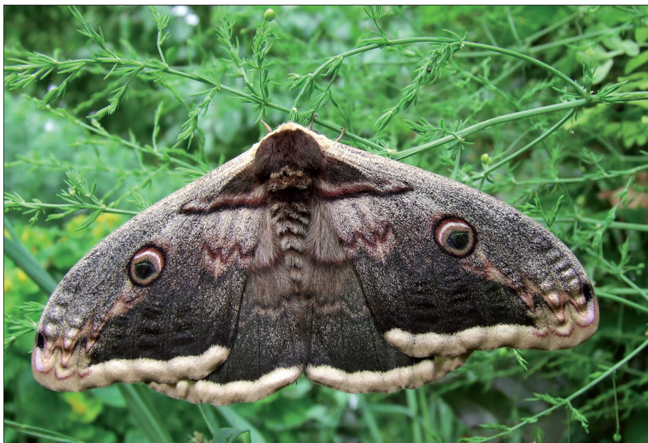
10. ábra: Saturnia pyri ([Denis & Schiffermüller], 1775)