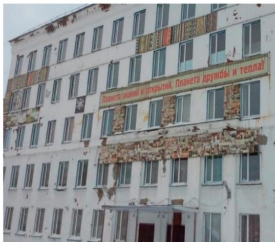
Az „1-es iskola” homlokzata, rajta őslakos ornamentikával díszített molinók

A helyi őslakos identitást kifejező motívumok azokon az épületen vagy azon épületek környékén találhatók meg elsősorban, ahol az adott intézményben – az „1-es” iskola, a szakközépiskola, a folklórközpontok – az őslakos nyelvekkel, kultúrával foglalkoznak.