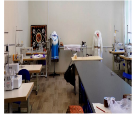
A szakközépi skola varrás terme