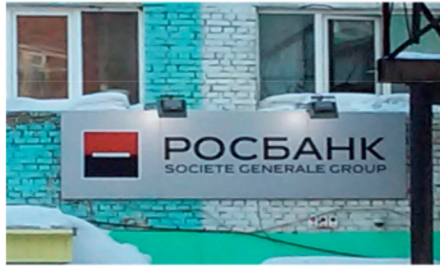
Egy francia anyai intézmény tagjának, a RosBanknak a hirdetőtáblája