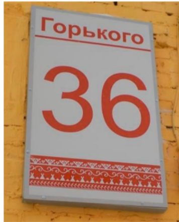
Hátszám alján nyenyec, evenki, nganaszan és enyec ornamentikával