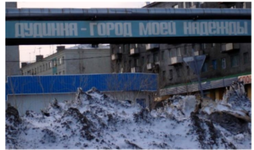
„Dugyinka - reményeim városa” óriástábla