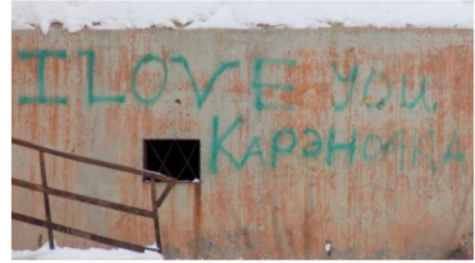
Angol nyelvű graffiti orosz személynével „I love you Karenocská”