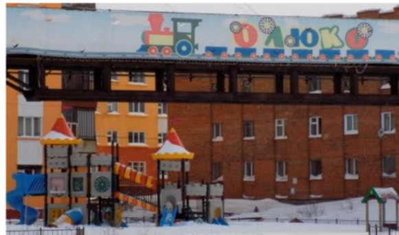
Játszótér nyenyec nyelvű felirattal

A másik egy újabb keletű óriástábla. 2011 nyarán valósult meg az a városi projekt, amelynek köszönhetően egy új, modern játszótér épült Dugyinka központjában. A játszótér és maga a projekt is az Олюко [olyuko] a nyenyec 'kisgyerek' szóról kapta a nevét. Később a projekt elnyerte a krasznojarszki terület legsikeresebb projektje díját.