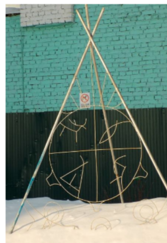
A Szakközépiskola előtt felállított 4 szobor egyike sátor (csum) alakú szobor őslakos szimbólumokkal (hal, vadász, sátor, rénszarvas)