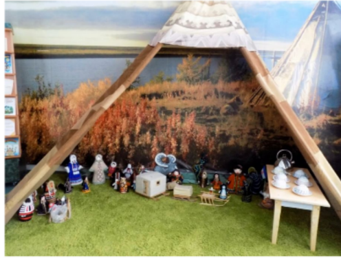
A szakközépiskola nyelvi terme