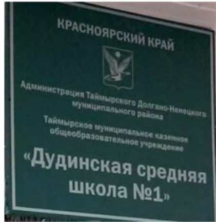
Az „1-es iskola” hivatalos táblája 2