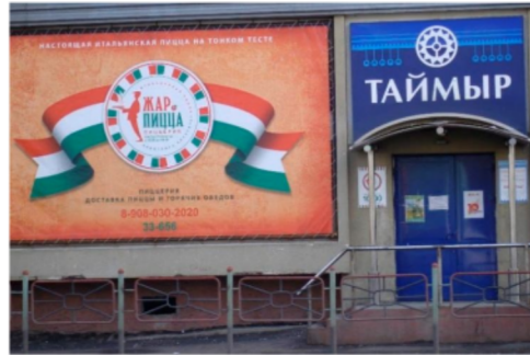
Tajmyr áruház, Pizza felirattal (tévesen - fordítva, magyarnak - festett olasz zászlóval, 2008)

feliratok, sem a multinacionális nagy kereskedelmi cégek és hirdetések nem színesítik túl gyakran Dugyinka nyelvi tájképét. A globalizáció természetesen elérte ezt a térséget is. A városban fellelhető számos olyan hirdetés, melyek a multinacionális kultúra és a fogyasztói társadalom nyomait mutatják.