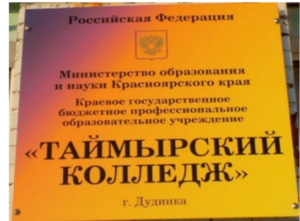
A Szakközépsiskola hivatalos táblája

Még azon intézmények táblája is kizárólagosan orosz nyelvű, ahol a nemzetiségi oktatás folyik, ahol jelen van a művészet, a népművészet, ahol az őshonos kisebbségek képviselői dolgoznak. A reklámformulák, a város utcáit behálózó szlogenek, feliratok is kizárólagosan többségi orosz nyelven jelennek meg.