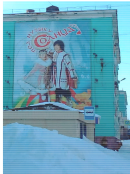
Óriásplakát, stilizált népviseletbe öltözött párral