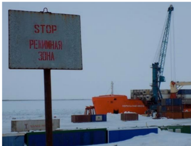
Behatolást tiltó tábla a kikötő területén. Az első megállásra felszólító szó, akár nemzetközi szó, akár az orosz latin betűs átírása is lehet.

Az őslakos kisebbségi nyelvek és kultúrák megjelenési formái a városi utcákon