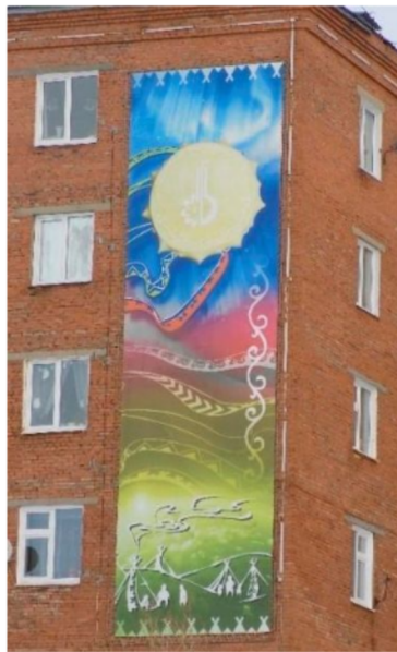
Óriásmolinó, az őslakos népek ornamentikáival és szimbólumaival

A városban egyre több újabb olyan molinó, óriásplakát jelenik meg, amin felfedezhetők az őslakos kisebbségi kultúra motívumai. A nap, a sátor (csum), a népviseletbe öltözött ember, a sámnádob, a rénszarvas és az egyes népek ornamentikái visszatérő motívumai a plakátoknak.