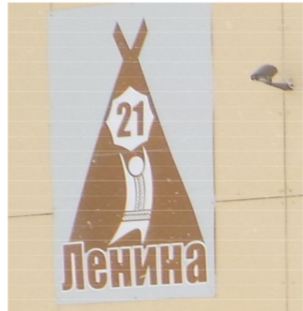
A Tajmiri Népművészetek házának hátszáma. A hátszámot egy a sátra előtt álló őslakos magasba tartott sámnádobjára festették

A városban egyre több újabb olyan molinó, óriásplakát jelenik meg, amin felfedezhetők az őslakos kisebbségi kultúra motívumai. A nap, a sátor (csum), a népviseletbe öltözött ember, a sámnádob, a rénszarvas és az egyes népek ornamentikái visszatérő motívumai a plakátoknak.