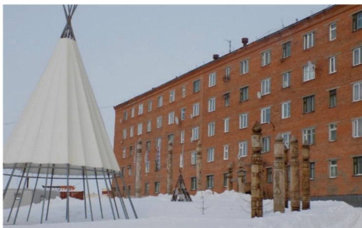
A Városi Folklórközpont épülete, előtte az őslakos nemzeti ségek parkja