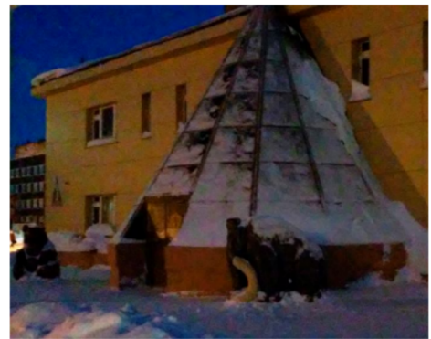
A Tajmiri Népművészetek Háza bejárata, sátor (csum) alakúra formált homlokzat, előtte medve és mamut szobrok

Az őslakos kisebbségi identitás vizuális megjelenése belső terekben Egy város nyelvi tájképéhez nem tartozik szorosan a belső terek vizsgálata, azonban Dugyinka esetében mégis fontosnak tartok rövid kitérőt tenni két belső tér rövid bemutatása erejéig. Azokat a belsőket fogom bemutatni, ahol