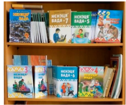
Nyelvi terem az „1-es” iskolában, nyenyec tankönyvek