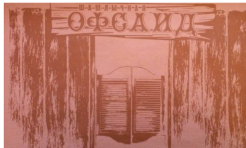
„Offside” ételbár cirill felirata