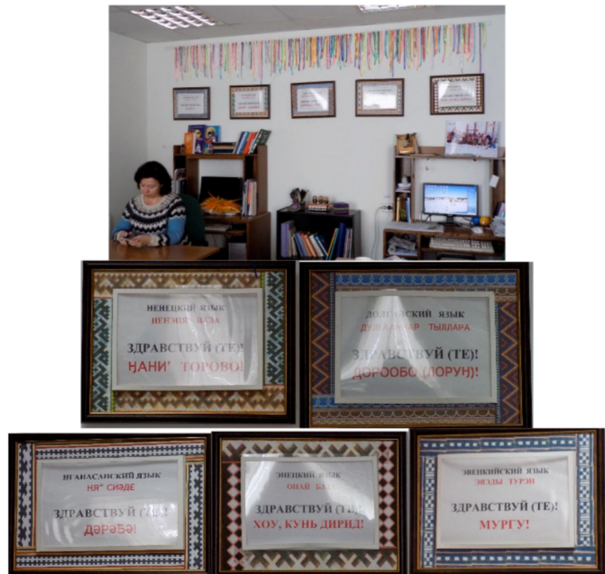
Kétnyelvű feliratok (orosz – nyenyec, dolgán, nganaszan, enyec és evenki) „A tajmiri népek etnikai kultúrája” kabinetben a Városi Folklorcentrumban

A Városi Folklorközpont néhány tábláját emelném ki mindezek közül. Ezekről a táblákról el kell mondani, hogy egyelőre az első kétnyelvű feliratok a városban. Fontos megemlíteni, hogy először a többségi nyelv (orosz), majd alatta a kisebbségi (őslakos) nyelvek szerepelnek rajta. A többségi nyelv feketével, a kisebbségi pirossal van írva. A táblákon az adott nyelv, alatta pedig az adott nyelven való üdvözlés szerepel. A feliratok szegélyei az adott etnikai közösség ornamentikájával vannak díszítve.