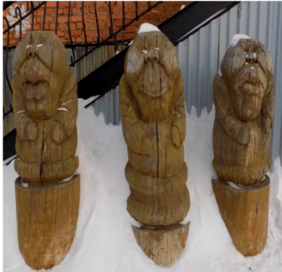
Életnagyságú fából készült bálványszobrok (a Gazdagság, a Szerencse és az Egészség) a Városi Folklorközpont előtt