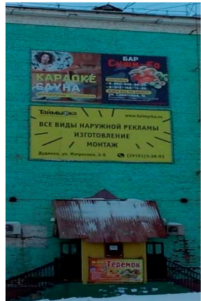
Karaoké, szauna, szusi bár - cirill reklámtáblák, a szusi bár neve F o, latin betűkkel