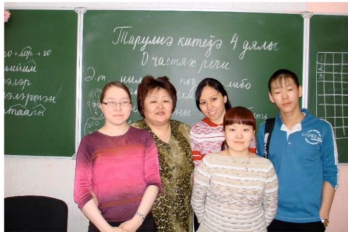
A szakközépiszkola nyelvi terme, a nganaszan óra (2008)

Ahogy már fentebb megtudhattuk, az iskolákban nem folyik kétnyelvű oktatás, csak heti pár óraszámban tanítják az őslakos kisebbségi nyelvek némelyikét. A tanulóknak van lehetőségük nyenyec, dolgán, nganaszan és evenki nyelvet tanulni, nyenyecet nem oktatnak egy iskolában sem. Az „1-es” iskolában nyenyecül, a szakközépiszkolában nganaszanul tanulnak. Mindkét intézményben külön nyelvi teremben folyik az oktatás, az „1-es” iskolában iskolaelőkészítő felzárkóztató foglalkozást is tartanak a falvakból érkezett különböző képességű és nyelvi tudású gyerekek tudásának összehangolására. Ezek az előkészítő foglalkozások kis csoportban, egyénre szabottan, nyenyecül folynak.