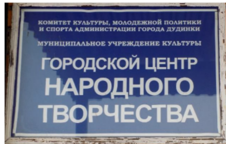
A városi Folklor Központ táblája

Még azon intézmények táblája is kizárólagosan orosz nyelvű, ahol a nemzetiségi oktatás folyik, ahol jelen van a művészet, a népművészet, ahol az őshonos kisebbségek képviselői dolgoznak. A reklámformulák, a város utcáit behálózó szlogenek, feliratok is kizárólagosan többségi orosz nyelven jelennek meg.