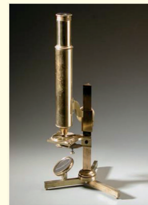
Pest, XVIII. sz. vége vagy XIX. sz. eleje