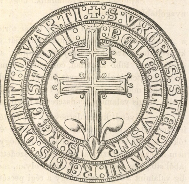
1. ábra. b)

fogva szükségesnek véltük a káptalan 2. sz. a. pecsétjét, mely a Görgey-levéltárban III. Endre király korából való több okmányon látható, pontosabb rajzban adni, körirata ez: † S CAPITVLI ECLESE BEATI MARTINI DE SCEPVS. A 3-ik szám alatti a szepesi káptalannak első ismeretes pecsétjét ábrázolja, mely akkor, midőn IV. László király alatt