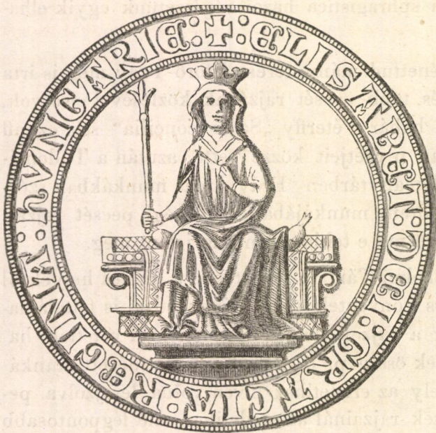
1. ábra. a)

A 2-ik és 3-ik számúak a szepesi káptalan pecségei; Jerney a Történelmi Tár II. kötetében a 2-ik szám alattihoz hasonló rajzot tesz közzé; azonban 1540. évről; ennél