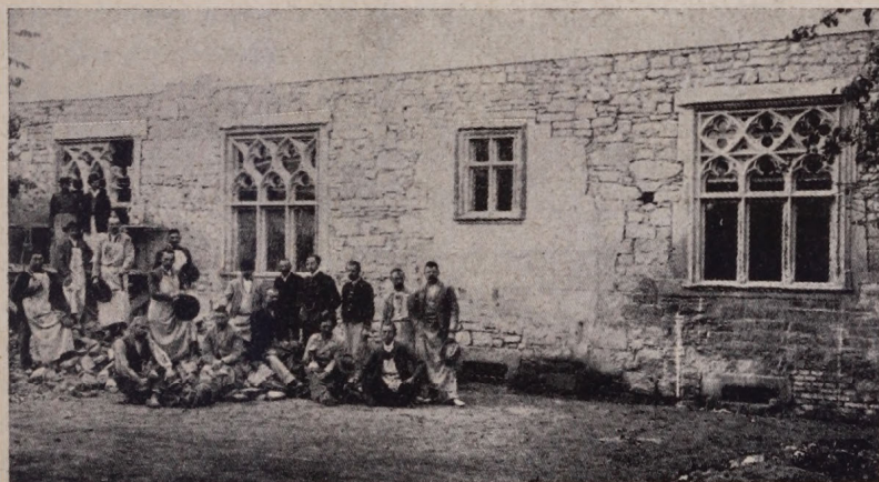
2. ábra. Az északi homlokzat részlete a refektórium ablakaival. Die nördliche Stirnseite mit den Fenstern des Refektoriums.

szárnyában, a mai bejárat helyén levő kisebb ajtó jutott szerephez. A nyugati épületszárny (1. ábra.) úgy látszik csak a keresztfolyosó nyugati szakaszát, emeletén pedig csak famennyezettel borított folyosót rejtett magában, mely összeköttetést nyújtott a kolostor északi szárnya és a templom zenekórusa között.