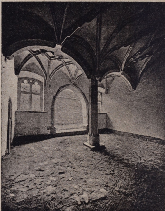
4. ábra. A fogadócsarnok belseje északnyugatról.

fallal épült. Ebből szellőző kürtő vezet ki a refektórium kéményéig. Előteréből újabbkeletű nyíláson át csatornába juthatunk, mely a középső udvar esővizét vezette a külső nyelőkútba.