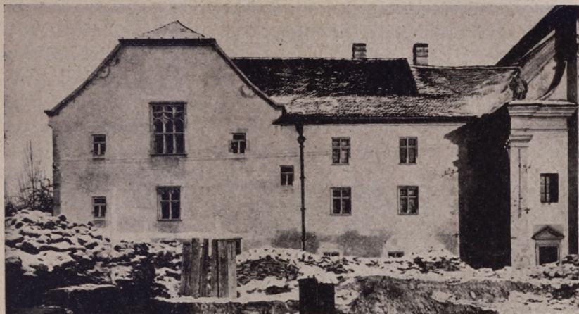
1. ábra. Nyugati homlokzat. Westliche Stirnseite.