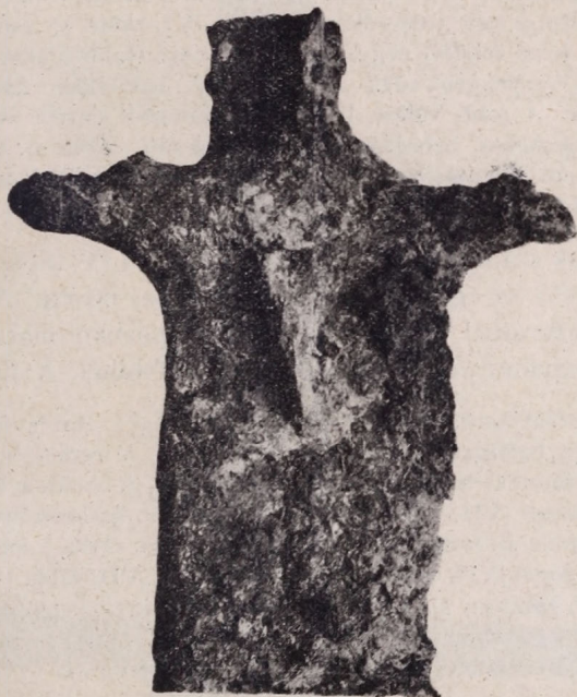
1 a ábra.

egyéb leletek mellett még egy-egy szablya is találtatott. E szab- lyák — amennyire az eddigiekből megállapítható — a rokon- jellegű csunyi sírmező 54. sz. sírjában talált szablyával együtt a magyarországi népvándorláskori szablyák közt egész különleges helyet foglalnak el s így népvándorláskorunk problémáinak tanul- mányozásánál több tekintetben támpontul szolgálhatnak.