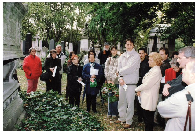
3. ábra | A Klinika munkatársai Semmelweis Ignác szarkofágjánál, a Fiumei úti sírkertben (2004. szeptember 25.)