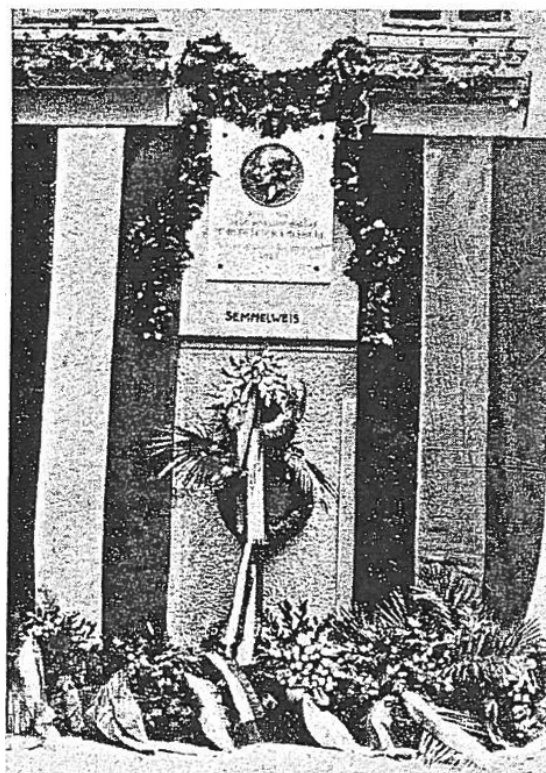
3. ábra | A Rókus Kórház emléktáblája