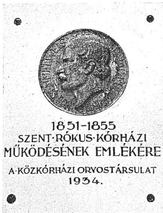
4. ábra | Az emléktábla szövege

ülésen Manninger Vilmos már be is mutatja a Semmelweis-plakett mintáját. Az érem 1921-ben készült el (2. ábra).