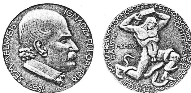
2. ábra | A Semmelweis-emlékérem