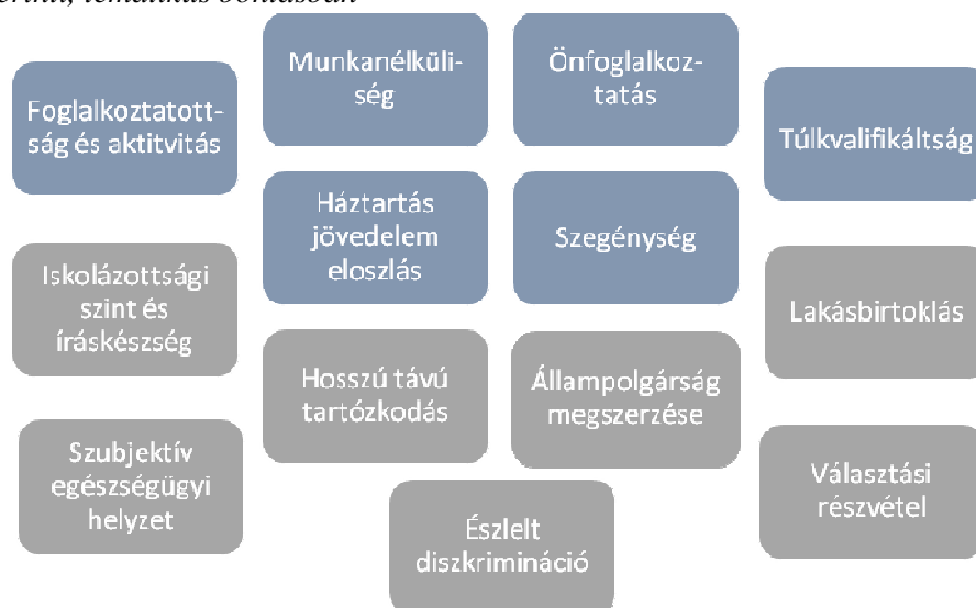
2. ábra: A Zaragoza indikátorok az Indicators of Immigrant Integration (2015) szerinti, tematikus bontásban

A kutatómunka ezen pontján a tanulmány elsődleges kérdésére („Hogyan mérhető a társadalmi integráció?”) az indikátorok fellelésével lényegében választ nyertünk, és az eszközt, amivel a társadalmi integráció elviekben mérhető, megtaláltuk. Ami azonban a mutatók részletes tanulmányozásával feltűnt, az magával hozott egy a bevezetésben tárgyalt fő kérdőjel helyére illeszkedő másik kérdőjelet, és egy egészen új irányt adott a kutatómunkának.