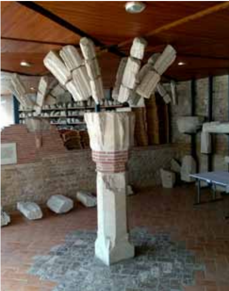
24. kép A lovagterem középpillére a kortárs kőtár épületben eredeti helyzetben, de téri adottságaival nem számoló magasságban elhelyezett födémrel, melyen ugyanakkor megmutatkozik a valószínűsíthető boltozati rendszer rajzolata