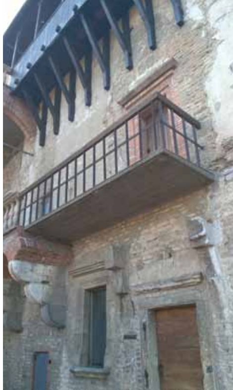
4. kép A várudvar déli falán „kartásan” továbbvezetett loggia-lemez