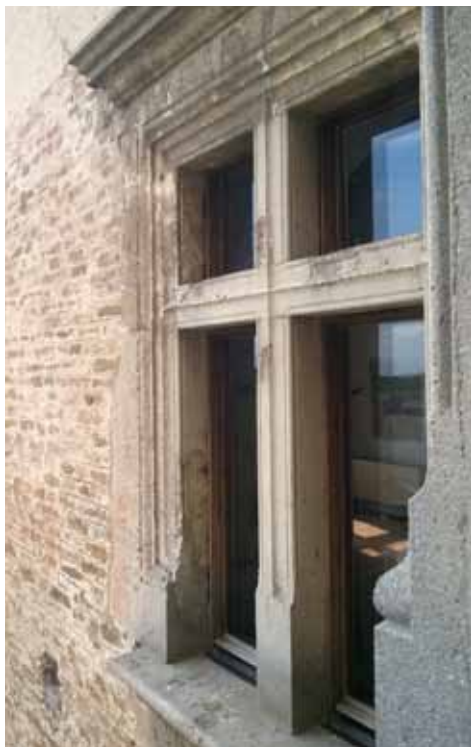
5. kép Reneszánsz kőkeresztes ablak – eredeti vagy kiegészített?

utaló szemöldökös ajtó (6. kép), a nyílásba illesztett üvegfelületbe ültetett acél-fa konstrukció (7. ábra). A keleti szárny esetében a falomládékban megtalált töredékekből hitelesen rekonstruálható kőkeresztes ablakok, míg az öregtorony esetében azoknak faragott téglából való megépítése volt az elv 6 (8. kép). A keleti szárny külső oldali homlokzatrajza a leginkább teljességében rekonstruált reneszánsz palotahomlokzatunk (egyike), melynek fennmaradását a 19. században eléje épített magas fél nyeregtetős lakóháznak köszönheti (9. ábra). Ugyanezen szárny belső, udvari oldala a gazdasági használat miatt leginkább átalakult változatból mértékletességgel (ritmusos, az egykori belső szobaegységekhez logikusan illesztett, és falstruktúrából bizonyítható helyen rögzített) kiépítésével azonban inkább a megidéző formamegidézést választja (10. kép). Az épületegyüttes két egymástól távoli pontjában érhető tetten a fel-tárásból megismerhetőre alapozó bemutató metódus két végpontja: míg a kaputorony kapuzatának kőkerete a később ráarakódott rétegek alól kibontva, helyben tartva ma is emelő-hidas formáját jeleníti meg a déli oldal a múzeum főbejáratát alkotva (11. kép), addig az északi szárny