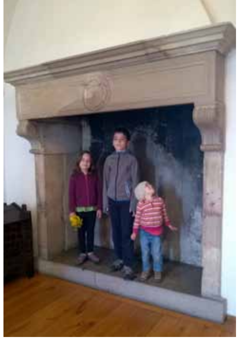
23. kép „In-situ” (?) kandalló