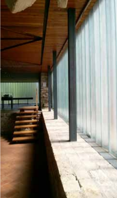
26. kép Precíz részletképzés, gondos kivitelezéssel