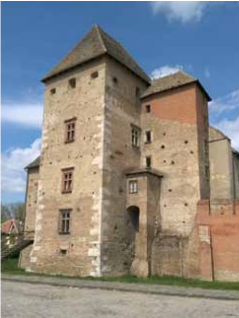
8. kép A déli öregtorony, mellette a kiegészített lépcsőtorny, mögötte takarásban a kaputorony