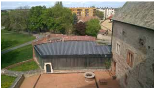
16. kép Vállaltan mai és őszinte – az elpusztult északi szárny helyén létrehozott egyszintes kőtár-épület