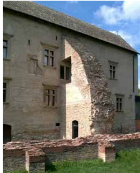
9. kép A körítő védmű idején épült falerosítás, mely a keleti palotaszárny ritmusos reneszánsz ablakosrába belevág, de feltűnnek a gótikus kettős ablakok is