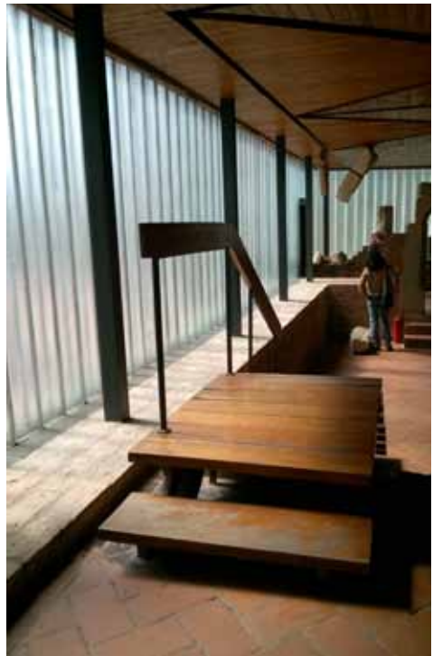
25. kép Síkváltások skandináv minőségű részleteképzéssel