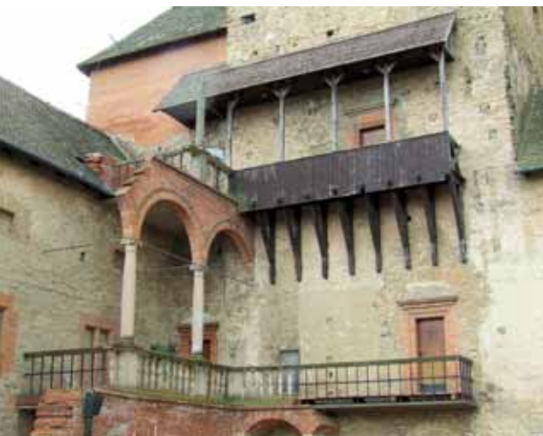
3. kép A belső udvari loggia-rekonstrukció a délkeleti sarokban