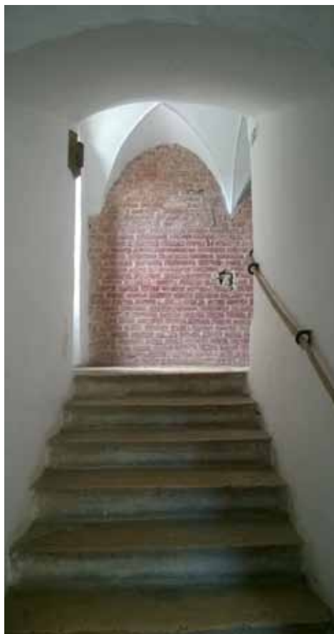
21. kép Új és régi felületek vakolt és vakolatlan képi megjelenése