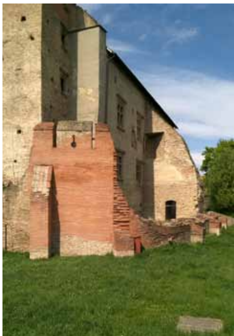
19. kép Lőréses pártázatos „bemutatása” a körítő védmű-falnak látványosan újszerű anyaghasználattal.

(13. kép). Azonban mindebből a kötőrédek sokaságán túl semmi sem maradt – így e helyütt Horler a „nemzetközi standard” szellemében kortárs épülettömeget tervezett. A múzeumi teret egyszintes, közties letámasztások nélküli, vázas szerkezetű könnyed épületként fogalmazta meg, mely az északi íves lezáró faltest magasítása mögé elbújik (14. kép), az udvar felől azonban teljes kortárs megjelenésével egyértelműen mutatja a meg nem mintázható történeti épület helyén maiságát. Ami e „beavatkozásokat illeti: az esztétikai vagy műszaki okból elkerülhetetlennek minősített mindennemű kiegészítés építészeti alkotásnak minősül, s mint ilyen, korának jegyeit kell magán viselnie.” A korszak építészeti felfogásában mindez tehát a '60-as évek végén a modern építészet formanyelvén materializálódott (14. kép). A vastag téglakörítő falakra acélváz támaszkodik, hogy az udvari oldalon a kopilit üveg mögött vékony hengerelt szelvényeivel az egykori falakra felülve hordozza a belsőépítészeti formálásában a boltozatmezők osztására utaló tagolású sík kialakítású fatáblás álmennyezetet (15. kép). A neutrális forma meggyőző ere-