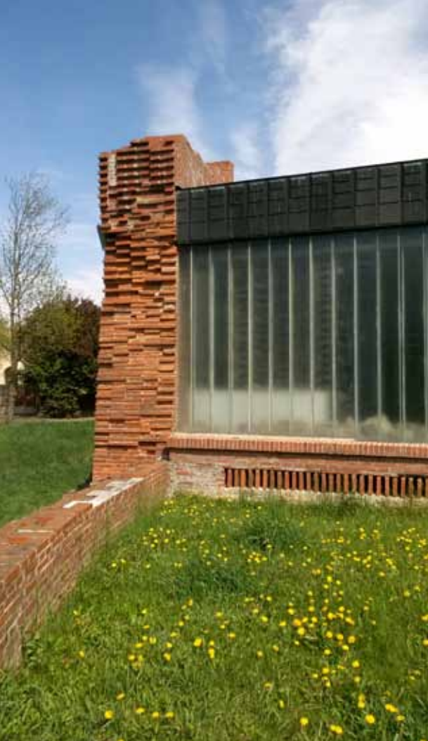
28. kép Mérnökien precíz szerkezeti részletek tárgyelemként parkrészletbe komponálva

nősséggel jelölt átmenetek adta torlódások, szűkszavú épületszerkezetek (24-28. kép).