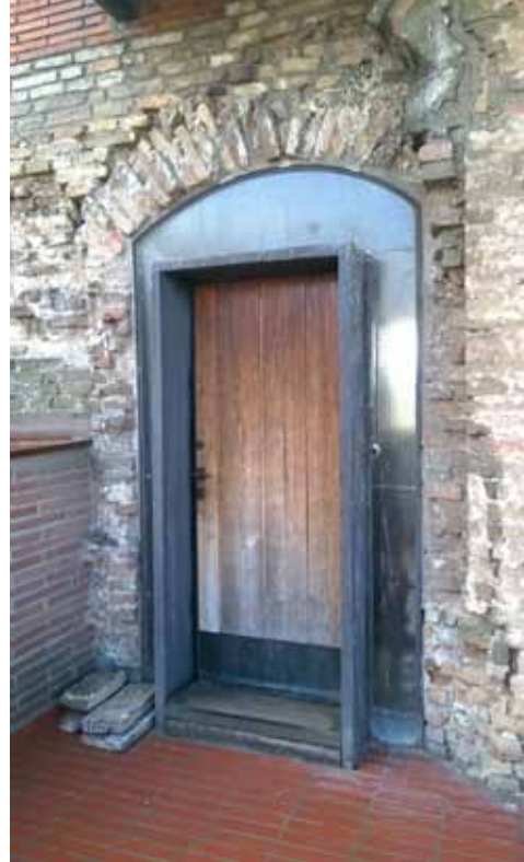
7. kép Nyílásban új ajtó – egyértelműen mai