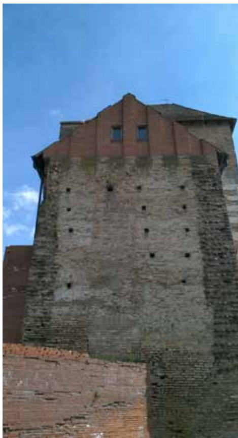
18. Kép A déli épületszárny oromzatos lezárása, utalással a nyugati falszakaszhoz csatlakozásra