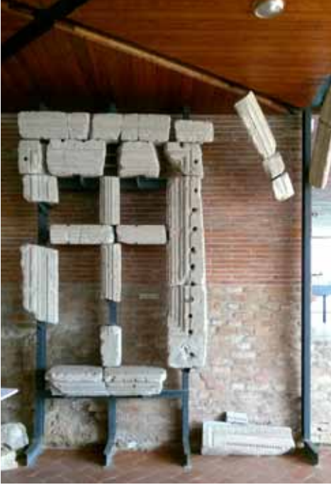
22. kép Korszerű muzeológiai bemutatás: kőtöredékekből ablak rekonstrukciója minimalista acél állványon