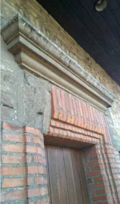
6. kép Didaktikus utalás faragott téglával