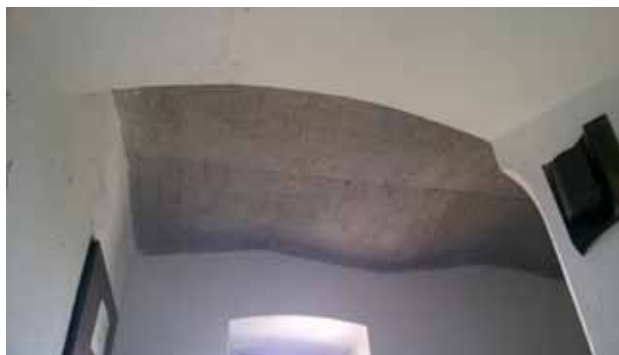
20. kép A továbbépített lépcsőtér nyers vasbeton födeme

(13. kép). Azonban mindebből a kötőrédek sokaságán túl semmi sem maradt – így e helyütt Horler a „nemzetközi standard” szellemében kortárs épülettömeget tervezett. A múzeumi teret egyszintes, közties letámasztások nélküli, vázas szerkezetű könnyed épületként fogalmazta meg, mely az északi íves lezáró faltest magasítása mögé elbújik (14. kép), az udvar felől azonban teljes kortárs megjelenésével egyértelműen mutatja a meg nem mintázható történeti épület helyén maiságát. Ami e „beavatkozásokat illeti: az esztétikai vagy műszaki okból elkerülhetetlennek minősített mindennemű kiegészítés építészeti alkotásnak minősül, s mint ilyen, korának jegyeit kell magán viselnie.” A korszak építészeti felfogásában mindez tehát a '60-as évek végén a modern építészet formanyelvén materializálódott (14. kép). A vastag téglakörítő falakra acélváz támaszkodik, hogy az udvari oldalon a kopilit üveg mögött vékony hengerelt szelvényeivel az egykori falakra felülve hordozza a belsőépítészeti formálásában a boltozatmezők osztására utaló tagolású sík kialakítású fatáblás álmennyezetet (15. kép). A neutrális forma meggyőző ere-