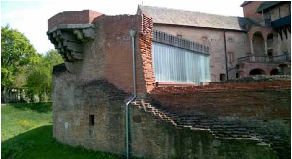
14. kép Az északi szárny helyén létrehozott emeleti zárterkély-jelölés, falmagassítás és a mögé elbúvó korszerű kőtár