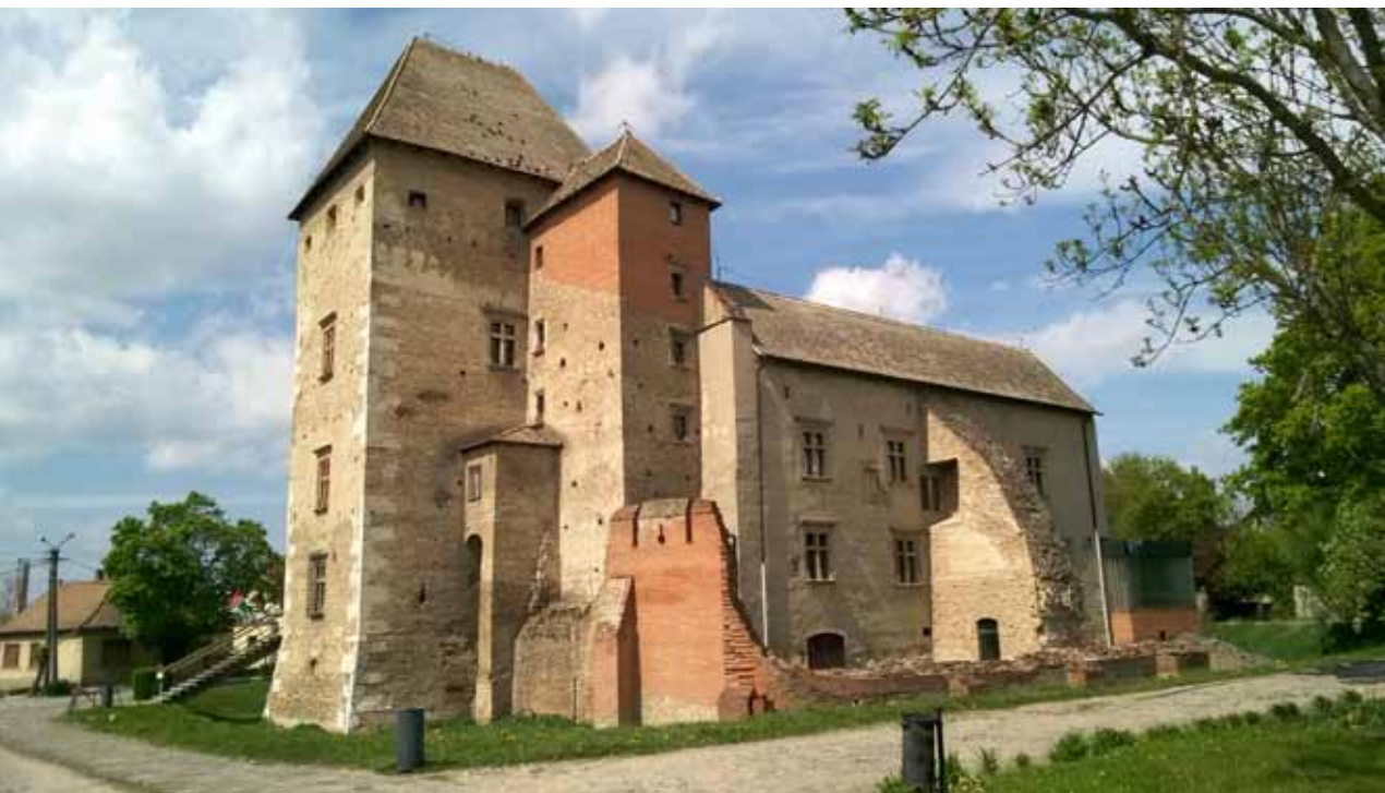
2. kép A vár „talált képe” délkelet felől

innentől vitték a beavatkozás fő irányvonalát: a legdominánsabb műforma létrejöttét a fennmaradt oszlop, bázis és ballusztrád-elemek adták, melyből az emeleti oszlop-ívezetes loggia két axisának megidézésével, „rekonstrukciójával” az elmesélhető történelem fő motívuma adottá vált. A csatlakozó szerkezetek-elemek, a bizonyosság szintjén a falak által őrzött lenyomatokból kiindulva csak a legszükségesebb mértékben, az értelmezhetőség határáig kerültek kiépítésre. Ami utána van, az a velencei karta hazai szellemisége örökítőjének örömjátéka. 5 A közel négyzetes udvar délkeleti sarkában minden lejátszódik, mely által „meg kell őriznie a műemlék kivételes jellegét a céllal, hogy konzerválja és feltárja annak esztétikai és történeti értékét. A régi állapot és a hiteles dokumentumok tiszteletben tartására támaszkodik, de megáll ott, ahol a hipotézis kezdődik” elvének megfelelően. A vasos pilléres árkád felett a könnyed reneszánsz ballusztrádos loggia mértániai íve szökell fel, de felette a bizonyíthatóan egykoron létező, de teljességgel meg nem ismerhető forma már töredé-