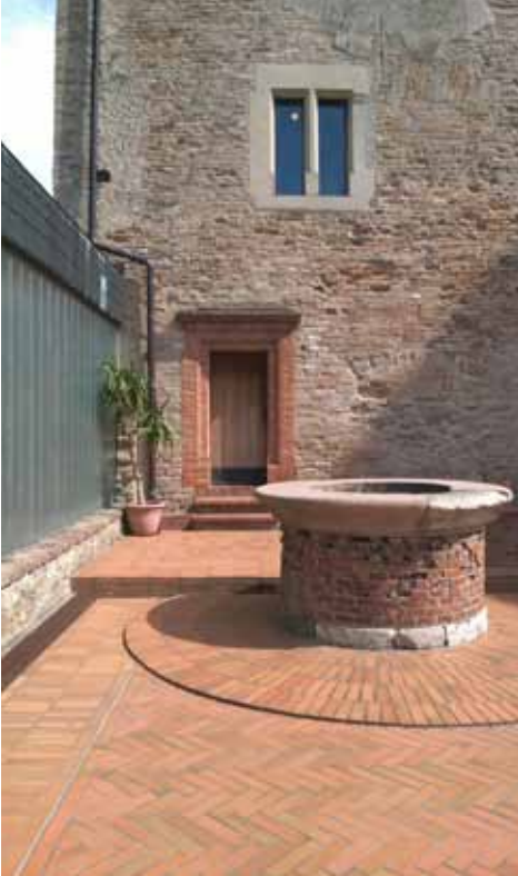
10. kép A keleti palotaszárny udvari homlokzata – szabad kompozíció