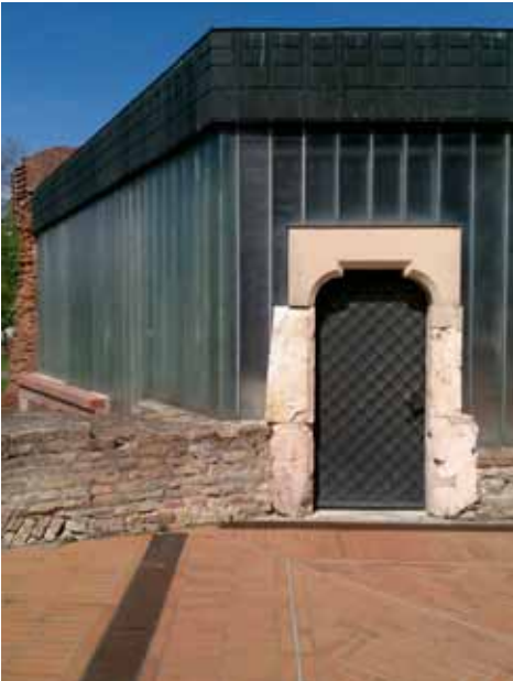
12. kép Kőtöredék és műkő részlete

udvari oldalán anastylosis jelleggel, szinte installációszerű bemutatása történik az üvegfalba illesztve a gótikus kapuzat-töredéknek, mely kopottas töredékeket látványos épségű műkö anyagú szemöldökök egészíti ki teljessé (12. kép).