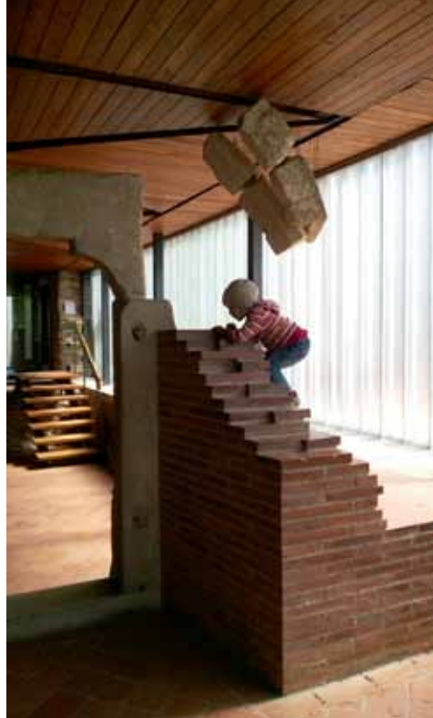
27. kép Kissé értelmezhetetlen viszony, de legalább élményszerűen használható installáció

je a várudvarban egyértelmű: a masszív tömör téglafalak plasztikus felületei mellett az üveg-palló homlokzat síkszerű és markánsan éteri felületszerűségével kortárs elem a kompozícióban (16. kép) Az egymásmellettség még szembetű-nőbb az egykori kápolna helyén: a részlegesen felfalazott vastag védműfal felett szinte ellebeg-ni látszik a kollázsszerű üveghártya alkotta kubusos elem (17. kép).