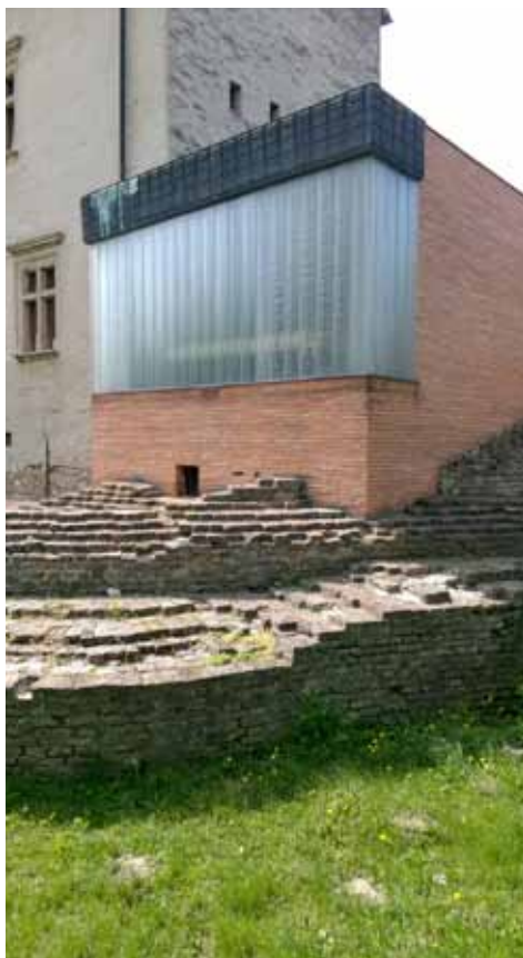
17. Kép Hártyszerű felületekkel alkotott kortárs kubus