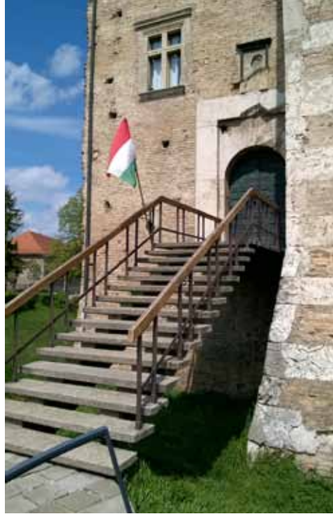
11. kép A lépcsőtorny „új” ablaka és a megnyitott egykori kapuhoz vezető, egykoron várárok felett „átlebegő vasbeton” híd, ami a mai terepviszonyok miatt könnyed lépcső