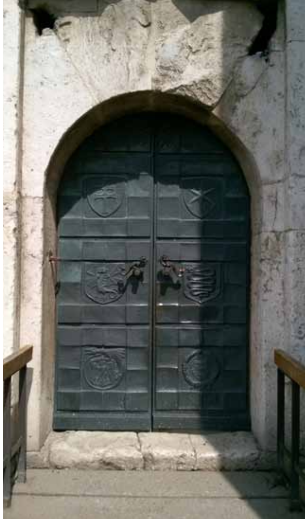
29. kép A bejárati kapu címerei a vár főbb építési periódusaira utalnak - a játékoság határán túl

Mínta egy kompozíció önkép-rajzolatának mesteri futamait látnánk – kicsit visszatérve a kritikai vonal két elemére: a nyílászárók játékosága a tervezőként járható utak sokszínűségét kívánja (még) felmutatni. Ne feledjük: a '64-es velencei karta után éppen csak néhány évvel járunk. A művészi ambíciózusság ugyanakkor szikár tartással merevedik a rég elpusztult északi épültre-szek esetében. De most, ma „visszanézve” e diverzifikalitást, tárul fel az alkotói nagyság. Didaktikus következetességű mérnök – érzékeny ihletettségű kompozitőr. Konstellációkból álmodat alkotó – realitásokból anyagiasan megvalósi-