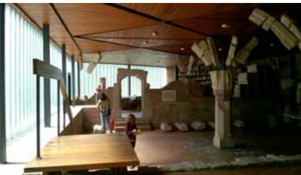
15. kép Átlátható installációs tér a lovagterem töredékes pillérének beillesztésével és boltzata rajzolatának megjelenítésével.