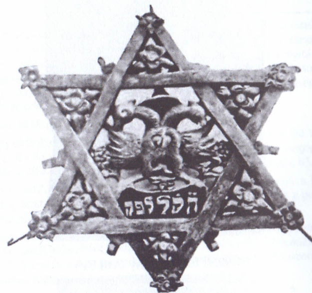
Galíciai tóradísz (OR-ZSE Könyvtára)