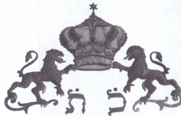
Korona és oroslánok a Szendrői-család parochetjén, 1902 (SZZSH)