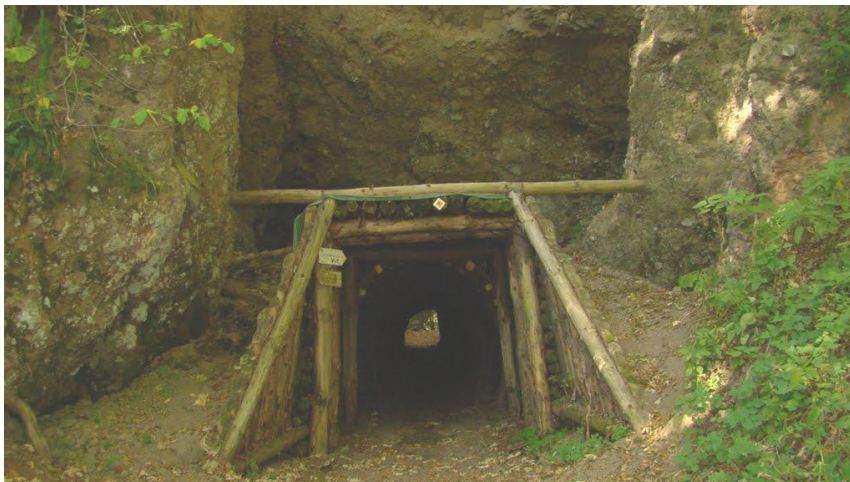
4. számú ábra. A „Görgey alagút”, amelyen keresztül magyar csapatok – az Aulich-hadosztály – erői vonultak át

zott készleteket, és egyesülni tudtak Görgey főserégével. Az alagút ma Görgey Artúr tábarnak nevét viseli.