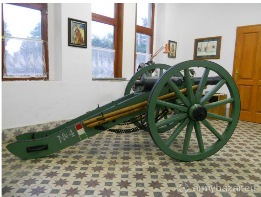
3. számú ábra. 3 fontos ágyú az 1848-as szabadságharcból

Habár – a kezdeti elképzelések szerint – Görgeyt tették volna meg a gyár igazgatójává, de azután katonai tapasztalatai miatt inkább a harcoló alakulatokhoz osztották be. 1848 szeptemberétől csapatparancsnoki beosztásokat látott el, azonban Görgey későbbi pályafutása során is részt vett a fegyverzeti anyagellátás kérdéseinek szervezésében, irányításában. A budai vár bevétele után Görgey utasította a tábori lőszerraktár parancsnokát, hogy állítson fel tüzér számvevőséget 6 tüzértiszt vezetésével, két munkásszázad erővel. A szervezet feladata a lőszerellátás felügyelete, illetve a raktározás és az ellátás megszervezése volt. A parancs szerint a lőszerfőraktárnak Pesten kellett települnie. 21