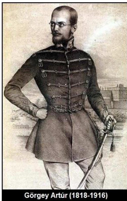
1. ábra. Korabeli rézkarc a tábornokról