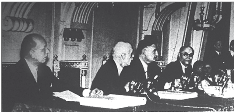
A közigazgatási továbbképző tanfolyam megnyitása a belügyi palotában, 1941-ben: vitéz Keresztes-Fischer Ferenc belügyminiszter megnyitóját mondja; mellette balra Zsindely Ferenc kereskedelmi miniszter, jobbra Bornemisza Géza iparügyi miniszter és Mártonffy Károly egyetemi tanár 16