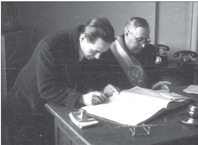
Budapest VIII. ker. Kerületi Tanács, Állami Anyakönyvvezetőség 1954-ben 18

a vezetői munkakörökben, valamint a képzési előírásokba is bekerült a szakmai végzettség mellett a politikai képzettség. 21