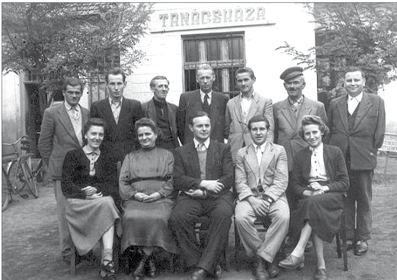
Újszász városi tanács dolgozói 1955-ben 22