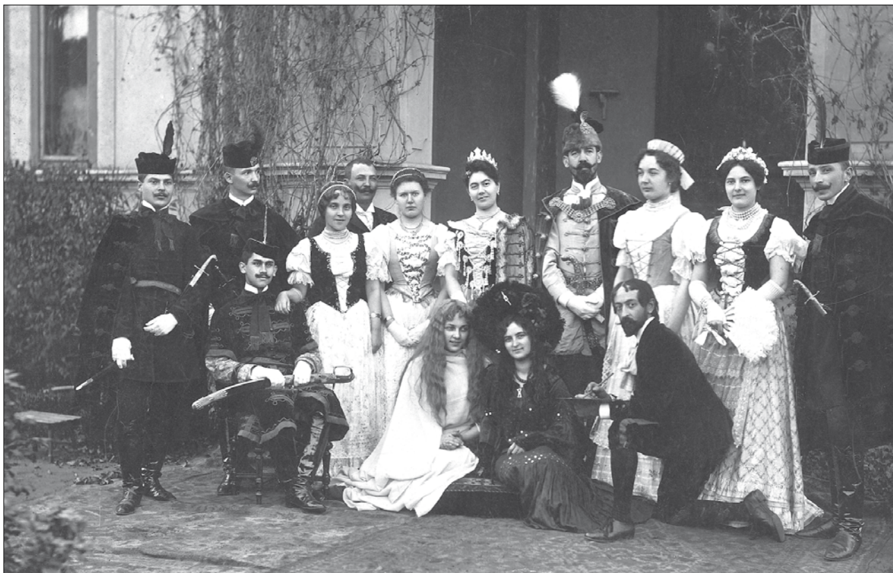
A dombóvári főszolgabírói hivatal alkalmazottai és hozzátartozói az épület bejáratánál 1904-ben 5

Ebben az időszakban egyrészt az egységes jog- és államtudományi képzés, másrészt a jegyzőképzés párhuzama figyelhető meg. Előbbi keretében szerzett végzettség mint a községi alkalmazás feltétele jelent meg az 1883:I. tc.-ben, a községi jegyzők számára pedig az érettségi vizsga mellett a négy féléves közigazgatási jegyzőképző tanfolyam került előírásra. A feltételeket más törvények és rendeletek is kiegészítették, hiszen akkoriban a közhivatalnokok szolgálati jogviszonyát nem kodifikálták egységesen, nem beszélhetünk egységes községi szolgálati pragmatikáról.