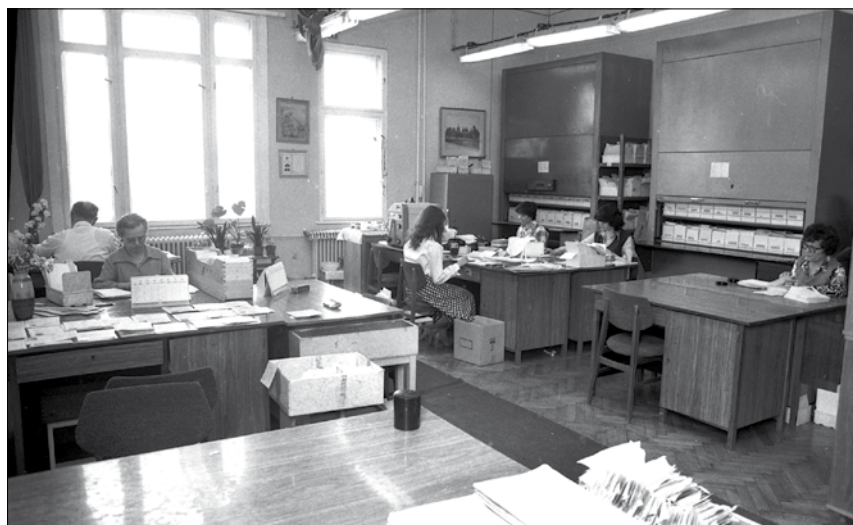
Budapest VI. kerület, a Belügyminisztérium Külföldieket Ellenőrző Országos Hivatala 1980-ban 25

A második világháború után először a 25/1977. (VII. 9.) MT rendeletben szerepeltek mind vezető, mind ügyintéző állásúakra követelmények, ugyanakkor megdöbbenő, hogy ezek a központi szerveknél alacsonyabbak voltak, mint a helyi szerveknél. 23 A közigazgatás saját oktatási rendszerének kiépítési szándéka is ebben az időszakban jelent meg: a közgazdasági szakközépiskolákban igazgatási és ügyviteli tagozatok, a gimnáziumokban igazgatási fakultáció és a tanácsakadémiák jöttek létre, valamint a képzési időtartamok is megnöttek. A közigazgatási személyzeti politika új szakaszát azonban az 1978-ban működését megkezdő Államigazgatási Főiskola létrejötte jelentette, hiszen innentől jelenik meg nagy számban a kifeje-