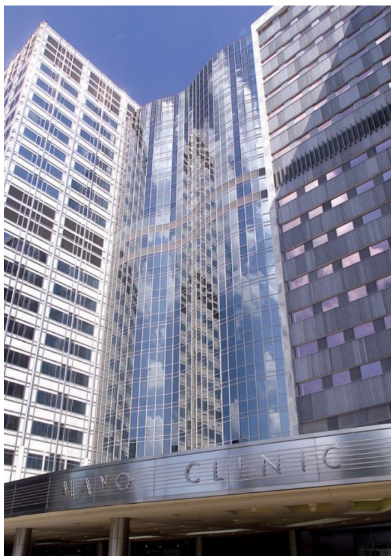
5. ábra | A Gonda Lászlóval elnevezett épület a Mayo Klinika fénypontja