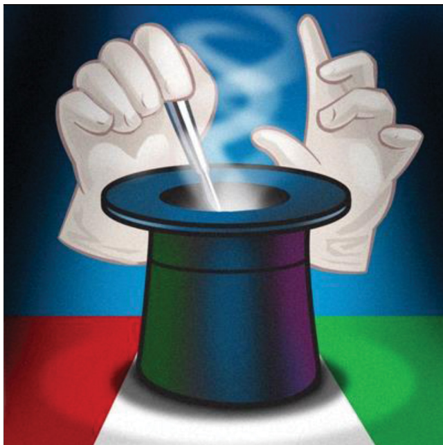
3. ábra Mayo klinikai Gloviczki-ajtókártya: olyan kórtermek ajtajára tettek ki, amelyekben az illető beteget feküdték. A kesztyűs kezek egy szikével a sebészt jelzik, a cylinder a bűvészt, a piros-fehér-zöld pedig a magyar színek

Mayo klinikai konzultánsként megilletett egy „ajtókártya”, amit az olyan kórtermek ajtajára tettek ki, amelyekben betegem feküdt. Ez a „door card” beszédes: a kesztyűs kezek egy szikével azt mutatják, hogy sebész vagyok, a cylinder jelzi a hobbimat, hogy bűvész is vagyok, a piros-fehér-zöld színek pedig arra utalnak, hogy magyar vagyok (3. ábra).