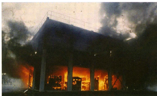
BHP TESZTÉPÜLET TŰZTESZTJE

A BHP Research Melbourne Laboratóriumban a célra elkészített épületben végeztek el a tesztek. Ez egy tipikus szintmagasságú 12 m x 12 m területű sarokrészt szimulálta az épületnek. A tesztépületet egy tipikus irodai környezetnek megfelelően bebútorozták, egy 4 m x 4 m nagyságú irodát alakítottak ki az épület kerületével szomszédosan. Az irodát gipszkarton fal, egy ajtó, ablakok és az épület homlokzata határolta. A hasznos terhet vízirtályokkal biztosították.