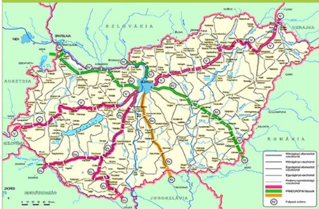
3. ábra: Az V. páneurópai szakasz magyar részei

Mohács–Belgrád–Siliistra–Konstanca–Galat–Izmail