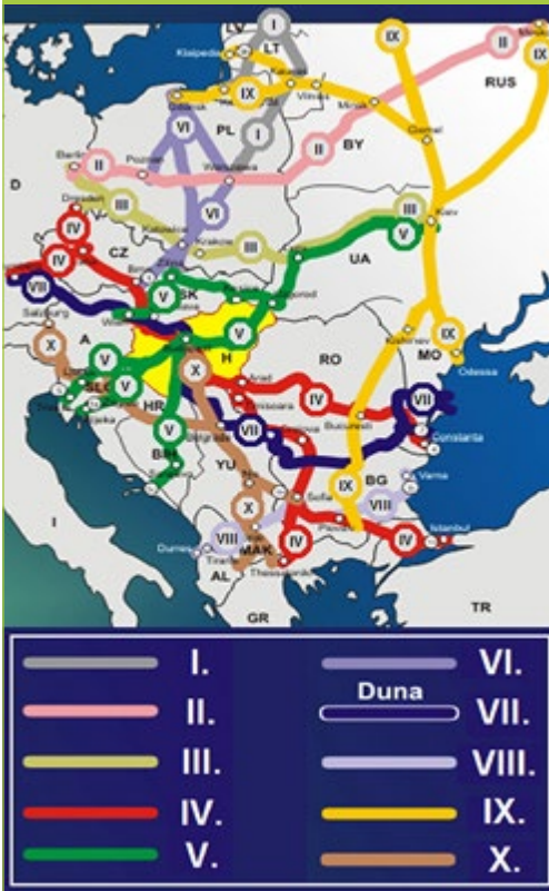
1. ábra: Páneurpai közlekedési folyosók

VIII. Durrës–Tirana–Szkopje–Bitola–Szófia–Plovdiv–Dimitrovgrad–Burgasz–Várna