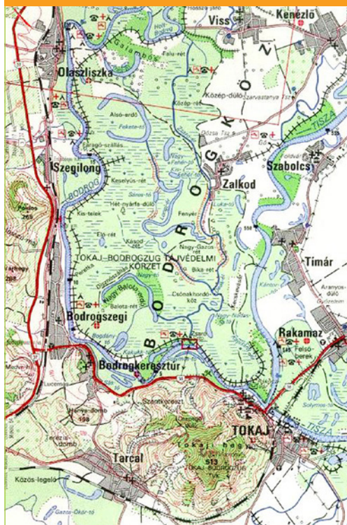
4. ábra: A Tokaj–Rakamaz városok közötti vasúti és közúti vonalszakaszok

Az ütemes, a forgalmat vágányzárakkal a legkevesebb mértékben zavaró kivitelezést az ártéri hidak, valamint a töltések elhagyásával lehet elérni. Helyettük a kétvágányú völgyhíd megépítése jelent korszerű és időtálló megoldást. A tervezett egyvágányú ártéri megoldás a