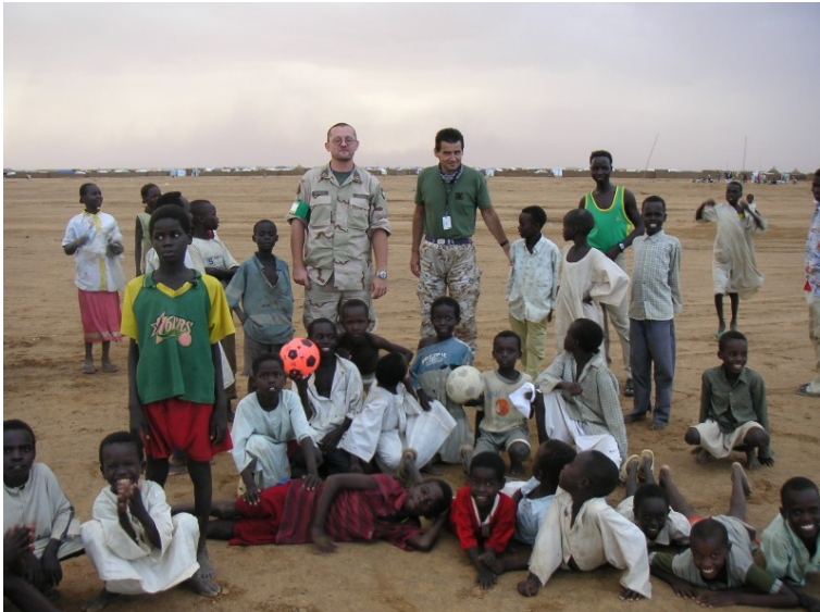
Menekülttábor (Abu Shak)