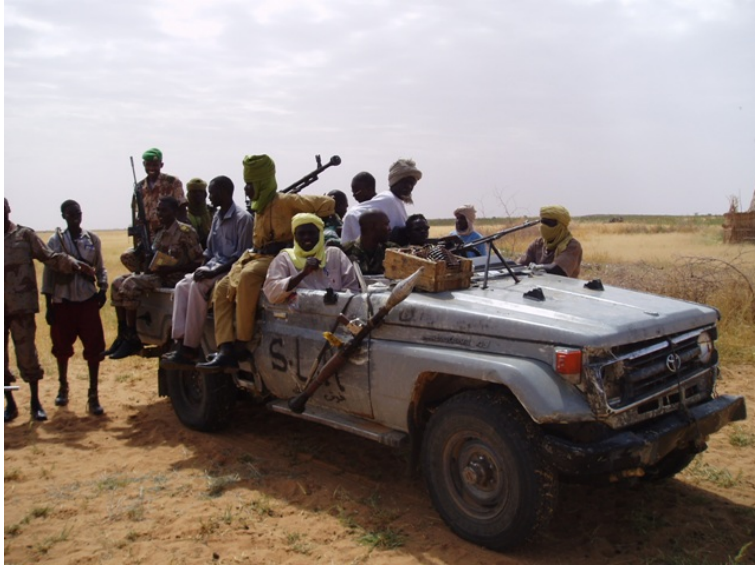
Lázadók (Jebel Mara)