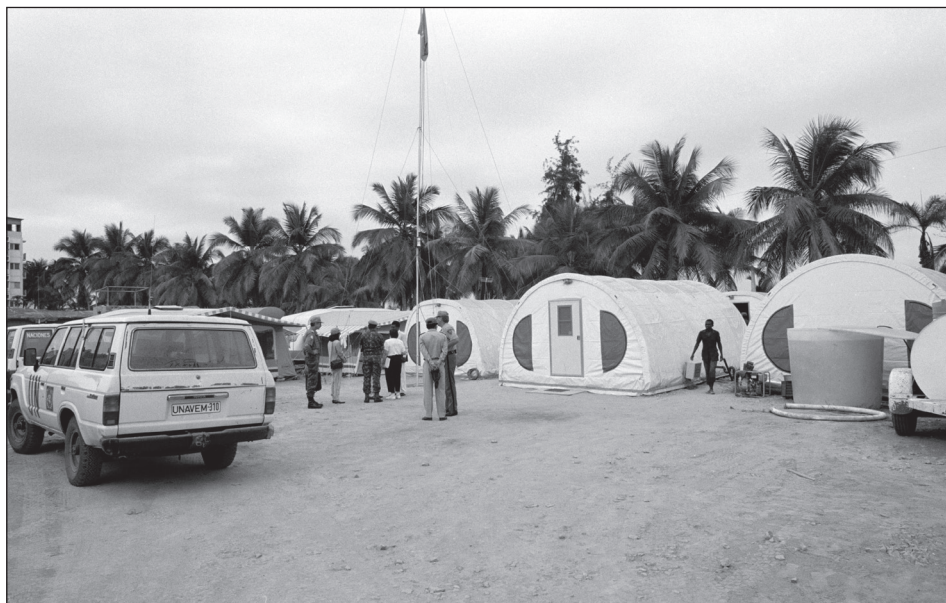
UNAVEM II-bázis, Sumbe, Angola.

tuszi népcsoportok közötti ellentétek miatt. 1959-ben a hatalmon lévő kormányt katonai puccsal megdöntötték, melynek következtében több tuszinak el kellett menekülnie az országból. Az 1973-as puccs idején hasonló események történtek. A menekültek többsége Ugandába ment, ahol az 1980-as évek végén megalapították a Ruandai Hazafias Frontot (RPF), amelynek fegyveresei 1990 októberében a határt átlépve több támadást hajtottak végre ruandai (hutu) célpontok ellen. A következő évben a környező államok közvetítésével több tűzszüneti megállapodást kötöttek a szembenálló felek, de azokat minden alkalommal megszegték, így a harcok tovább folytatódtak. Egy újabb megállapodás nyomán az Afrikai Egységsszervezet (OAU) és Tanzánia 1992. július 22-én létrehozta egy 50 fős katonai megfigyelő csoportot