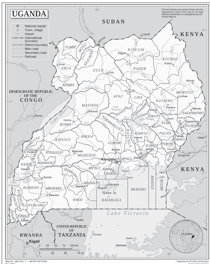
Uganda.