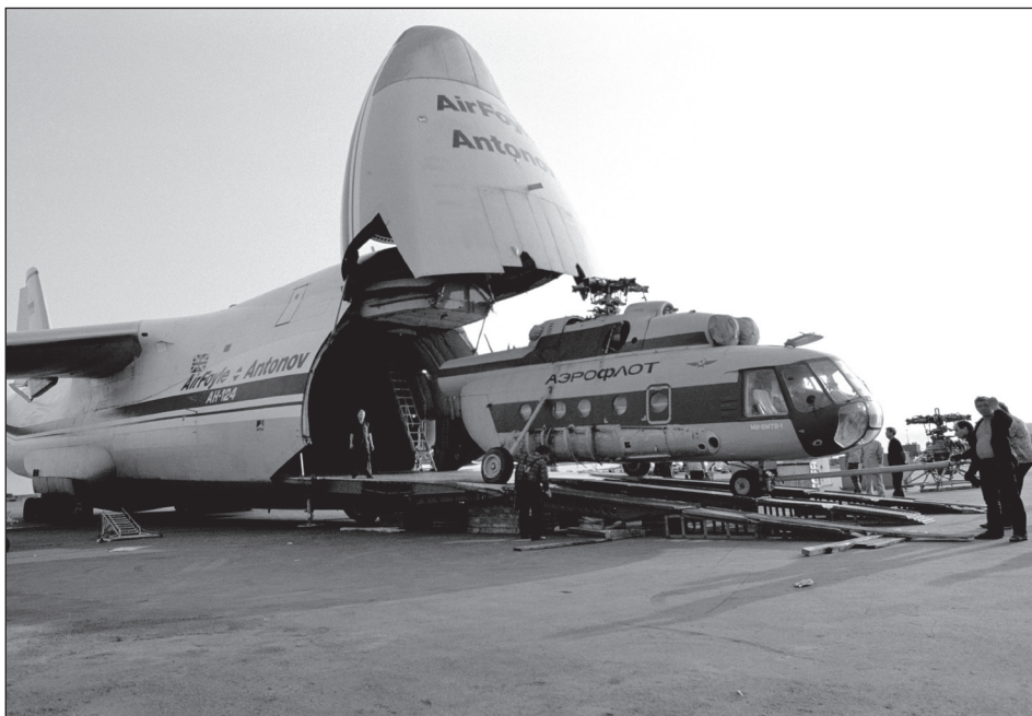
Az UNAVEM II választási megfigyelőinek utazását elősegítő helikopter érkezik Luandába.