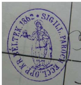
14. A krasznabélteki plébánia bélyegzőjének lenyomata, 1862