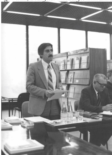
Előadás Miskolcon (1985)