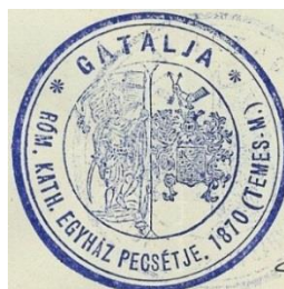
18. A gátaljai plébánia bélyegzőjének tuslenyomata, 1910