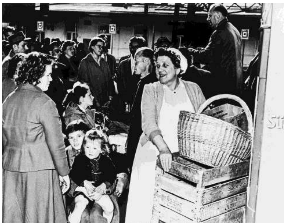
A menekültek családtagjaikkal a salzburgi vasútállomáson várják azt a vonatot, ami Svédországba viszi őket.

Az Európán belüli vagy a tengeren túli országokba való továbbtelepülés sok magyar számára tartós megoldást hozott. Svédország több tbc-vel fertőzött, kórházi ellátást igénylő menekültet fogadott be, mint bármelyik ország a világon. A speciális orvosi kezelésnek és rehabilitációnak köszönhetően többségük később önellátóvá válhatott.