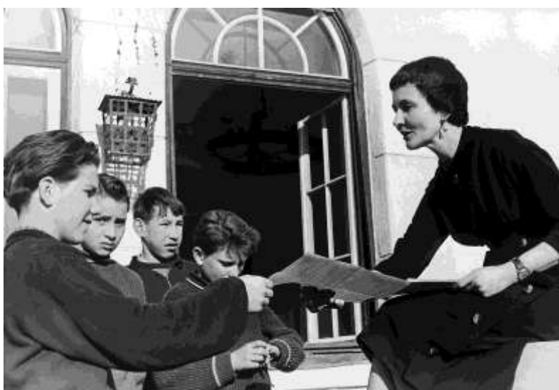
Magyar menekült gyermekek várják izgatottan a bizonyítványosztást második ausztriai tanévük végén.