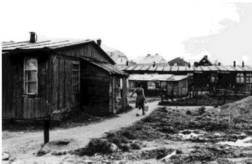
A vizet közös kutakból kellett venni és vödörben hazacipelni.