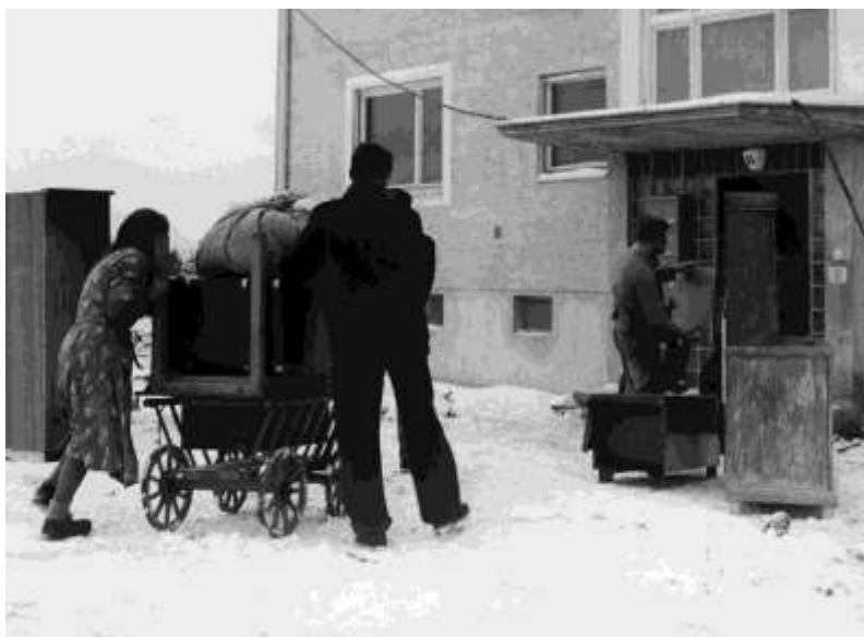
Egy ifjú menekült pár költözteti ingóságait új lakótelepi lakásba.