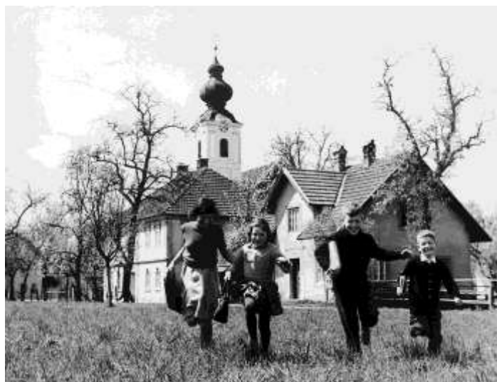
Menekült gyermekek szaladnak haza az iskolából. A fiatal menekültek számára volt legkevésbé nehéz a beilleszkedés és a nyelv megtanulása.