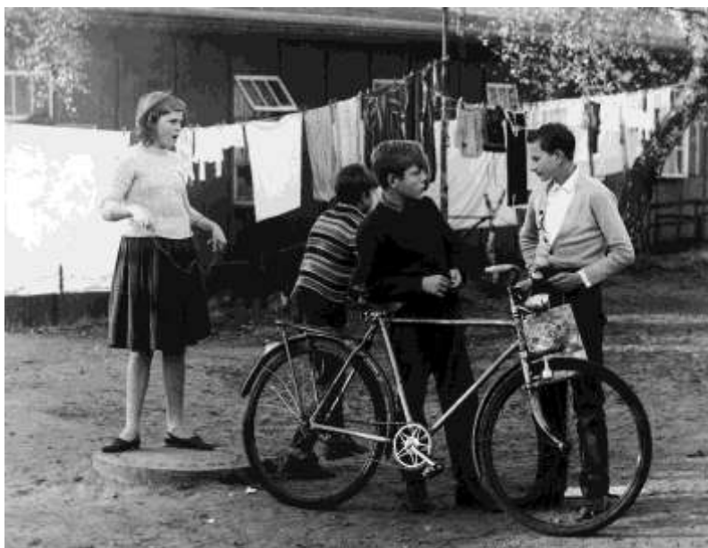
A menekült tizenévesek élete a menekülttáborokban nem sokban különbözött a szegényebb környékről származó osztrák társaikétól.