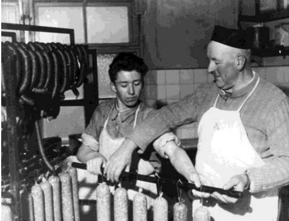
A szalámikészítés nem nehéz feladat a magyar menekültek számára.