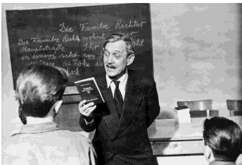
Németóra. A nyelv megtanulása fontos szakasz a fiatal menekültek életében. Felkészíti őket az új országban való életre.