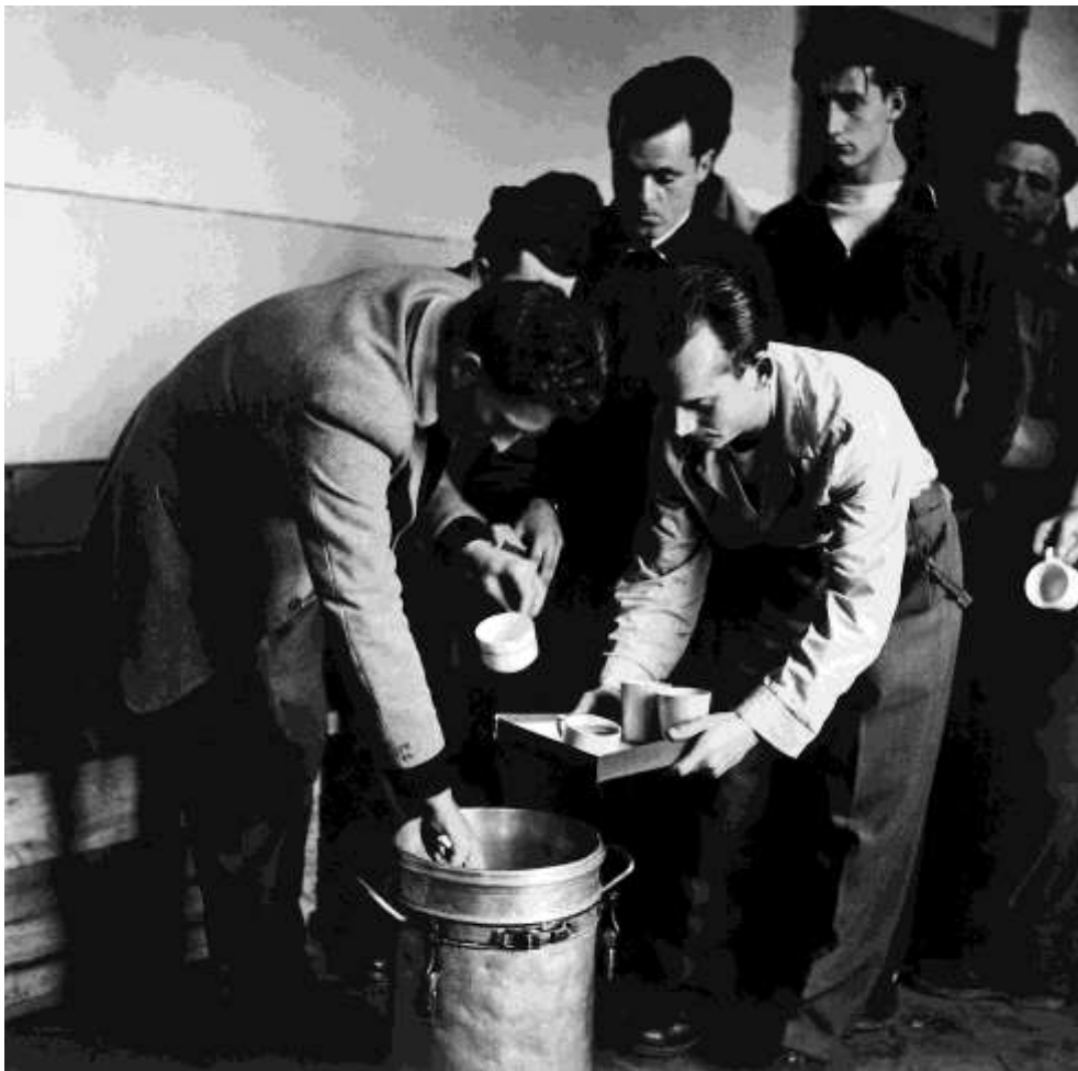
Ez a kép a traiskircheni táborban készült, Bécs mellett, ahol osztrák önkéntesek innivalót osztanak a menekülteknek..

A magyarországi válság kezdetétől a fénykép készítésének időpontjáig körülbelül 125 ezer magyar kapott menedéket Ausztriában. Legtöbben csomag nélkül, fizikailag kimerült állapotban érkeztek. Azonnali gondoskodásra, ruhára és élelemre volt szükségük, míg végül továbbtelepülhettek más országokba.