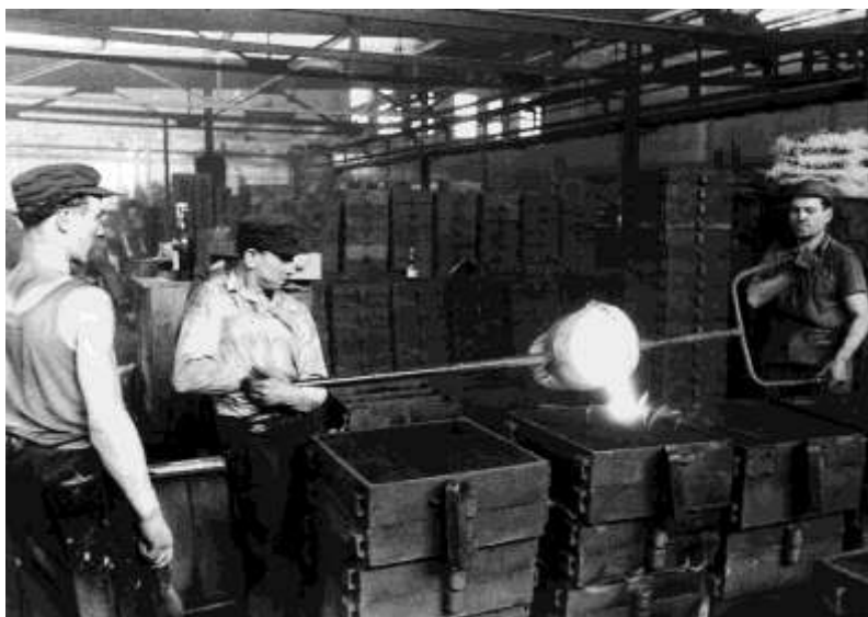
Sok menekült talált munkát Ausztria fejlődő acéliparában, különösen Linz városában.