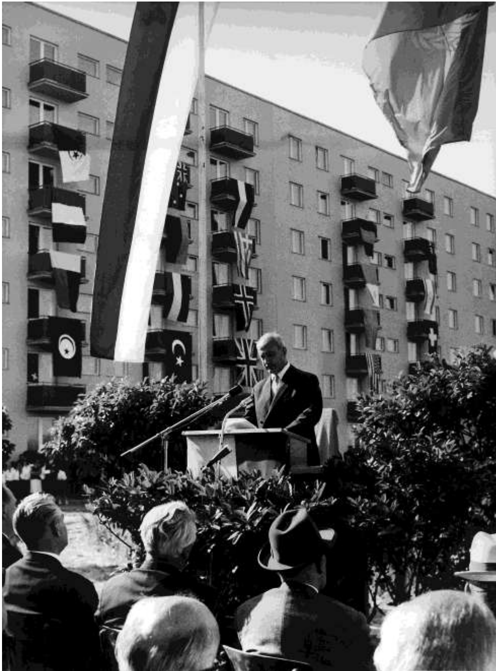
Felix Schnyder, az ENSZ menekültügyi főbiztosa felavatja az utolsó házépítési projektet Ausztriában 1964 tavaszán.