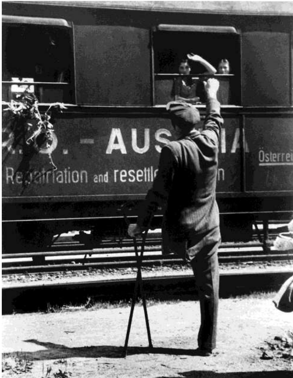
Ez a féllábú férfi is reménykedett, hogy egy másik országban újramezheti az életét. A menekültekkel teli vonat azonban nélküle indult el az állomásról.