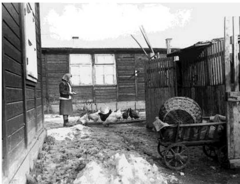
A vidékről érkezett magyar menekültek gyakran az új körülmények között is folytatták korábbi életformájukat.