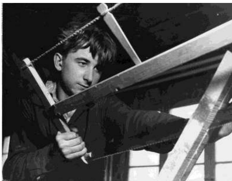
Szakmai oktatás Ausztriában ifjú menekülteknek, így segítve áttelepülésüket vagy a befogadó országban való beilleszkedésüket.