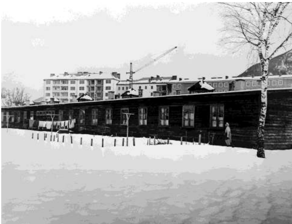
A régi tábor még mindig használatban van, de az építkezés már megkezdődött a háttérben.

Tizenöt évvel a háború után sem az osztrákok, sem a magyar menekültek számára nem volt könnyű megfizethető lakáslehetőséget biztosítani. Az osztrák kormány, nagyrészt az ENSZ Menekültügyi Főbiztosság pénzén, több tízezer új lakást és családi házat építtetett a menekültek részére. A menekülttáborok öreg faházait lebontották, amint a menekültek kiköltöztek. A menekülttáborok felszámolása a hatvanas évek közepén fejeződött be. Ebben az időben a Főbiztosság volt a második legnagyobb építető Ausztriában.