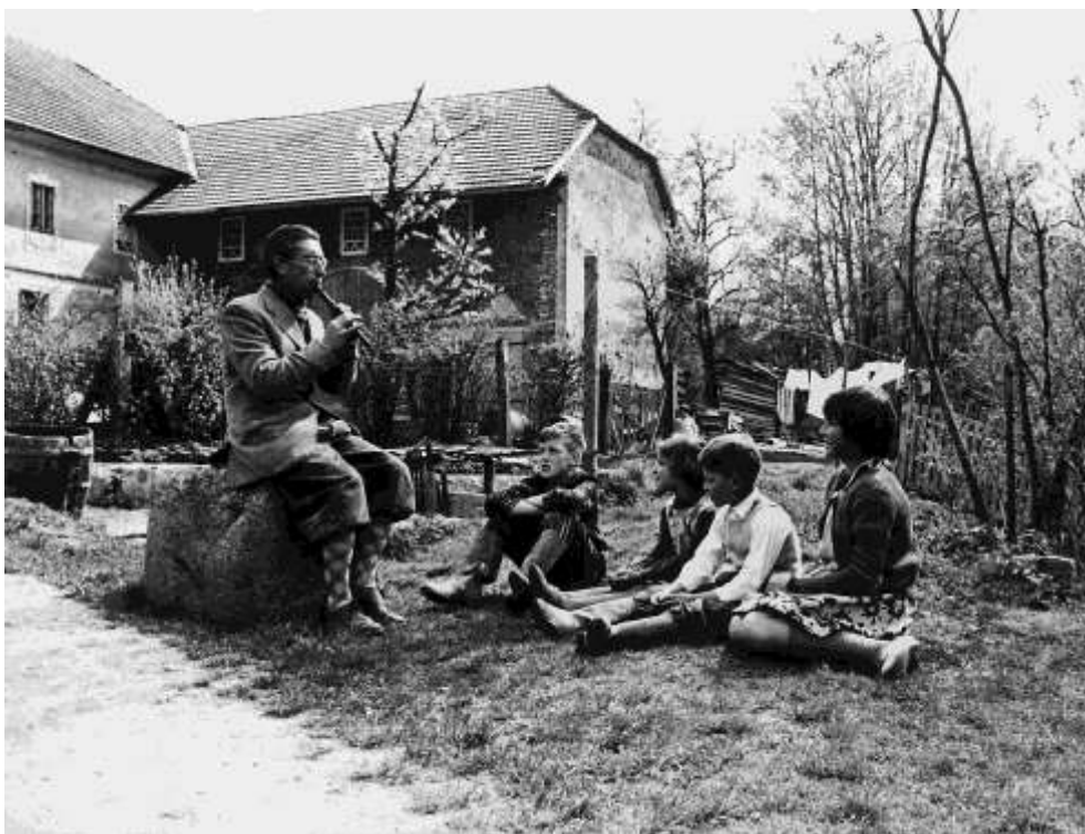
Menekült gyermekek zeneórán vesznek részt a szabadban.

A magyar menekültek beilleszkedését Európában megkönnyítette, hogy a háború után helyreállt gazdaság fejlődésnek indult a hatvanas évek elején. Ausztriában a legtöbb menekült a táborokból a nagyvárosokba próbált költözni, de olyanok is voltak, akik a vidéki élet békéjét és csendességét részesítették előnyben.