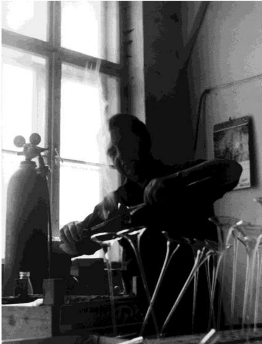
Egy magyar menekült saját szakmájában, üvegfúvóként talált munkát.

Miután megtanultak németül, a magyar menekültek könnyen találtak munkát Ausztriában. A gazdaság fellendült, és szükség volt jól képzett munkaerőre..