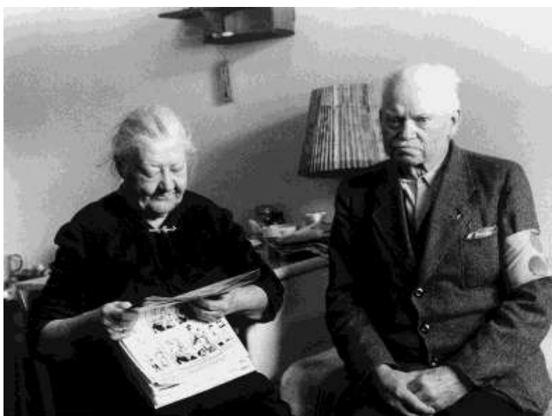
Sok fiatal és szakképzett menekült ki tudott költözni a táborokból, az idősebbek és csökkent képességűek hátra maradtak.