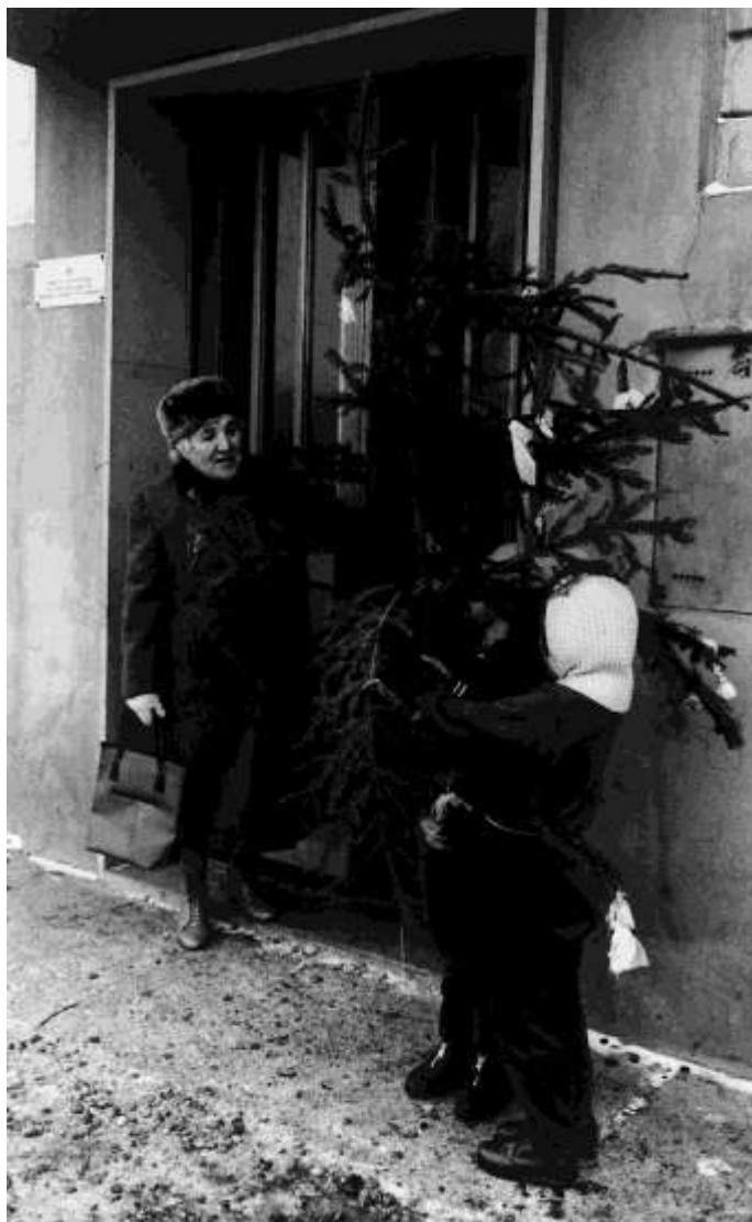
Sok hagyomány és szokás közös Ausztriában és Magyarországon, ilyen a karácsonyfa-díszítés is.

A beilleszkedés régi szokások megőrzésének és új szokások elsajátításának keverékéből áll, amíg az élet vissza nem tér a szokásos kerékvágásba. A beilleszkedés gyorsasága sok tényezőn múlik. Nagy szerepet játszik benne a kor, az iskolázottság és az egyéni hozzáállás.