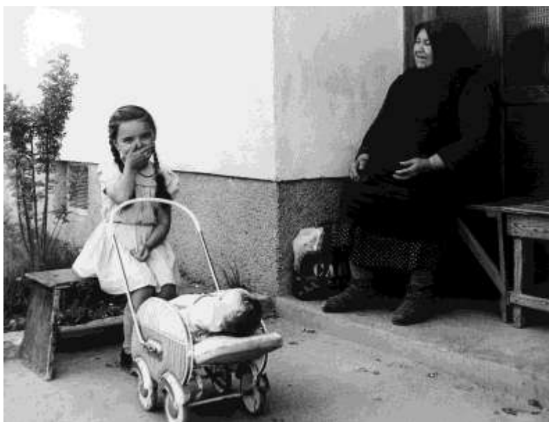
Amint azokban az időkben szokásos volt, három generációs menekült családok is éltek egy fedél alatt.