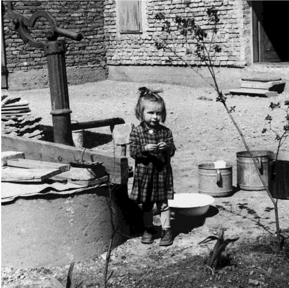
Menekült gyermek egy udvarban. A szegénység akkoriban nemcsak a magyar menekültek, hanem az osztrák állampolgárok között is gyakori volt. De az idők során javult a helyzet.