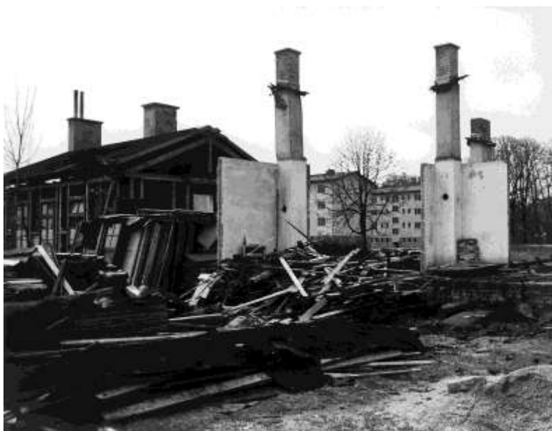
A menekültek beköltöztek az egykori tábor mögött épült új házakba. A régi tábor a menekülttábor-felszámolási program keretében lerombolják.