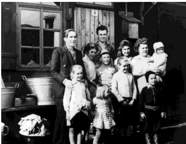
Nagy menekült család. A fiatalok házasodnak, gyermekek születnek, az élet a szokásos medrében folyik tovább.