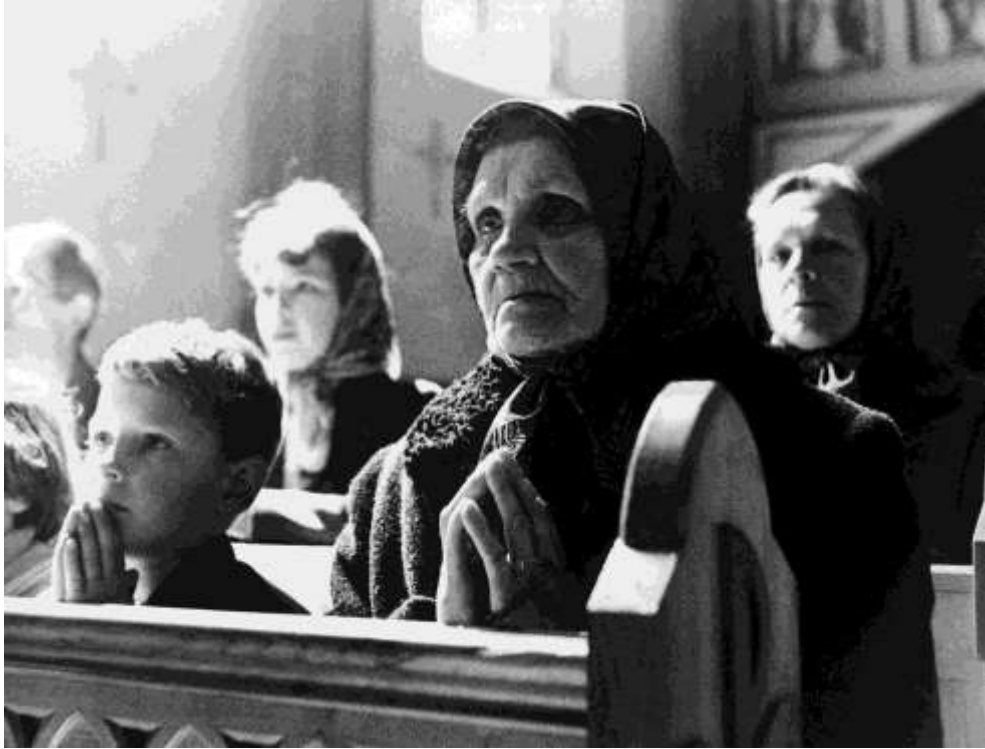
A vallásos menekültek számára a legfontosabb dolog a templomba járás volt. Néhány táborban még magyar nyelven is tartottak miséket.