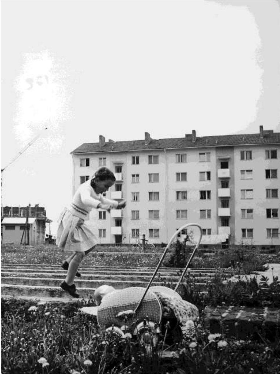
Ez a menekült kislány Ausztriában boldogan ugrál a lerombolt menekülttábor maradványain, miután – a kép háttérében látszó – lakóházat a Menekültügyi Főbiztosság programja keretében felépítették.