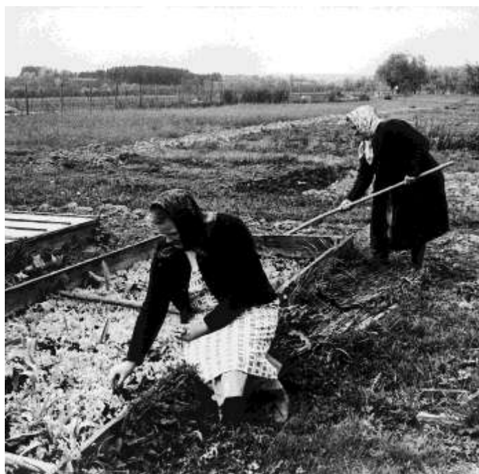
Vidékről származó menekült asszonyok zöldséget termesztenek. A magyar menekültek hasznosították az otthonról hozott tudást és gyakorlatot, hogy új életüket ezzel is segítsék.