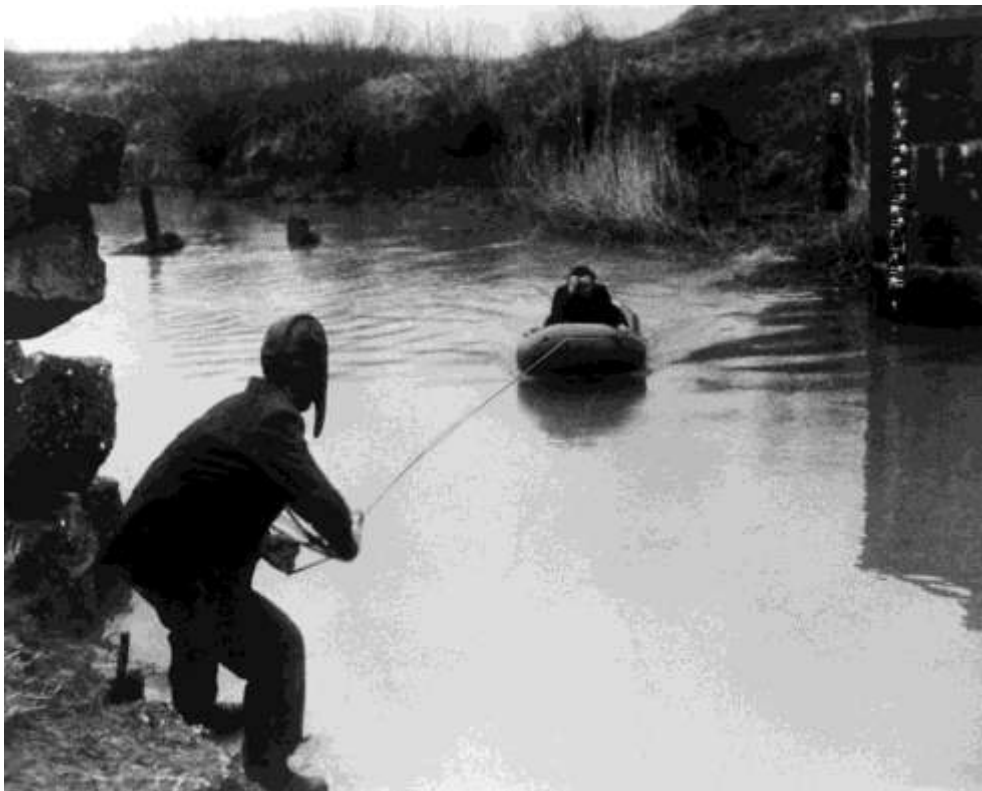
Ez a kép egy határfolyót és a vízen átkelő menekülteket ábrázolja (a pontos hely ismeretlen)

Közel három hónapja áramlanak át a magyar–osztrák határon a magyar menekültek. Sok embert megindított a sorsuk, és jöttek felajánlani a segítségüket. Ez a kép fiatal önkénteseket bemutató sorozat része. A fiatalok ideiglenes büfét állítottak fel közvetlenül a határ osztrák oldalán, a menekültek által használt fő átkelési pontnál, hogy kávéval vagy egy tál levestel fogadják az elfáradt magyarokat a szabad földön.