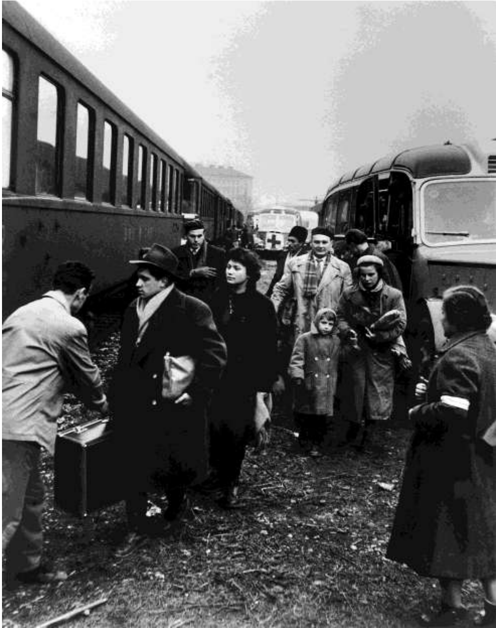
Ezek a menekültek egy Svájcba tartó vonatra szállnak fel, amely új befogadó országukba viszi őket.