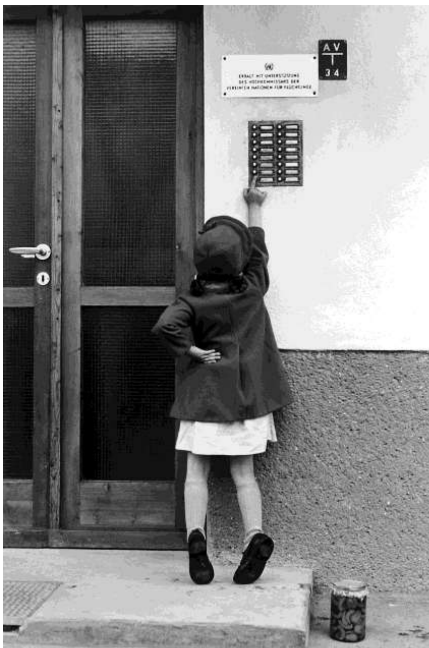
Egymás után zárják be és rombolják le a faházás táborokat, miután a menekültek kiköltöznek a Főbiztosság által épített olcsó bérlakásokba.