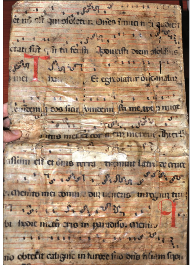
3. facsimile: Csiksomlyói Ferences Könyvtár (Csiki Székely Múzeum, Csikszereeda), Sign. Inv. 1766-69 (Cz. Fr. 10) (színes!)