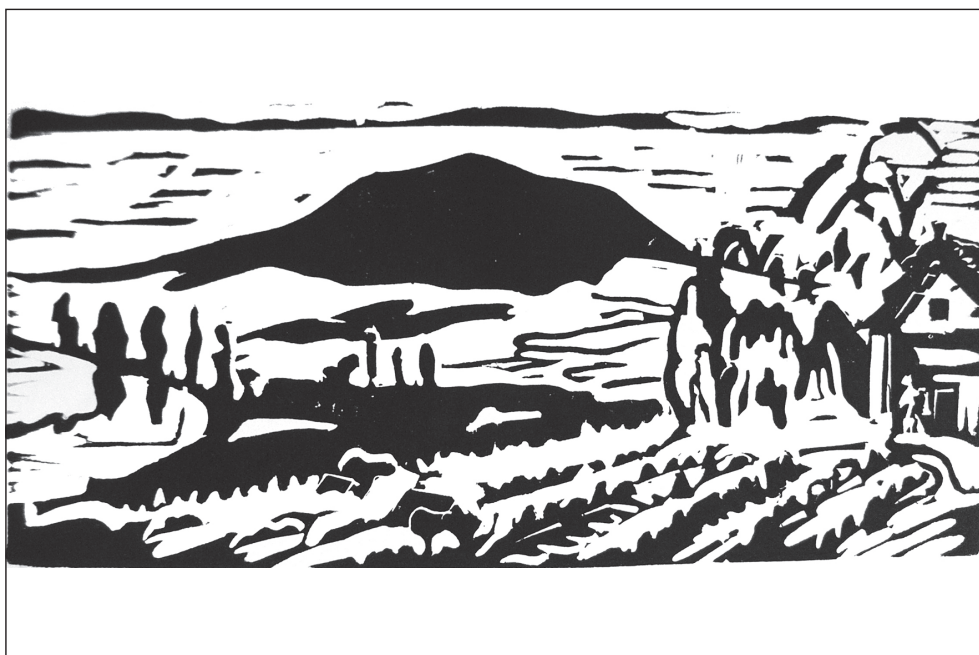
4. Ismeretlen művész: Szent György-hegy . Magántulajdon