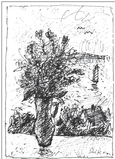
8. Szikra János: Virágcsendélet . Magántulajdon