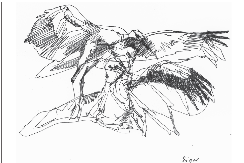
3. Eigel István: Madarak . Magántulajdon