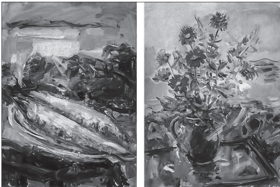
9. Szikra János: Téli Balaton, Virágcsendélet . http://artportal.hu